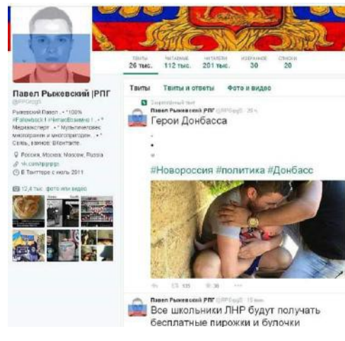
Мал. 2. Фейк на основі фото. Матеріали соцмереж