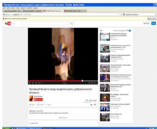
Мал.3. Матеріал із фейковим відео. Контент з соцмереж

Як ми вже з'ясували, фейк є доволі потужною та високотехнологічною зброєю, протистояти якій людині, що не має відповідної підготовки доволі важко, а іноді взагалі неможливо. В такому разі є необхідність розробки та систематизації певної добірки спеціалізованих (для державних і профільних громадських структур) й простих (для широких верств населення) інструментів ідентифікації та нейтралізації фейків. Основними напрямками роботи в цьому контексті можуть бути наступні: