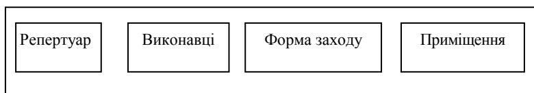
Рис. 2. Складові компоненти концерту як публічної форми репрезентації музики

На рис. 2 концерт показано як одиничний акт публічної репрезентації музики, де окреслено його компоненти, поза якими він не може існувати.