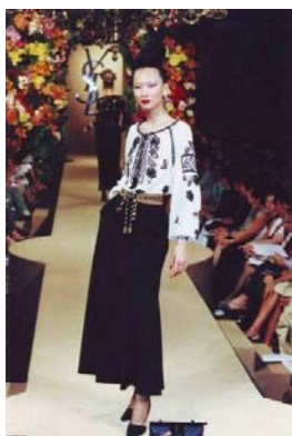
Рис. 1. Модель Ів Сен Лоран в етностилі