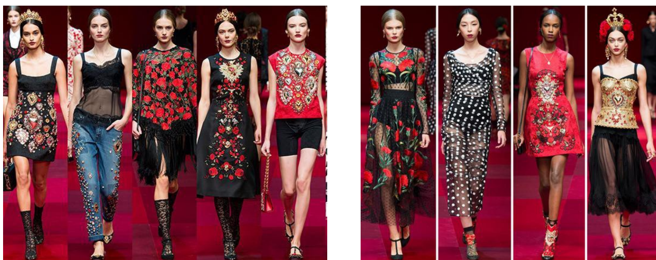
Рис. 3, 4. Колекція Dolce&Gabbana (сезон весна-літо 2015)

2013 року бренд Dolce & Gabbana створив колекцію одягу, в якій домінуючими елементами декору була українська вишивка. Одяг завоював відомих модниць і весь світ різко зацікавився традиціями української культури.