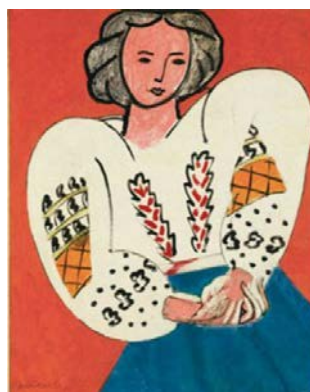
Рис. 2. Картина Матісса «Румунська блузка»