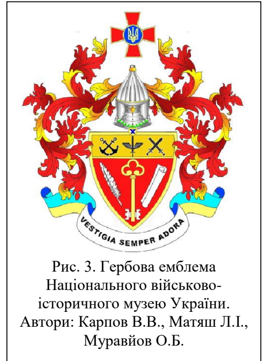
Рис. 3. Гербова емблема Національного військово-історичного музею України. Автори: Карпов В.В., Матяш Л.І., Муравйов О.Б.

Не менш цікавою є історія створення герба (гербової емблеми) Національного військово-історичного музею України (рис. 3). Така емблема є особливим знаком, в якому відображається суть діяльності музею – надання доступу до знань і ведення літопису воєнної історії. Цей символ був апробований у ході внутрідержавних і міжнародних зв'язків музею, та підтвердив тезу, що наголошує на підвищенні впізнаваності й популярності установи в Україні та світі, посиленню її престижу. За свідченнями В.В. Карпова, щодо