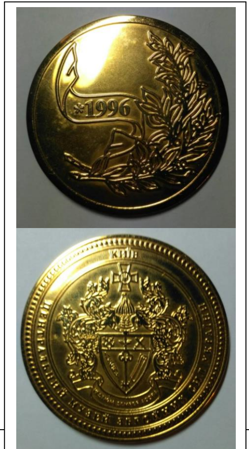
Фото 1. Пропам'ятна медаль Національного військово-історичного музею України