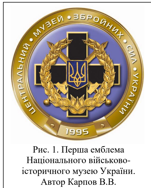
Рис. 1. Перша емблема Національного військово-історичного музею України. Автор Карпов В.В.

В основі емблеми на синьому тлі розміщено чорного кольору Залізний Хрест Армії УНР (першу українську військову нагороду). Поверх нього – два перехрещені мечі золотого кольору вістрям угору, покладені Андріївським хрестом. Поверх хреста і шабель зображено Малий Державний герб України у державній синьо-жовтій колористиці. Комплекс обрамлений дубовими (символ неодноразового прояву сили, мужності та міці) і лавровими (символ слави) гілками золотого