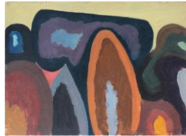
Рис. 3. М. Малишко. Вирощені дерева. 1964. Картон, олія. 35х49. Власність художника.

Етюди цілком формалістичні, їм притаманний декоративізм. Малишко використовує контрастні чисті кольори, що надає виразності формі зображуваних об'єктів. Дуже часто він окреслює предмети насиченими кольоровими лініями, таким чином, акцентуючи на них увагу. Проблематика кольору з роками не втратила для митця своєї актуальності й проходить червоною ниткою крізь весь живописний доробок майстра.