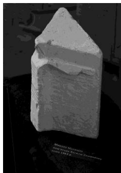
Рис. 4. Микола Малишко. Ескіз пам'ятника Василю Симоненку. 1963.

Саме проєкт Миколи Малишка затвердили до виконання. На той час вже було домовлено про матеріал, в якому мав бути реалізований пам'ятник. Це був камінь – граніт, що знаходився на території Художнього комбінату. Малишко прив'язується до цього матеріалу і в ескізі показує саме його. Він виготовив макет (ескіз) пам'ятника з глини, а його товариш Володимир Прядка допоміг зробити зліпок із гіпсу 2 (рис. 4).