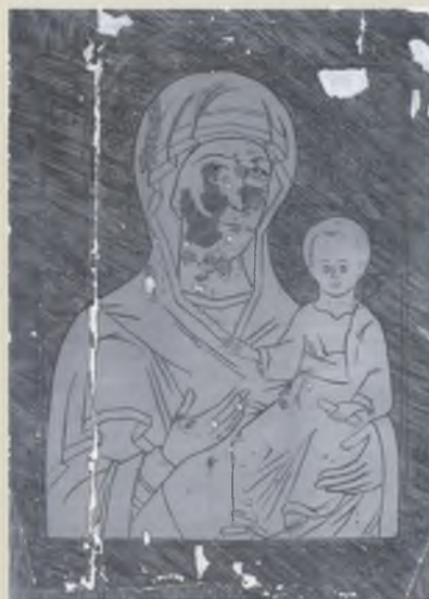
Калька с двусторонней иконы «Богоматерь Одигитрия. Богоявление Господне». XVI–XVII вв. ТММО