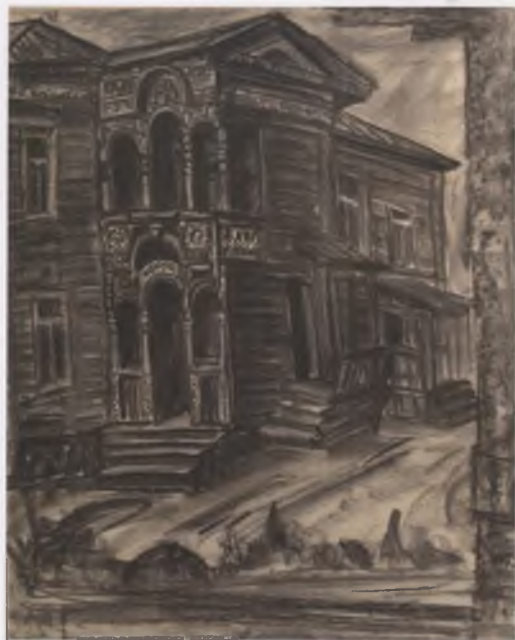
Дервянный дом. Вологда. 2000.