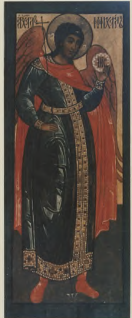
Икона «Архангел Михаил». XVII в. КБИАХМЗ