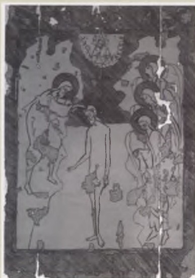
Калька с двусторонней иконы «Богоявление Господне. Богоматерь Оди- гитрия». XVI-XVII вв. ТММО