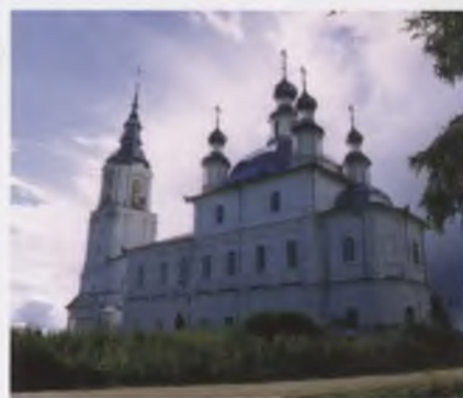
Церковь Архангела Михаила (1770) с. Архангельское Сокольского района. 2005