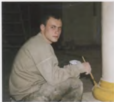
В интерьере трапезной палаты (1519) Кирилло-Белозерского монастыря. Подготовка под золочение базовых оснований колонн (XIX в.). А. В. Соколов. 2005