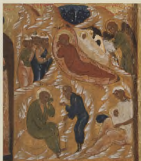
Фрагмент иконы-минеи «Декабрь»: Рождество Христово. Конец XVI в. ВГИАХМЗ