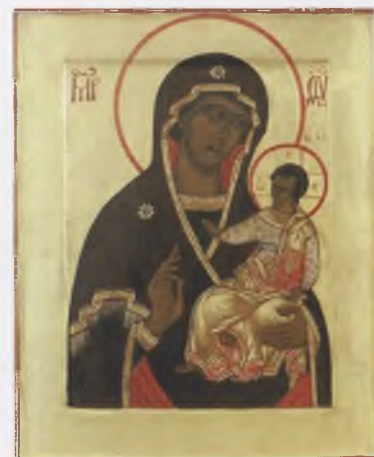
Икона «Богоматерь Одигитрия». 1998. Собственность автора