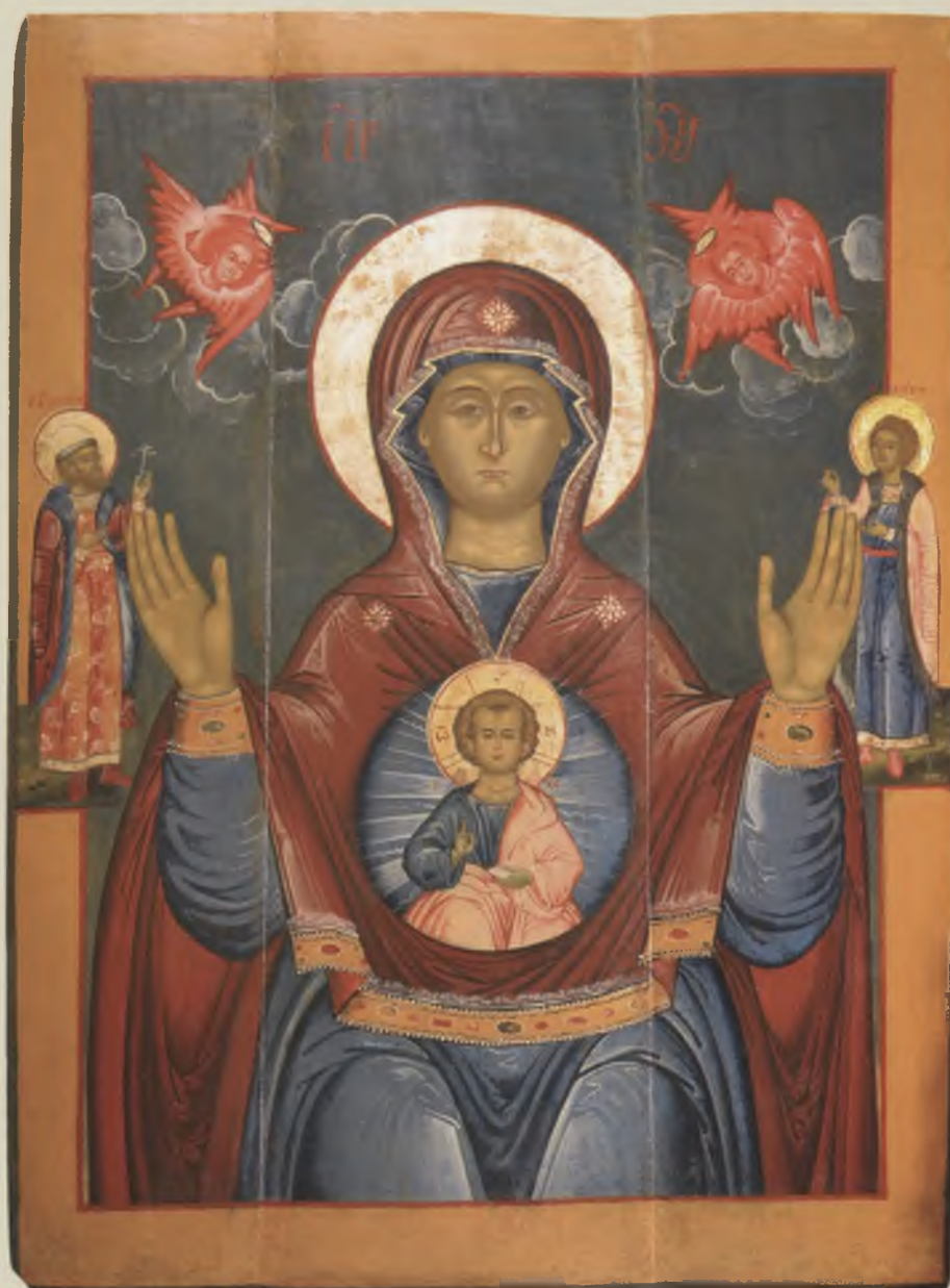
Икона «Богоматерь «Знамение», со святыми Борисом и Глебом». XVII в. УКМ