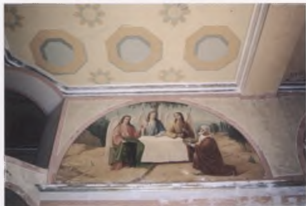
Композиция «Ветхозаветная Троица» (XIX в.). Настенная живопись второго этажа храма Рождества Богородицы (1837) г. Вологды. В процессе реставрации. Фото 2008