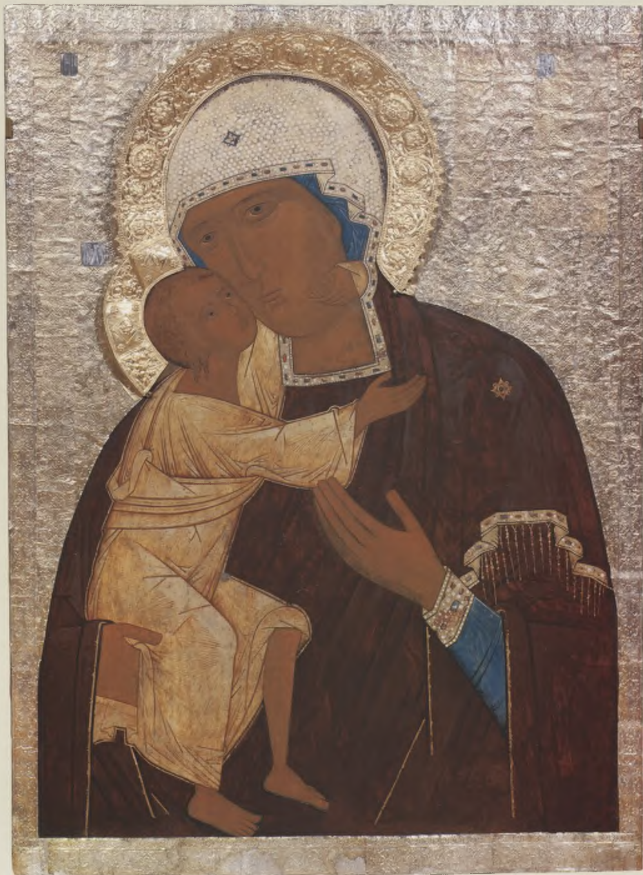
Икона «Богоматерь Федоровская» в басменном окладе. Середина – вторая половина XVI в. ВГИАХМЗ