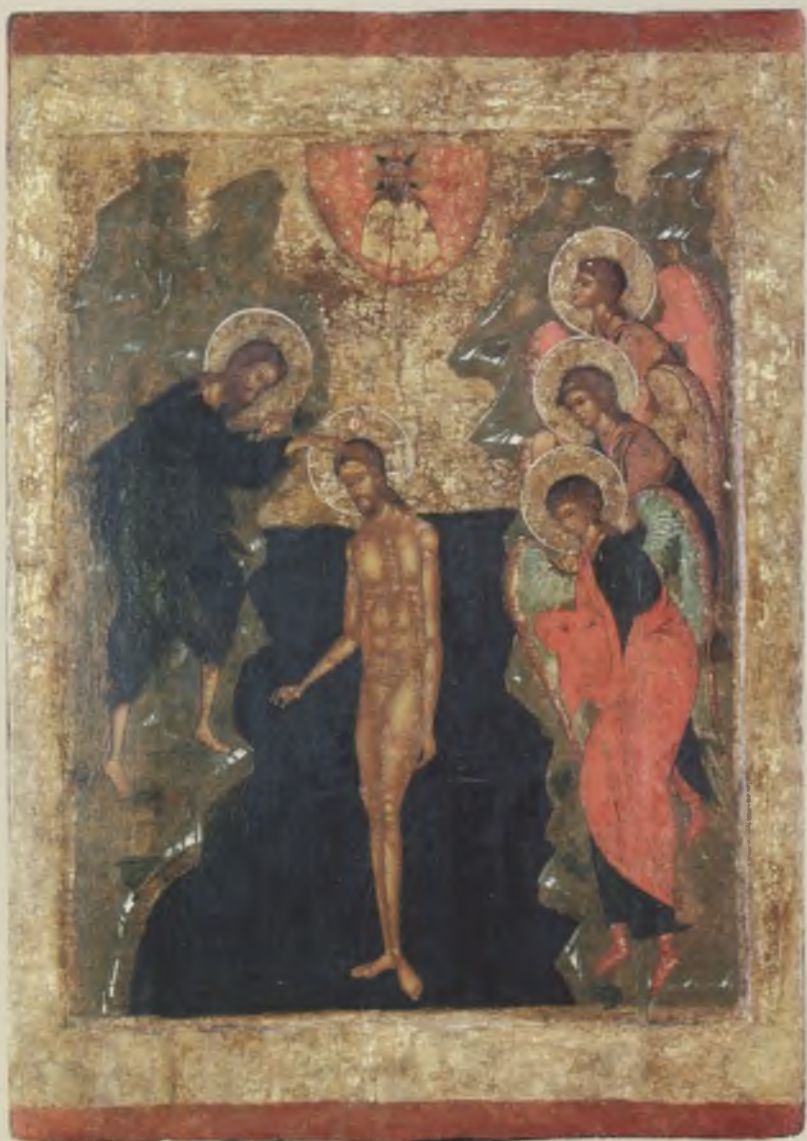
Двусторонняя икона «Богоявление Господне. Богоматерь Одигитрия». XVI-XVII вв. ТММО