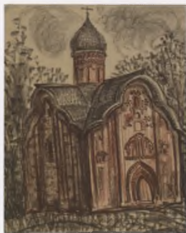
Церковь Петра и Павла в Кожевниках. Великий Новгород. 2001.