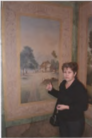
В интерьере деревянного купеческого дома (1825) на ул. Герцена, д. 38 г. Вологды. О. А. Соколова. 2010