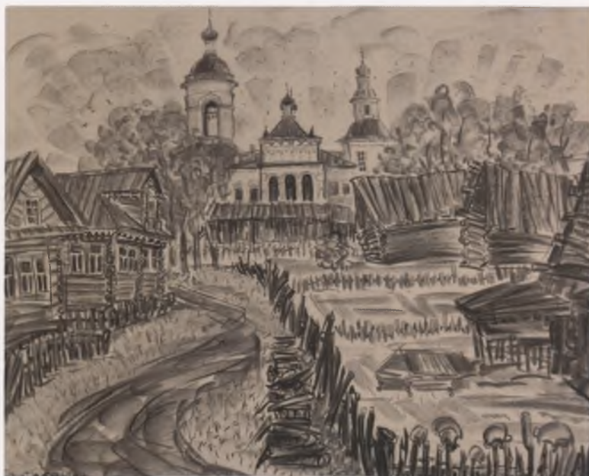
День в Усть-Печенге. 2002.