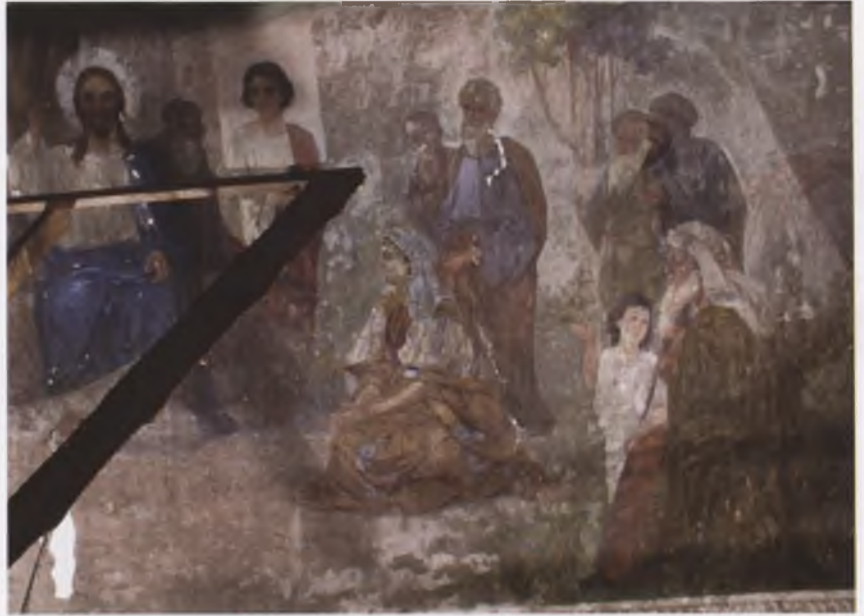
Композиция «Исповедь Господня». Церковь Воздвижения Креста Господня (1809) с. Воздвиженье Вологодского района. Фото 2004