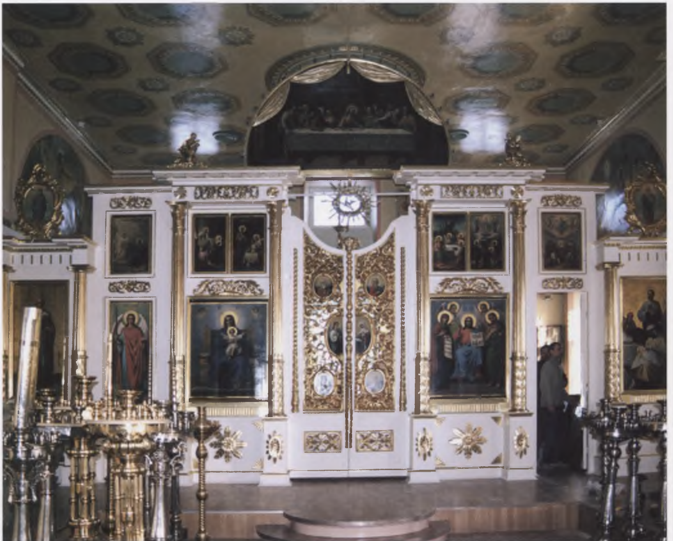
Интерьер второго этажа храма Рождества Богородицы (1837) г. Вологды. Фото 2008