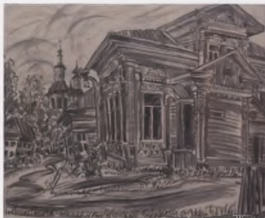
Тотемское узорочье. 2002. Собственность автора