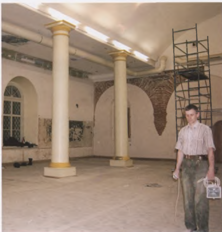
Интерьер трапезной палаты (1519) Кирилло-Белозерского монастыря. В. И. Соколов. 2005