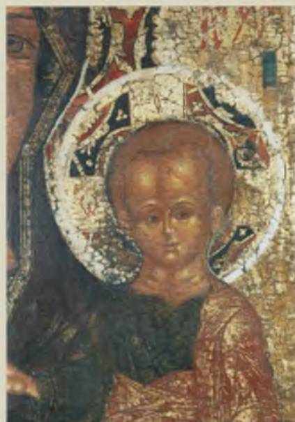
Фрагмент двусторонней иконы «Богоматерь Одигитрия. Богоявление Господне». XVI–XVII вв. ТММО. После реставрации