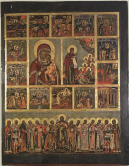
Икона «Богородица Толгская и Боголюбская». XVII в. УКМ