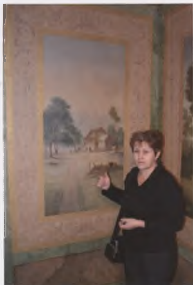
В интерьере деревянного купеческого дома (1825) на ул. Герцена, д. 38 г. Вологды. О. А. Соколова. 2010