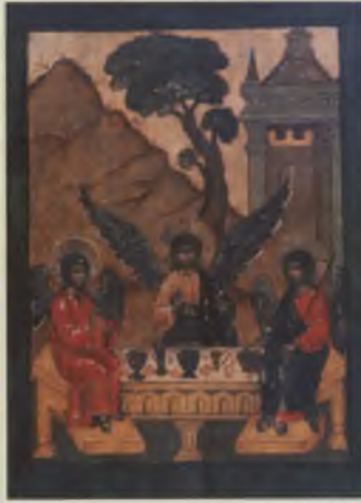
Икона «Троица». XVII в. КБИАХМЗ