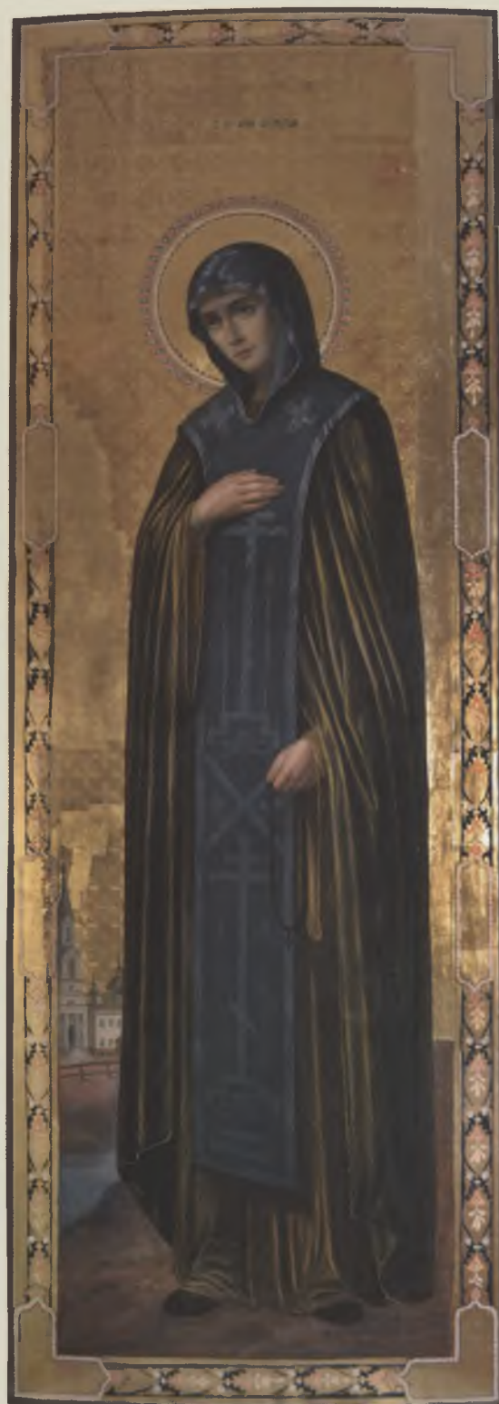
Икона «Анна Кашинская». XIX в. Свято-Троицкий Павло-Обнорский монастырь