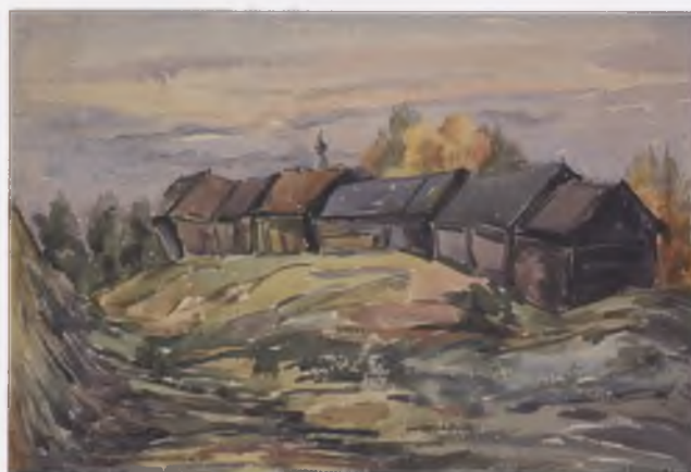
Вал в Белозерске. 2006.