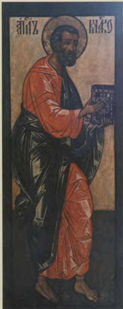
Икона «Апостол Марк». XVII в. КБИАХМЗ