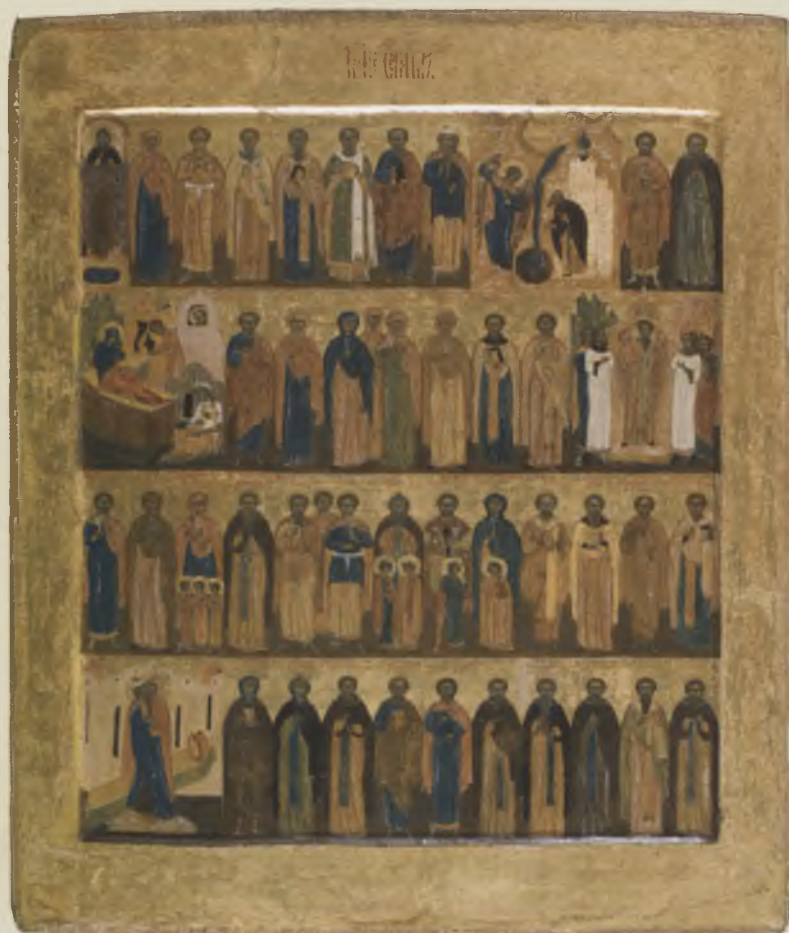
Икона-минея «Сентябрь». Конец XVI в. ВГИАХМЗ