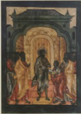
Икона «Уверение Фомы». XVII в. КБИАХМЗ