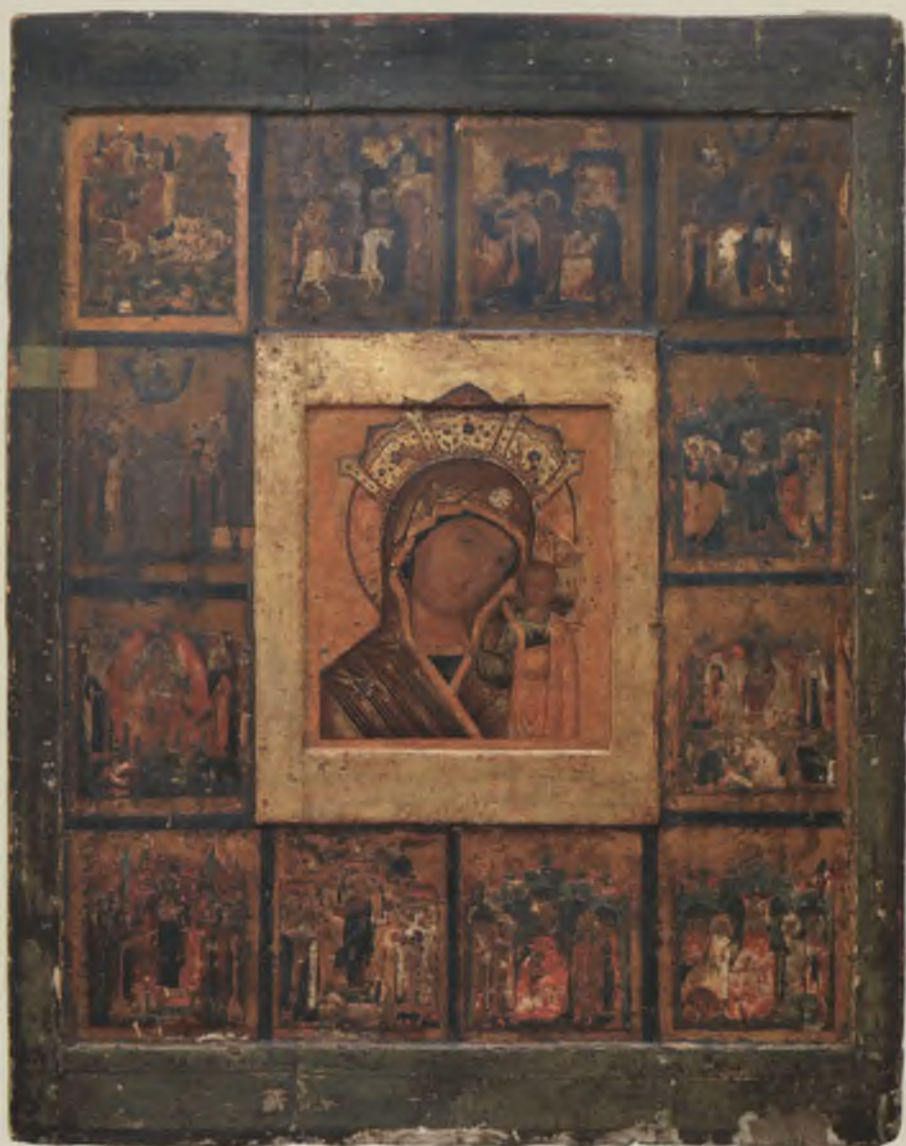
Икона «Богоматерь Казанская, с клеймами жития». XVII в. УКМ. В процессе реставрации