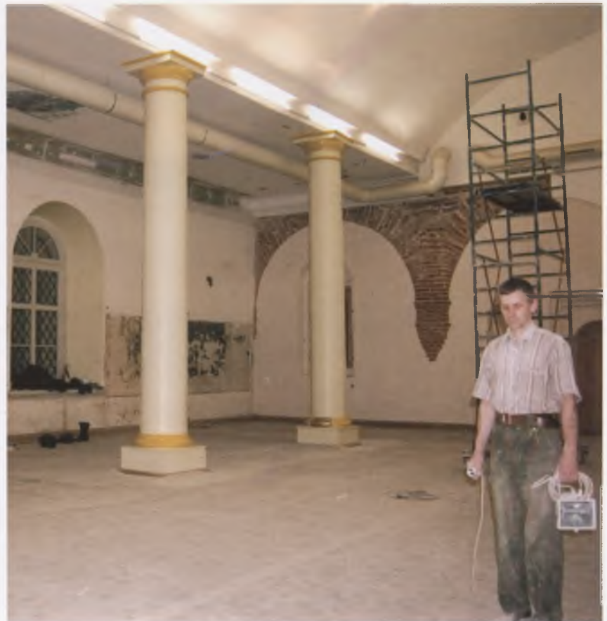
Интерьер трапезной палаты (1519) Кирилло-Белозерского монастыря. В. И. Соколов. 2005