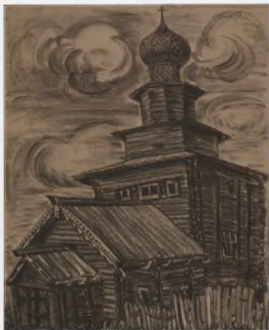
Церковь Ильи Пророка. Белозерск. 1999. Собственность автора