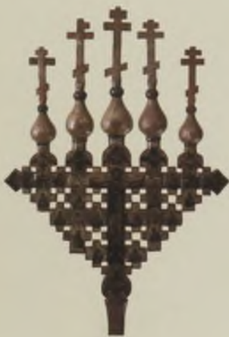
Крест запрестольный, выносной «Распятие. Деисус и избранные святые». Вторая половина XVII в. Оборотная сторона. ВГИАХМЗ