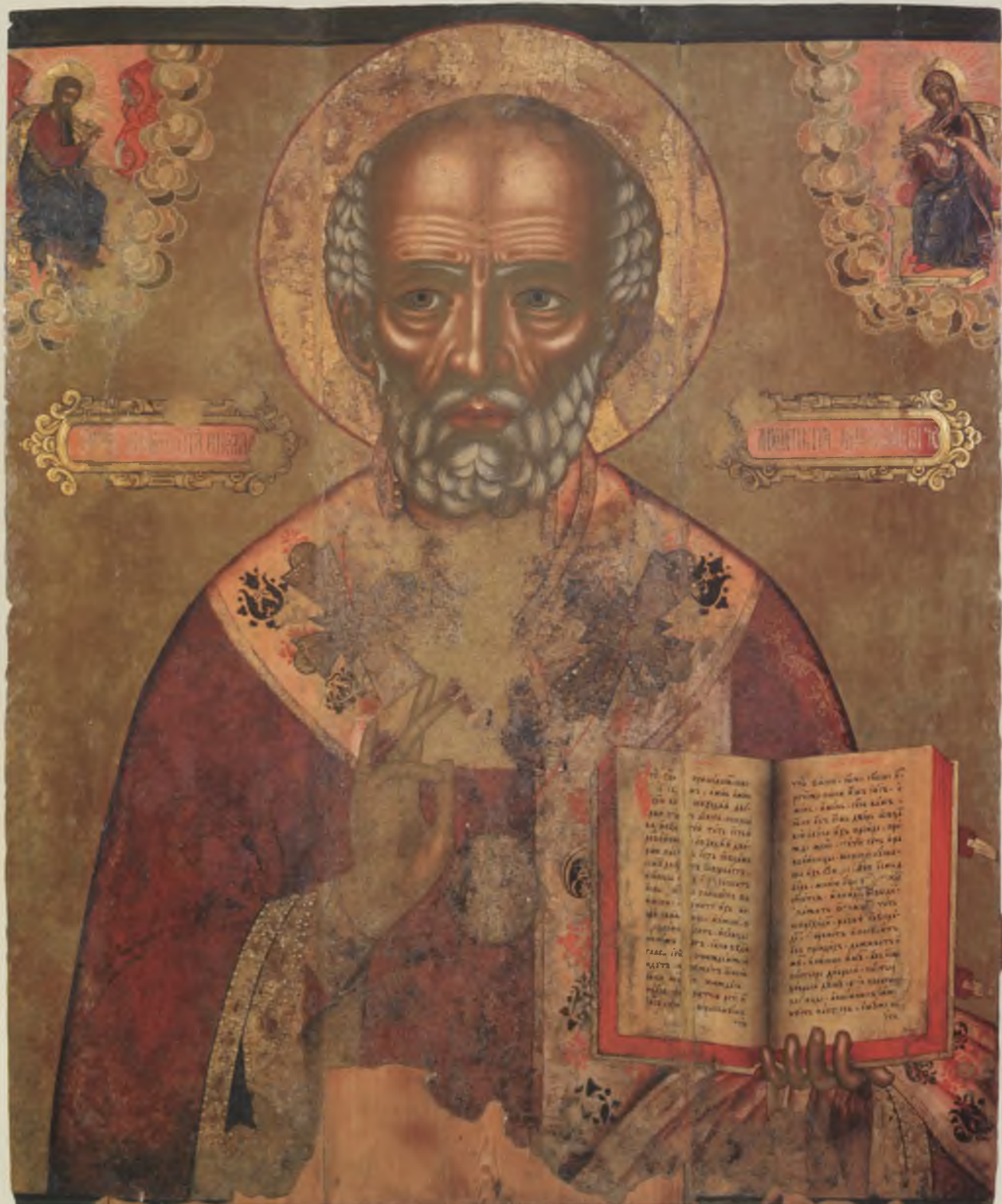
Икона «Святитель Николай Чудотворец». Конец XVII – начало XVIII вв. УКМ