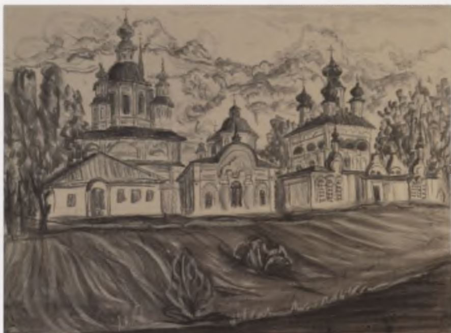
Набережная в Великом Устюге. 2008. Собственность автора