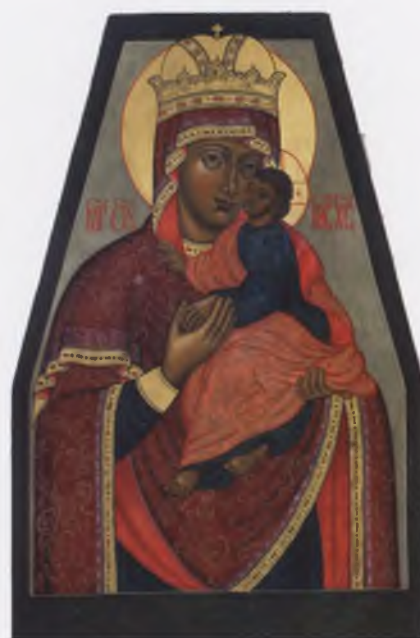
Икона «Богоматерь Киевская». 1998. Собственность автора

Дерево, паволока, левкас, темпера, золото. 51,5x19x3,2. Собственность автора.