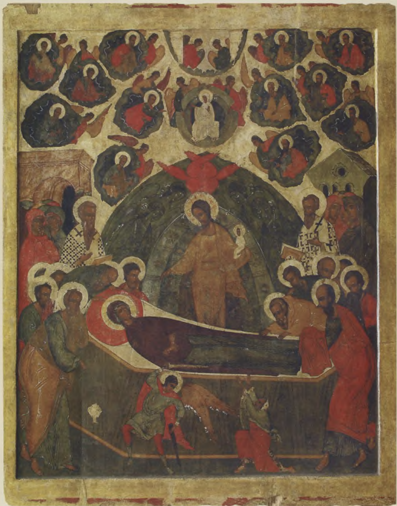
Икона «Успение Богородицы». Конец XVI в. БОКМ