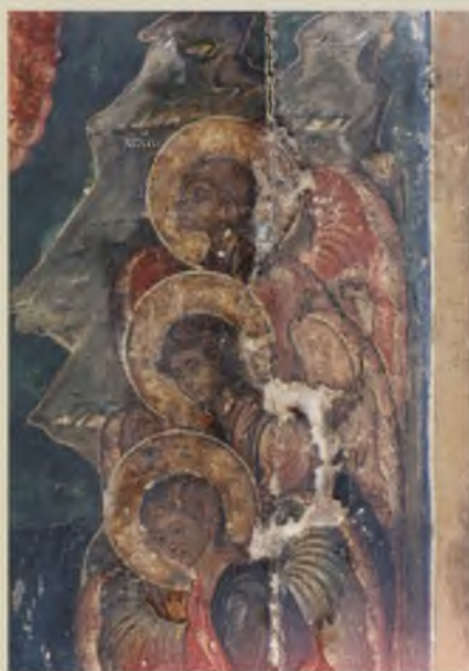
Фрагмент иконы «Богоявление Господне. Богоматерь Одигитрия». XVI-XVII вв. ТММО. До реставрации