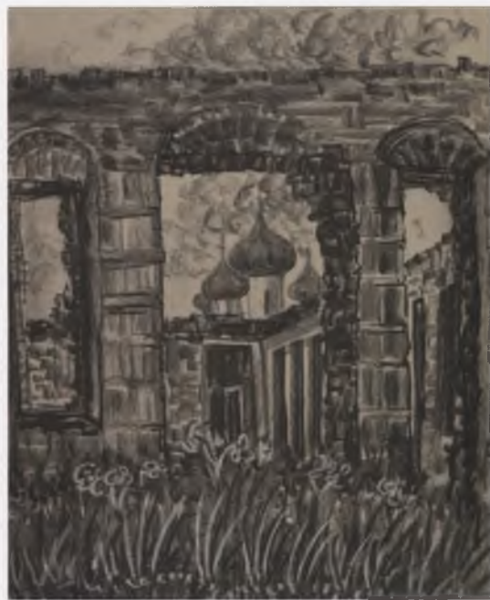
«Устюжна, ты моя боль...». 2001. Собственность автора