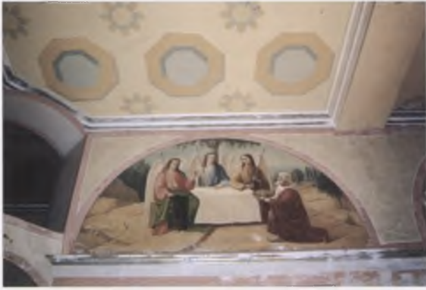
Композиция «Ветхозаветная Троица» (XIX в.). Настенная живопись второго этажа храма Рождества Богородицы (1837) г. Вологды. В процессе реставрации. Фото 2008