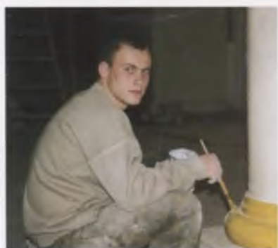
В интерьере трапезной палаты (1519) Кирилло-Белозерского монастыря. Подготовка под золочение базовых оснований колонн (XIX в.). А. В. Соколов. 2005