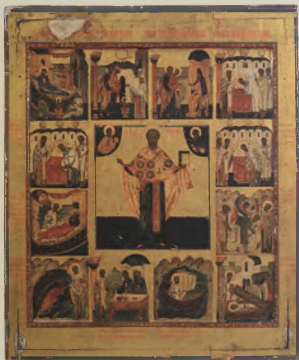
Икона «Никола Зарайский, с житийными клеймами». XVII – XVIII вв. УКМ