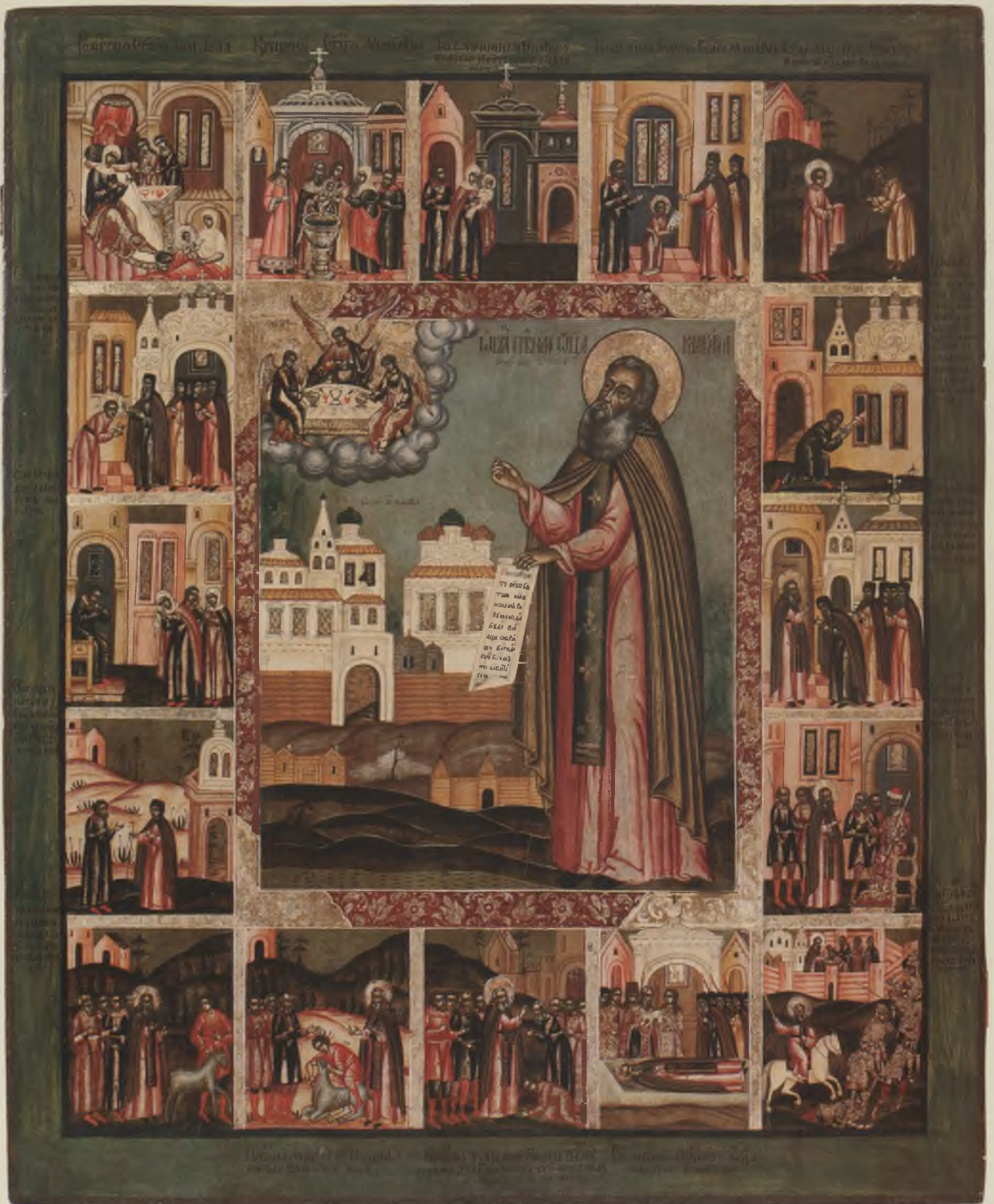
Икона «Макарий Унженский, с житием». Начало XVIII в. ВГИАХМЗ