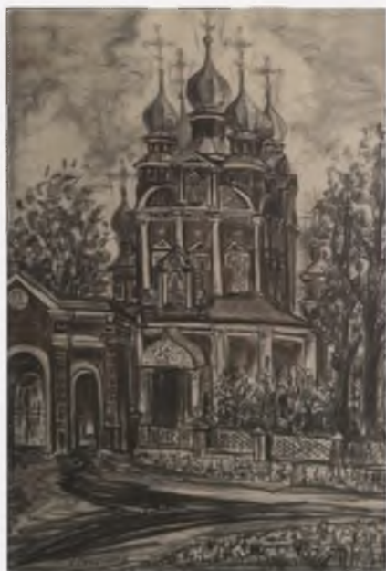
Казанская церковь. Устюжна. 2004.

1. Церковь Ильи Пророка. Белозерск. 1999.