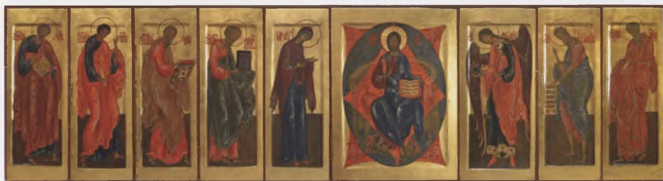
Иконы деисусного чина. 1999 – 2000. Собственность автора