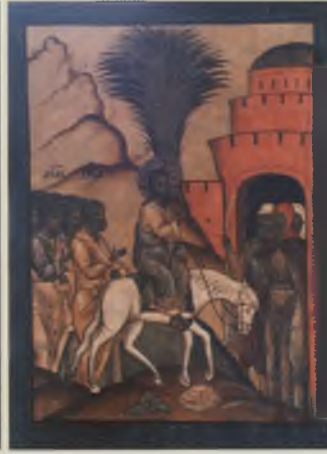
Икона «Вход в Иерусалим». XVII в. КБИАХМЗ