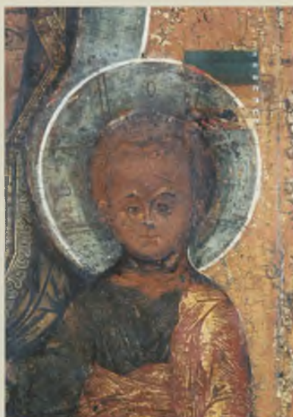
Фрагмент двусторонней иконы «Богоматерь Одигитрия. Богоявление Господне». XVI–XVII вв. ТММО. В процессе реставрации