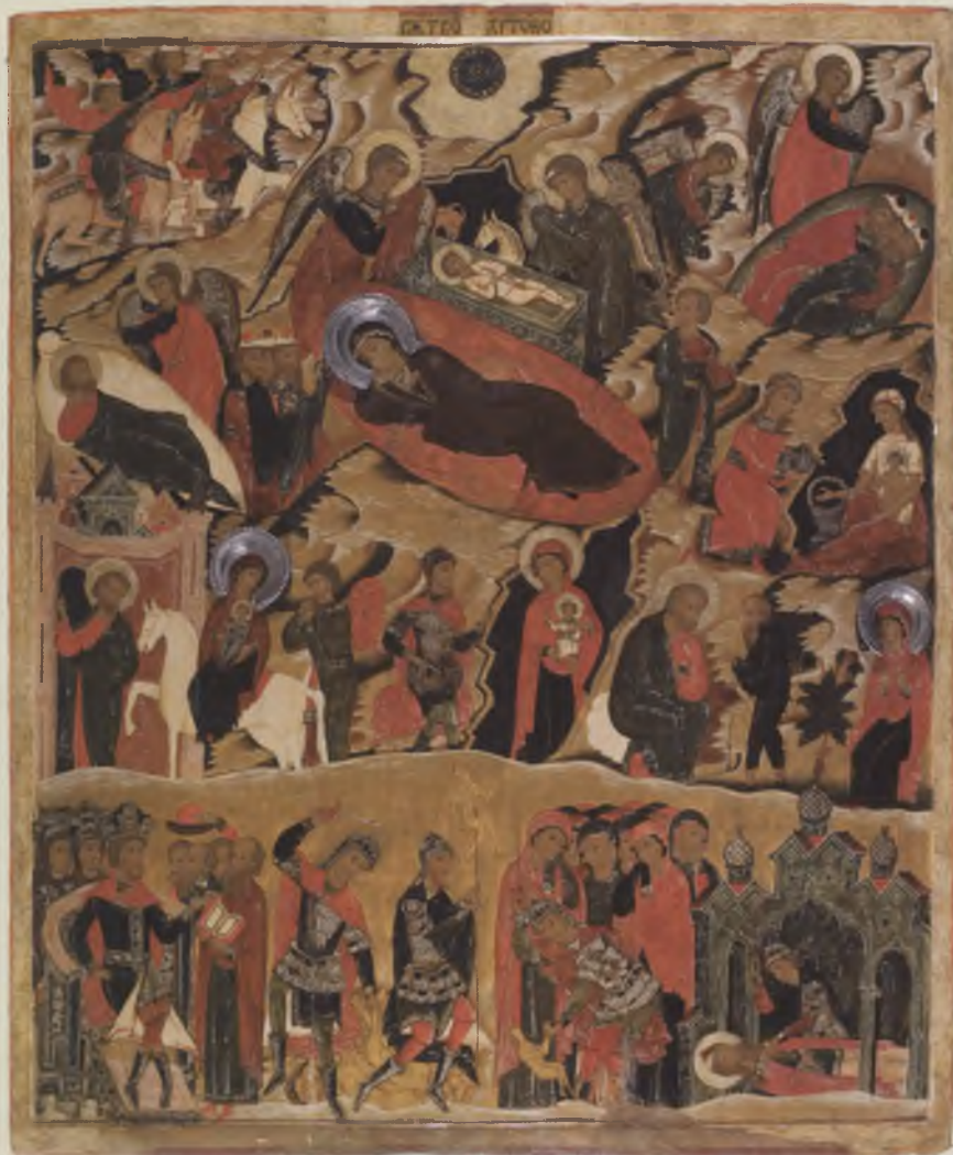
Икона «Рождество Христово», XVII в. ВГИАХМЗ