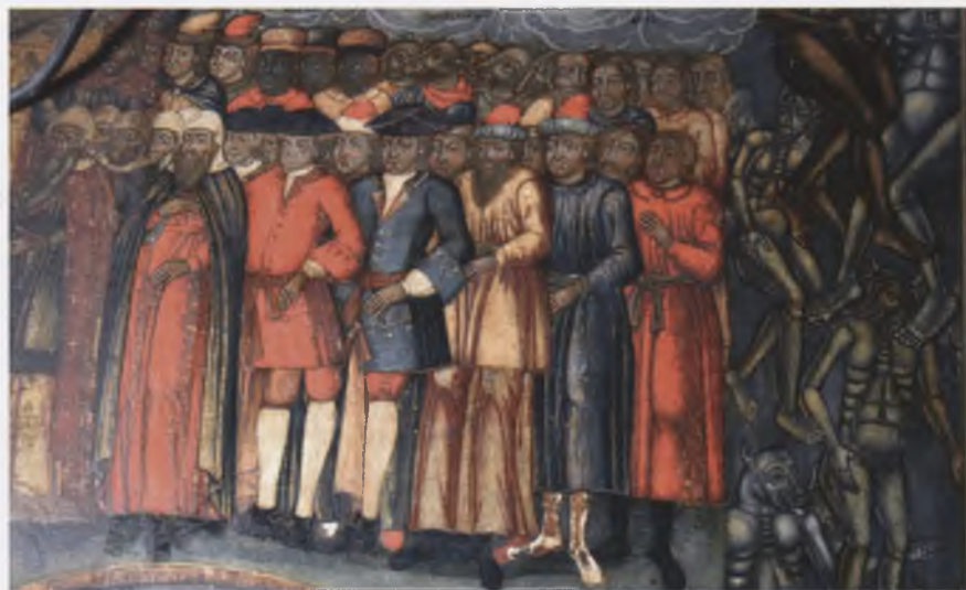
Фрагмент иконы «Страшный суд». 1785. ВГИАХМЗ