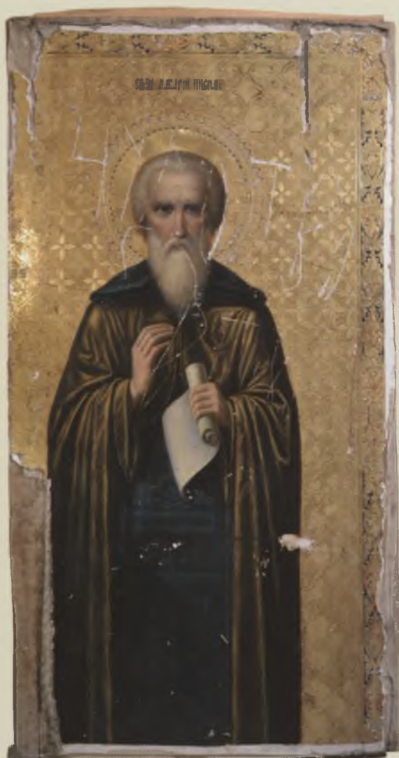
Икона «Макарий Писемский». XIX в. Свято-Троицкий Павло-Обнорский монастырь. До реставрации