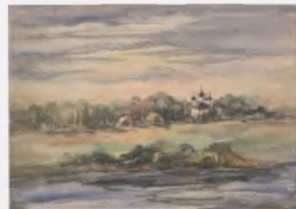
Набережная Мологи. Устюжна. 2006.

ВОУНБ – Вологодская областная универсальная научная библиотека им. И. В. Бабушкина