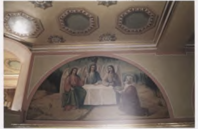
Композиция «Ветхозаветная Троица» (XIX в.). Настенная живопись второго этажа храма Рождества Богородицы (1837) г. Вологды. После реставрации. Фото 2008