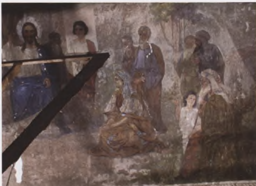
Композиция «Исповедь Господня». Церковь Воздвижения Креста Господня (1809) с. Воздвиженье Вологодского района. Фото 2004