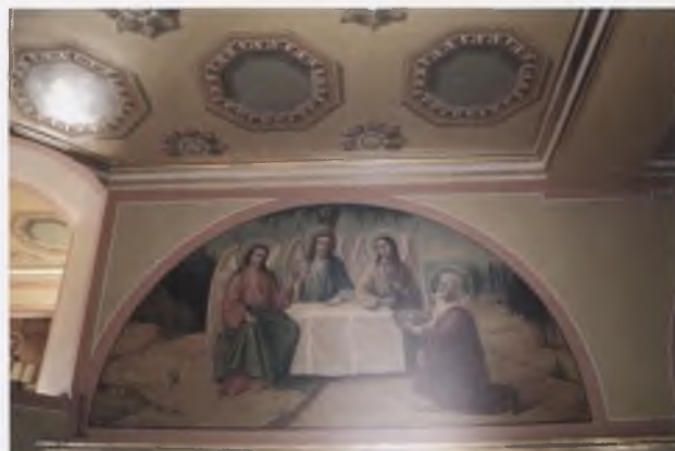
Композиция «Ветхозаветная Троица» (XIX в.). Настенная живопись второго этажа храма Рождества Богородицы (1837) г. Вологды. После реставрации. Фото 2008