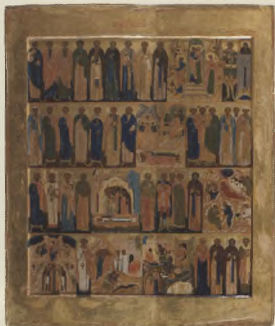
Икона-минея «Декабрь». Конец XVI в. ВГИАХМЗ