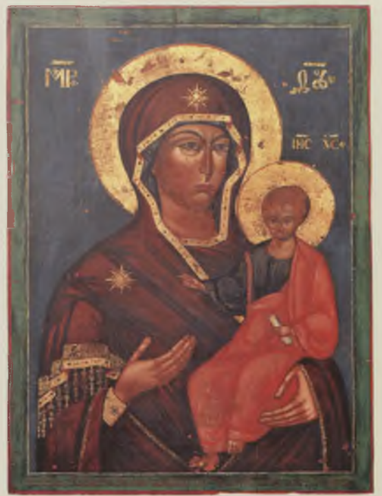
Икона «Богородица Смоленская», 1776. УКМ