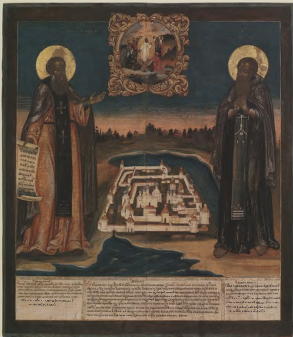
Икона «Кирилл Белозерский и Кирилл Новозерский». Вторая четверть XVIII в. ВГИАХМЗ