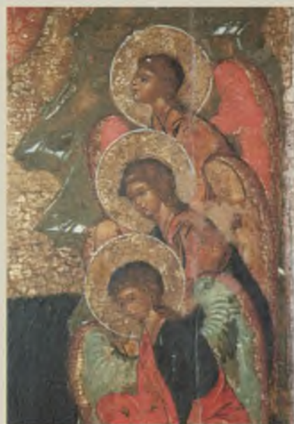
Фрагмент иконы «Богоявление Господне. Богоматерь Одигитрия». XVI-XVII вв. ТММО. После реставрации