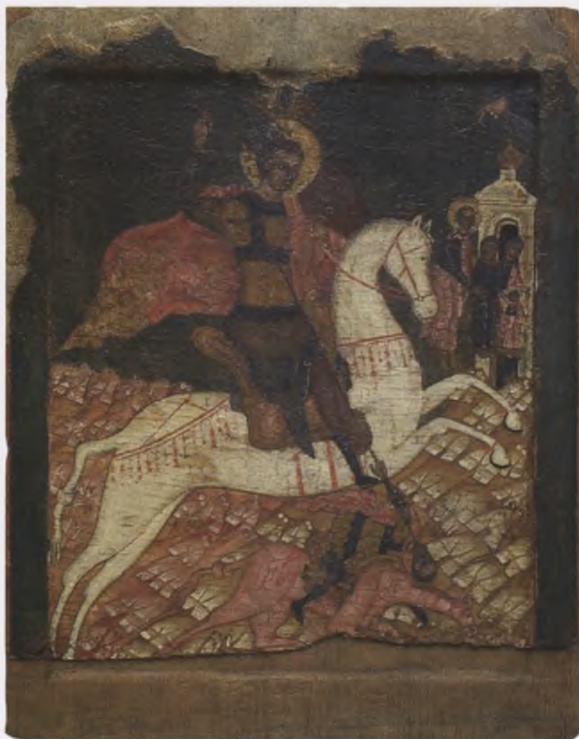
Икона «Димитрий Солунский». XV в. Собрание А. В. Гулько (п. Шексна Вологодской области)

Игумен Дионисий, наместник Спасо-Прилуцкого Димитриева монастыря