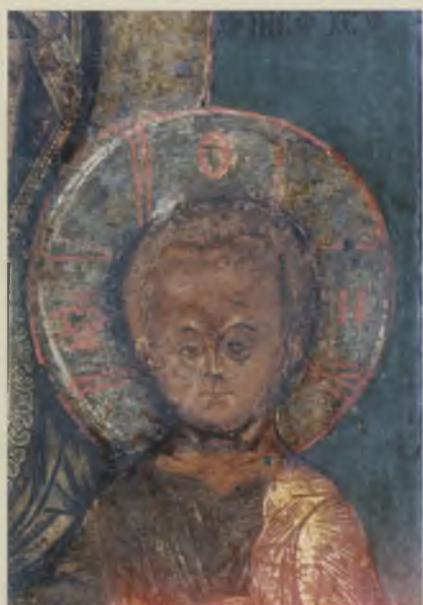
Фрагмент двусторонней иконы «Богоматерь Одигитрия. Богоявление Господне». XVI–XVII вв. ТММО. До реставрации