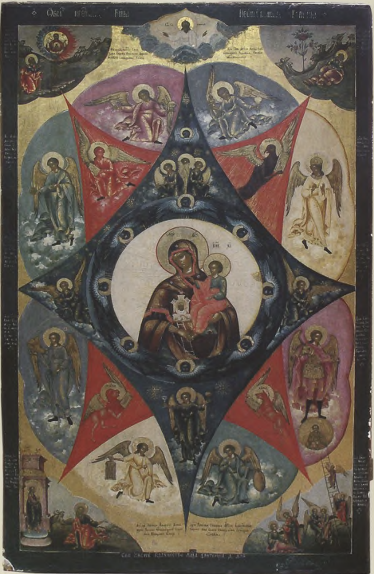
Икона «Неопалимая Купина». Первая треть XIX в. ЧерМО