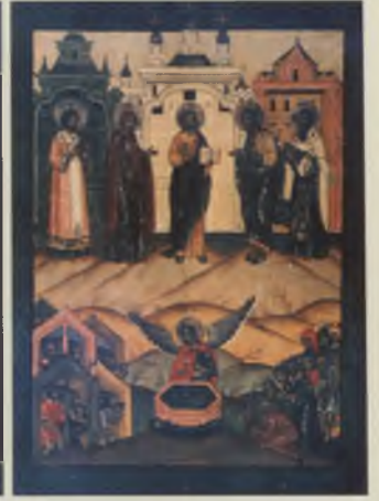
Икона «Присхождение креста Господня». XVII в. КБИАХМЗ