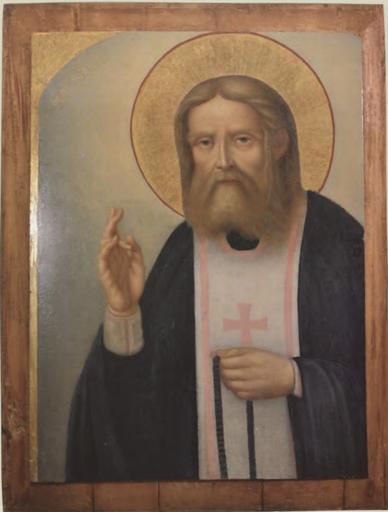
Икона «Серафим Саровский». XIX в. Свято-Троицкий Павло-Обнорский монастырь