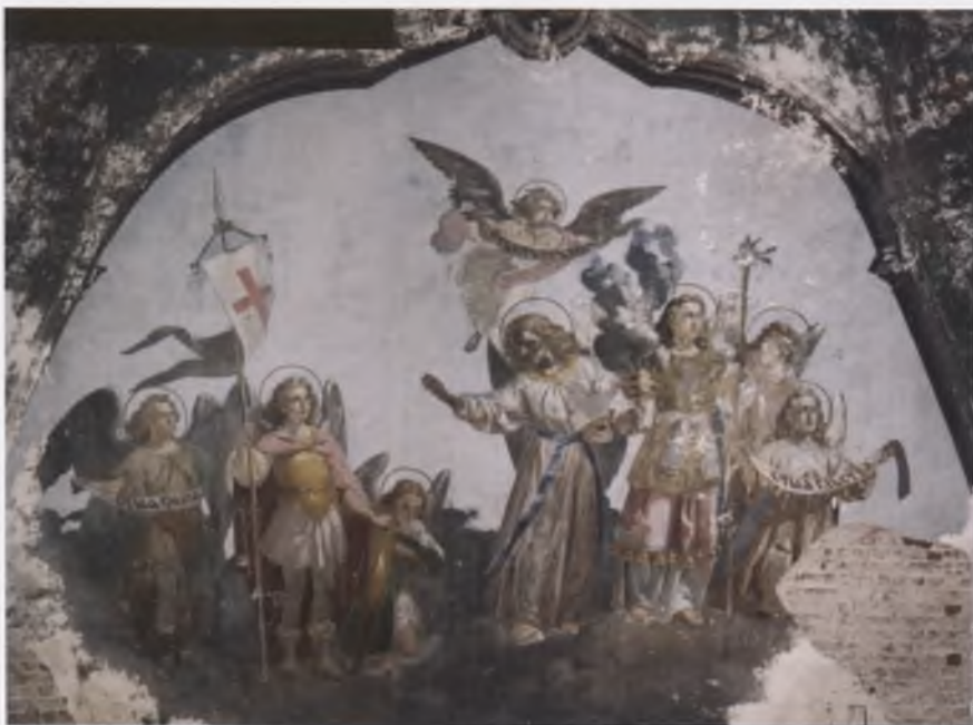
Тюрин П. С. (1816–1882). «Небесная иерархия». Композиция северного свода церкви Архангела Михаила (1770). Фото 2006

2008–2009 – реставрация масляной живописи (XX в.) потолочного плафона в фойе кинотеатра «Комсомолец» (1957) на ул. Горького, д. 22 г. Череповца. ООО «Образ Севера».