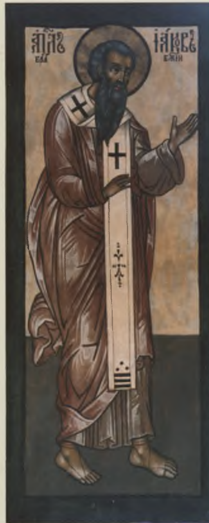
Икона «Апостол Иаков». XVII в. КБИАХМЗ