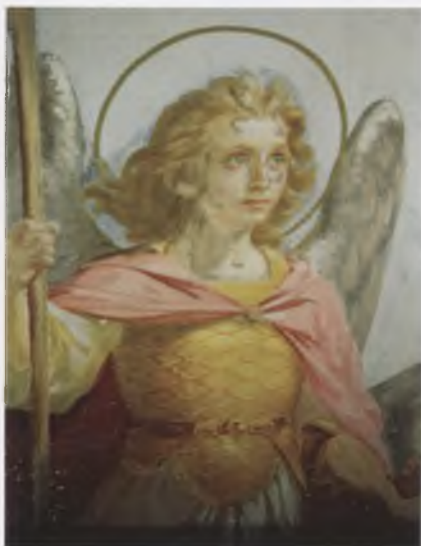
Тюрин П. С. (1816–1882). Архангел Михаил. Фрагмент композиции Небесная иерархия северного свода церкви Архангела Михаила (1770). Фото 2006

1983–1984 – исследование фресок (1502) собора Рождества Богородицы (1490) Ферапонтова монастыря. ВУ МСНРПМ.