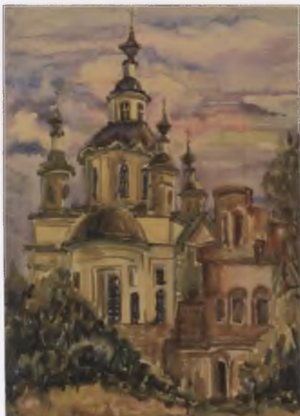
Тотьма. Спасо-Суморин монастырь. 2005.

16. Художники Вологодской области XX века. Альманах/Автор вступит. статьи В.В. Воропанов. Сост. И.Б. Балашова, В.В. Воропанов,