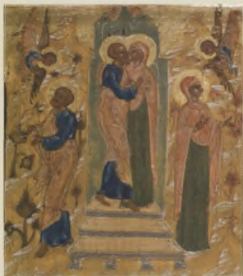
Фрагмент иконы-минеи «Декабрь»: Зачатие праведной Анны. Конец XVI в. ВГИАХМЗ