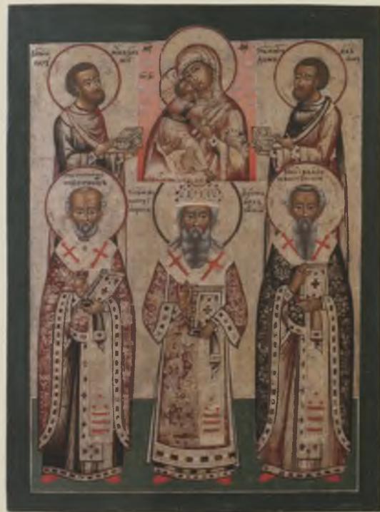
Икона «Святые Козьма, Дамиан, Николай Чудотворец, Модест патриарх Иерусалимский и Василий Севастийский в предстоянии Богоматери Владимирской». XVIII в. ВГИАХМЗ