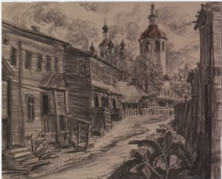
Тотемский дворик. 2002. Собственность автора