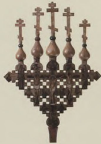
Крест запрестольный, выносной «Распятие. Деисус и избранные святые». Вторая половина XVII в. Лицевая сторона. ВГИАХМЗ