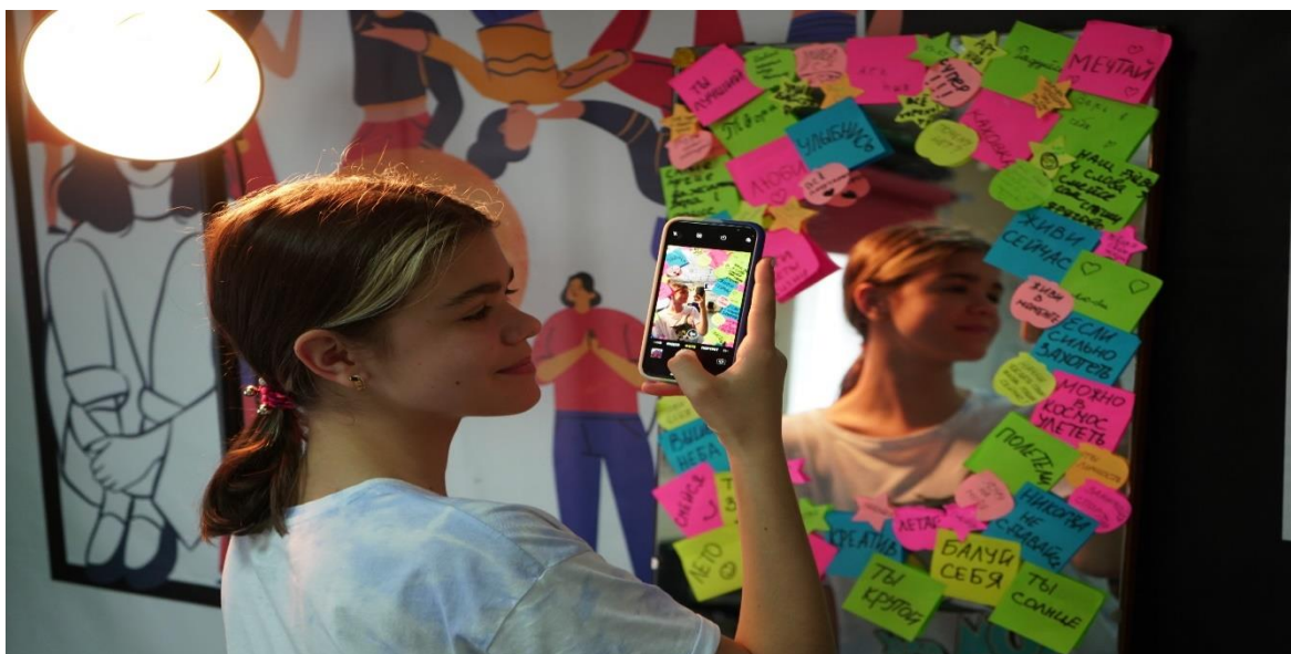
Рис. 16. На фото: Учасниця «SUMMER CAMP» в просторі «Арт-хаб» в м. Каховка на уроці з фото направлення