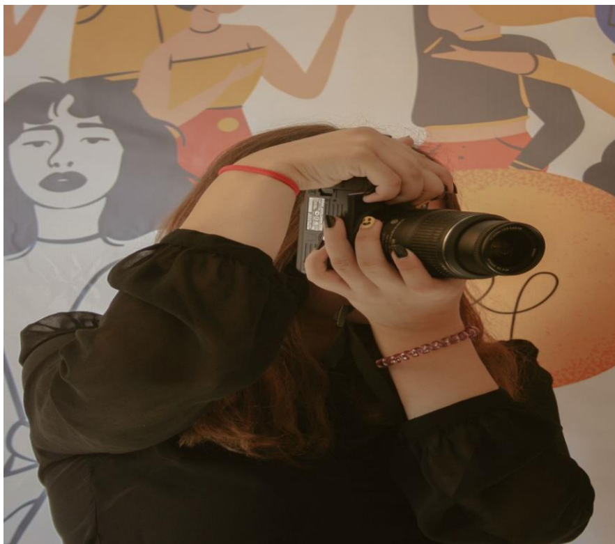
Рис. 12. На фото: Учениця в процесі заняття фото-гуртка «Квадратік» в просторі «Арт-хаб» в м. Каховка