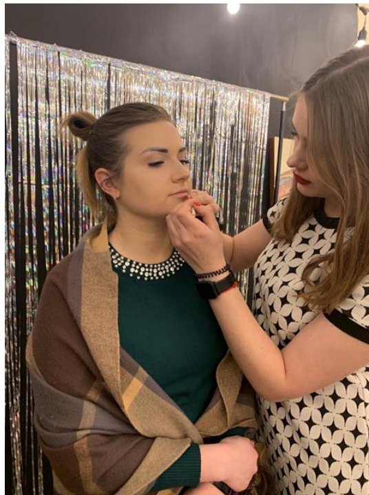
Рис. 25. На фото: Процес майстер-класу з візажу в просторі «Арт-хаб» в м. Каховка