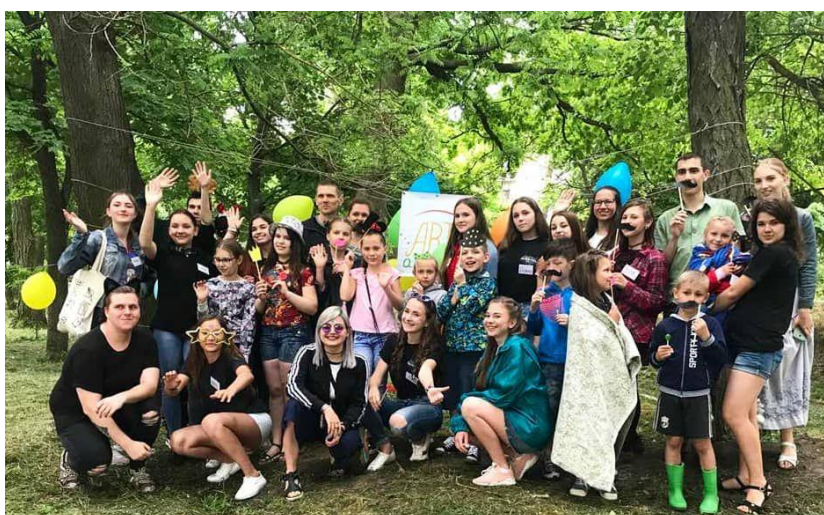
Рис. 4. На фото: Ініціативна група «Артерія»