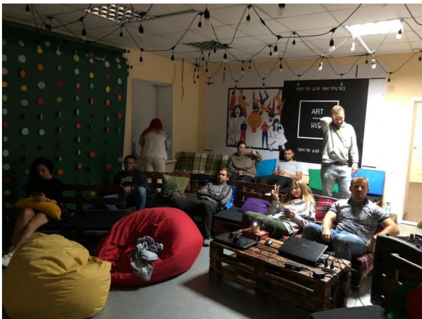
Рис. 26. На фото: Вечірній кінотеатр в просторі «Арт-хаб» в м. Каховка