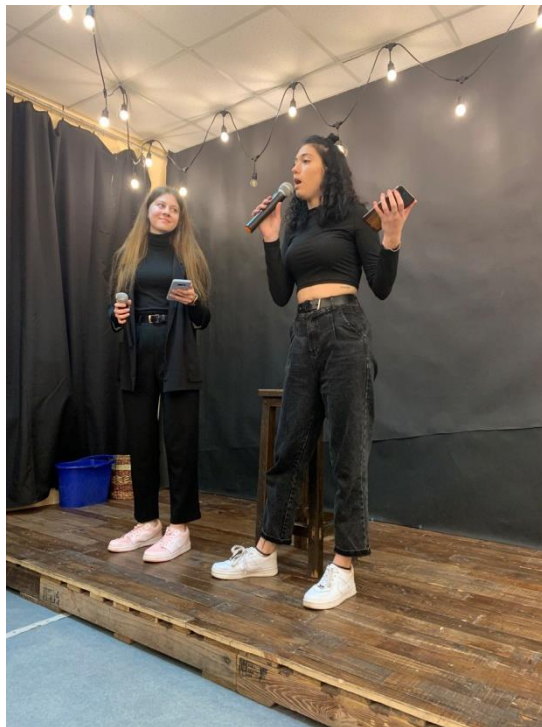
Рис. 29. На фото: Учасниці стендап-шоу, організований разом з місцевою командою КВК в просторі «Арт-хаб» в м. Каховка