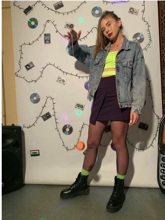
Рис. 28. На фото: Фотозона на тематичній вечірці в стилі 90-х років в просторі «Арт-хаб» в м. Каховка