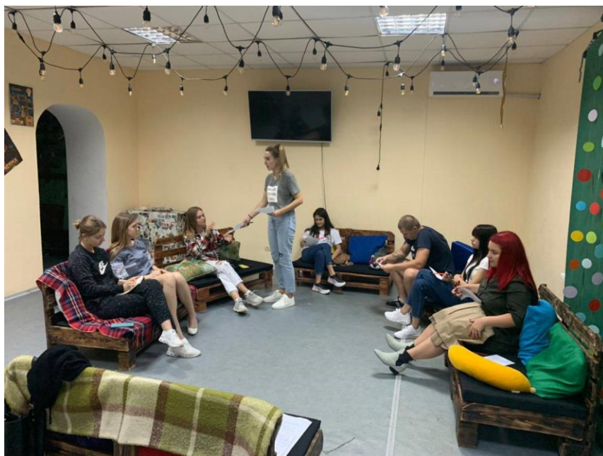
Рис. 23. На фото: Учасники тренінгів з психології за віковою категорією «18+» » в просторі «Арт-хаб» в м. Каховка