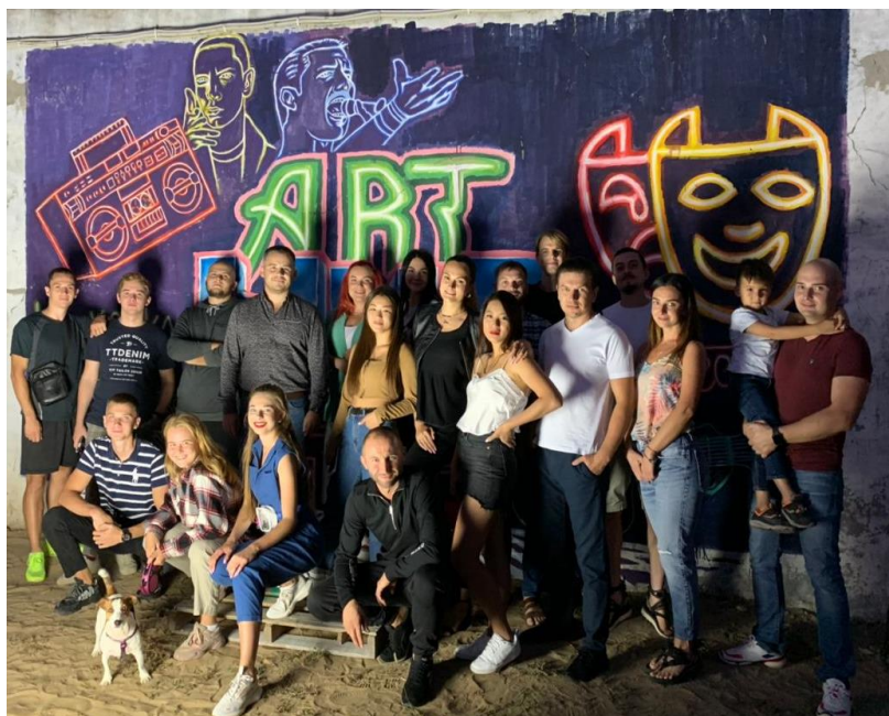
Рис. 1. На фото:

Відкриття простору «Арт-хаб» в місті Каховка Херсонської області