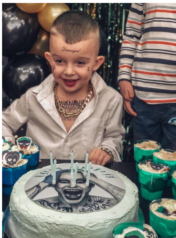
Рис. 11. На фото: Тематична вечірка на День Народження в стилі «Джокер» в просторі «Арт-хаб» в м. Каховка