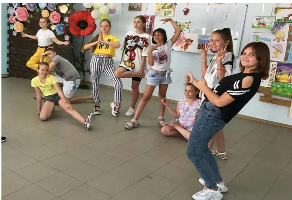
Рис. 7. На фото: Літній театральний короткостроковий проєкт для дітей на базі простору «Арт-студія VDali»