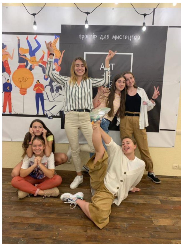
Рис. 22. На фото: Учасники тренінгів з психології за віковою категорією «підлітки» » в просторі «Арт-хаб» в м. Каховка