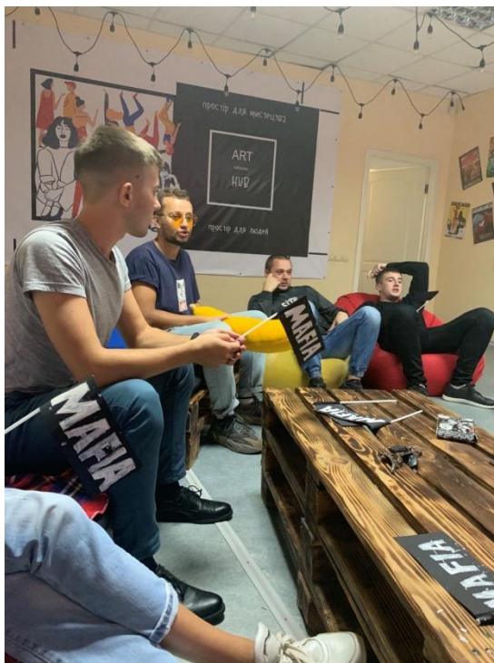
Рис. 30. На фото: Учасники ігри «Мафія» в просторі «Арт-хаб» в м. Каховка