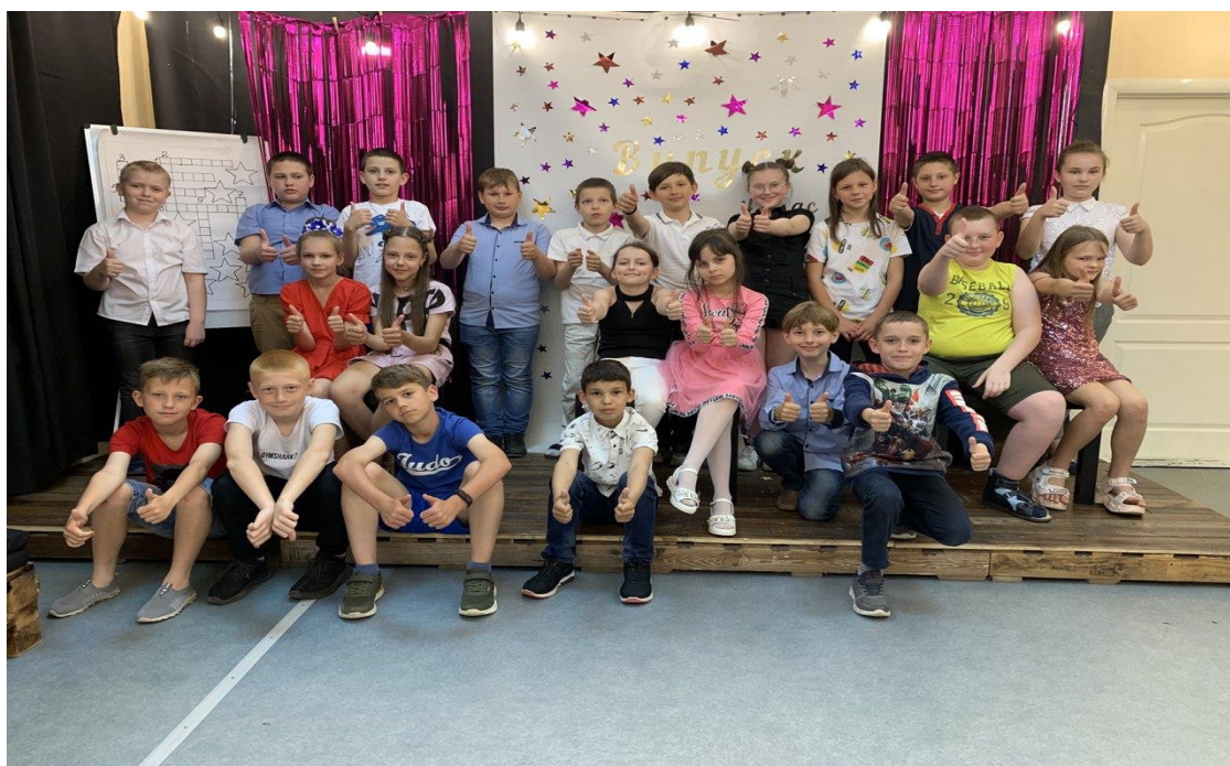
Рис. 9. На фото: Випускний для дітей 4-го класу в просторі «Арт-хаб» в м. Каховка