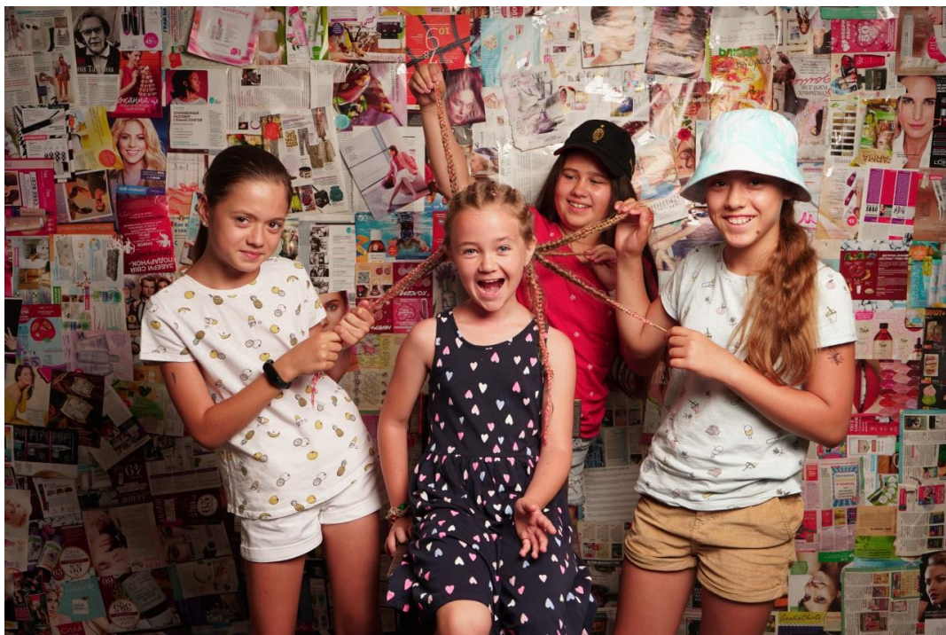
Рис. 19. На фото: Учасники «SUMMER CAMP» в просторі «Арт-хаб» в м. Каховка на сувмісно зробленому фоні із журналів