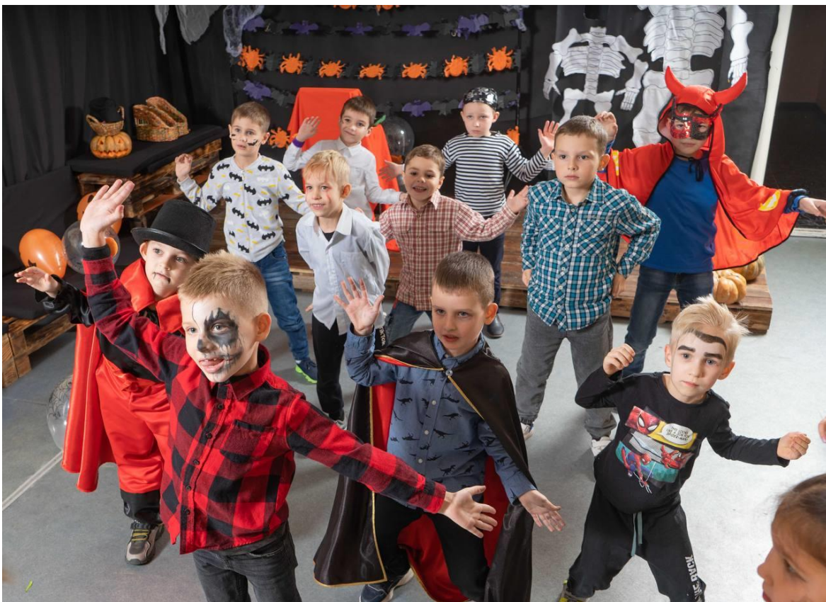
Рис. 8. На фото: «Halloween party» для школярів в просторі «Арт-хаб» в м. Каховка