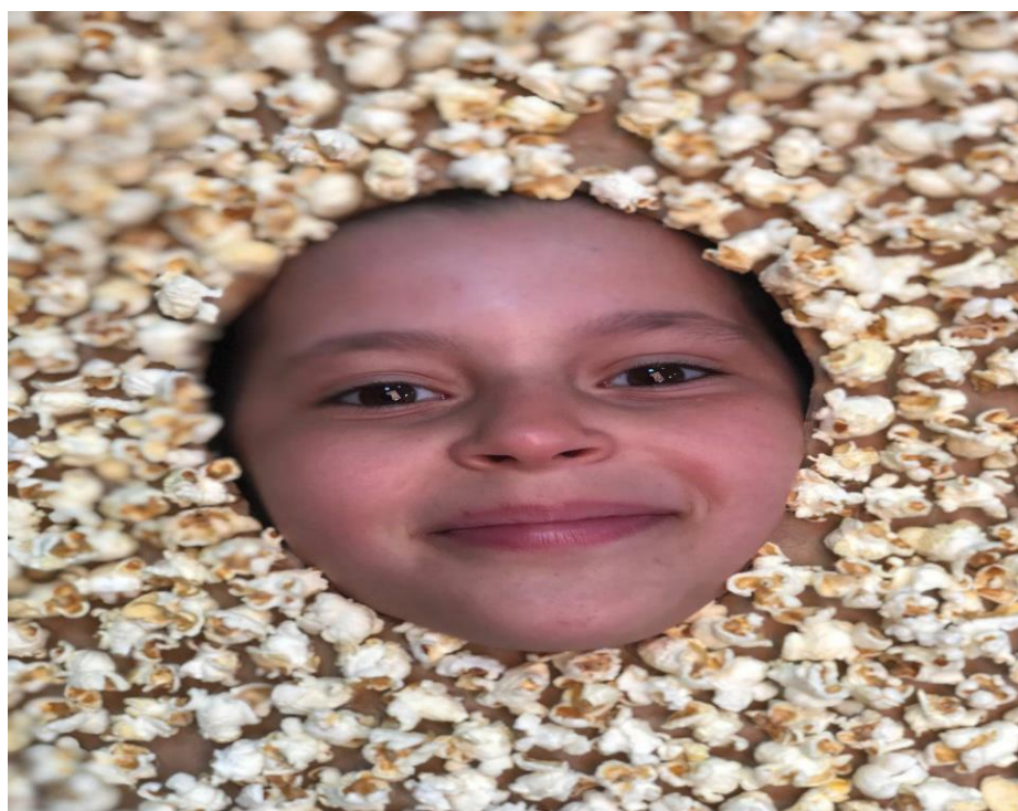
Рис. 17. На фото: Учасниця «SUMMER CAMP» в просторі «Арт-хаб» в м. Каховка на уроці з фото направлення в рамці з поп-корну, зробленою на уроці хенд- мейду