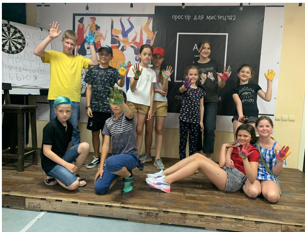
Рис. 14. На фото: Учасники «SUMMER CAMP» в просторі «Арт-хаб» в м. Каховка