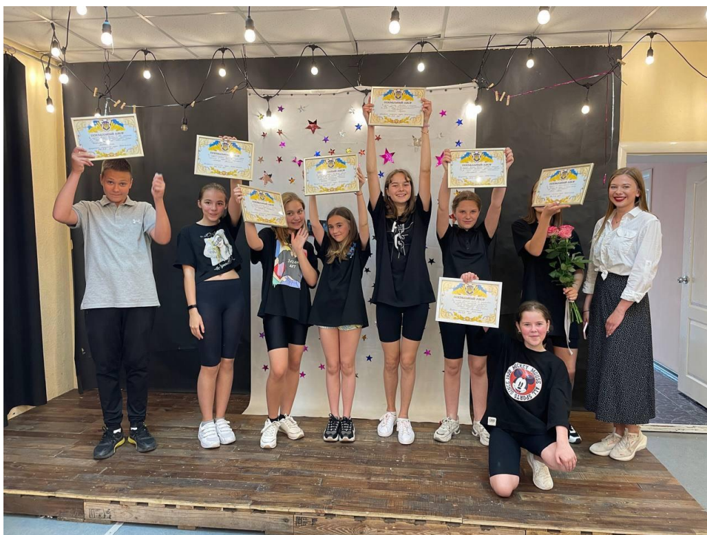
Рис. 31. На фото: Контрольний урок театральної студії в просторі «Арт-хаб» в м. Каховка