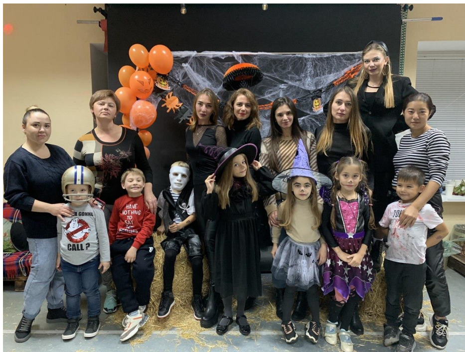
Рис. 10. На фото: Тематична вечірка в стилі «Halloween» для молодшої групи театральної студії в просторі «Арт-хаб» в м. Каховка