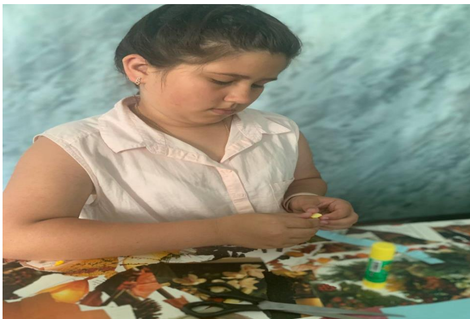
Рис. 15. На фото: Учасниця «SUMMER CAMP» в просторі «Арт-хаб» в м. Каховка на майстер-класі з хенд-мейду