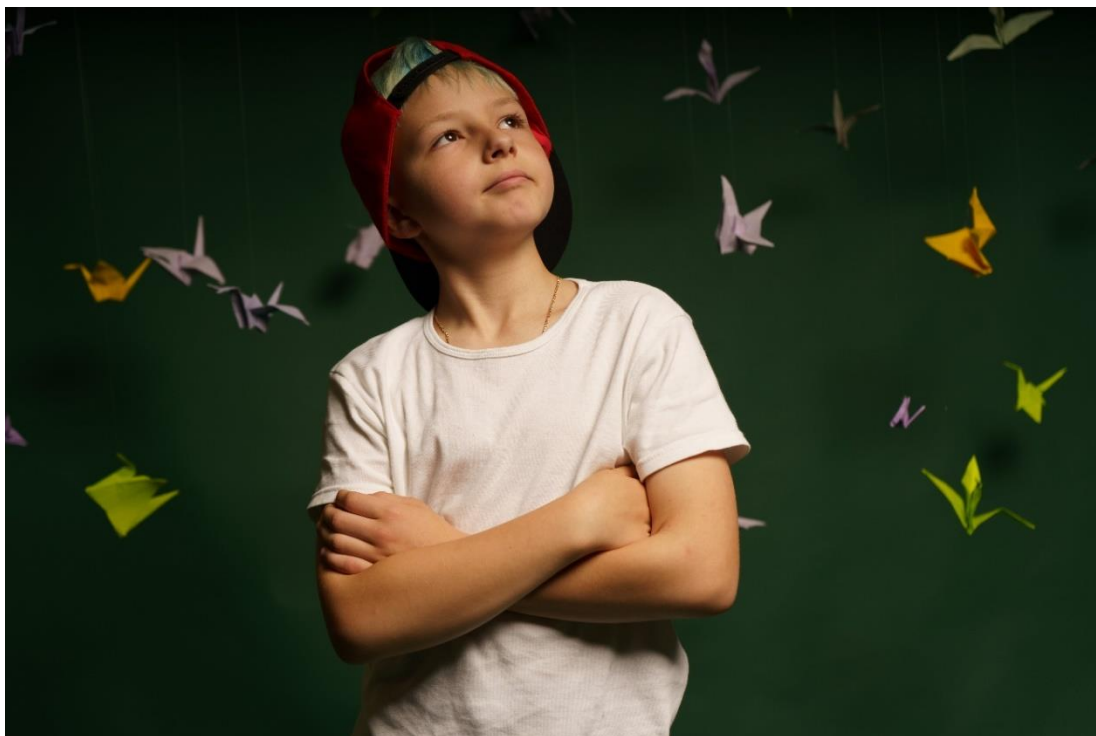
Рис. 20. На фото: Учасник «SUMMER CAMP» в просторі «Арт-хаб» в м. Каховка на сувмісно зробленому фоні із журавлів за технікою орігамі