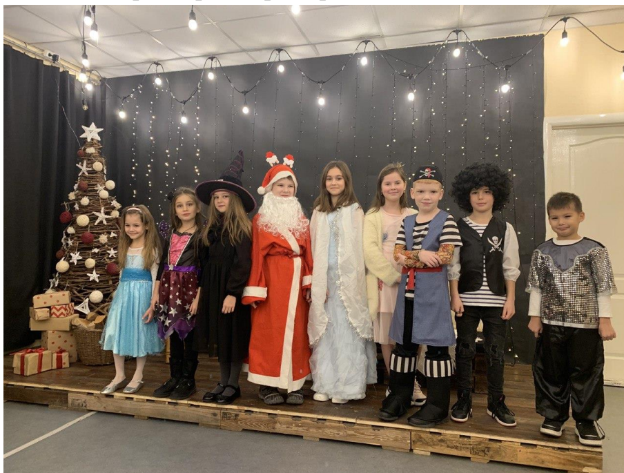
Рис. 33. На фото: Новорічна вистава від старшої та молодшої групи театральної студії в просторі «Арт-хаб» в м. Каховка