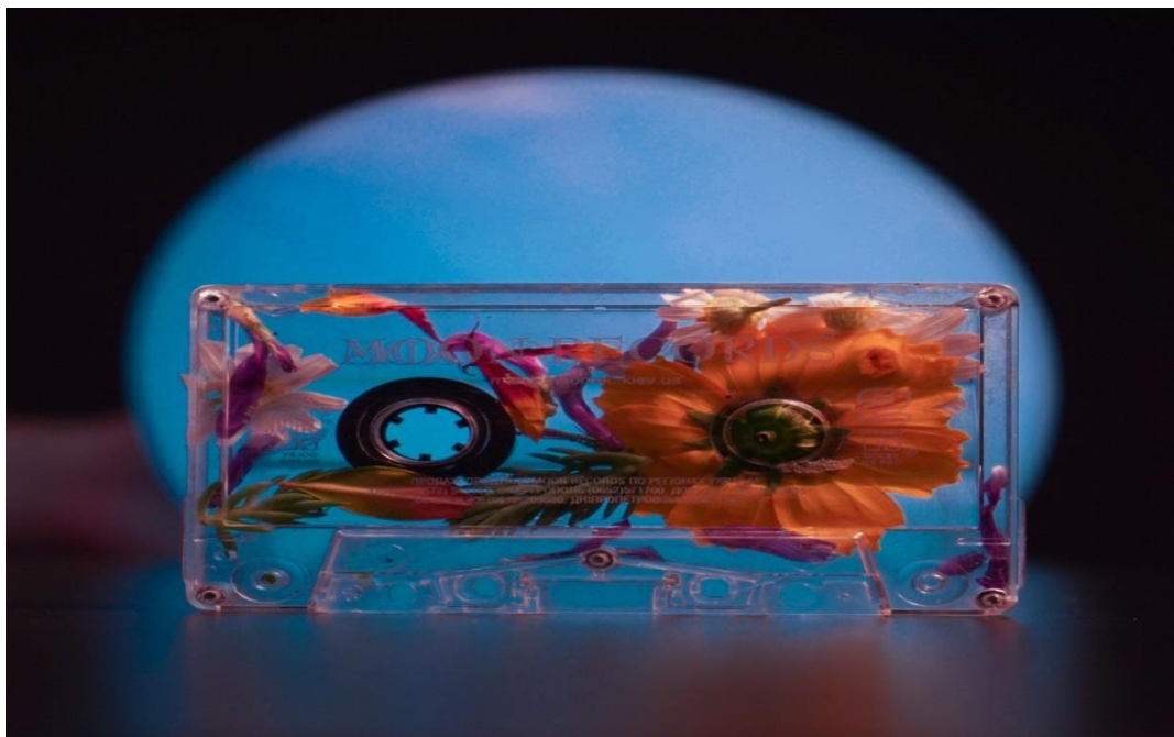
Рис. 18. На фото: Касета оформлена квітами, зроблена на майстер-класі з хенд-мейду в «SUMMER CAMP» в просторі «Арт-хаб» в м. Каховка