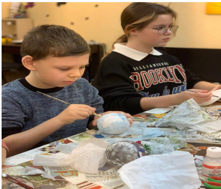
Рис. 13. На фото: Урок хенд-мейду в просторі «Арт-хаб» в м. Каховка