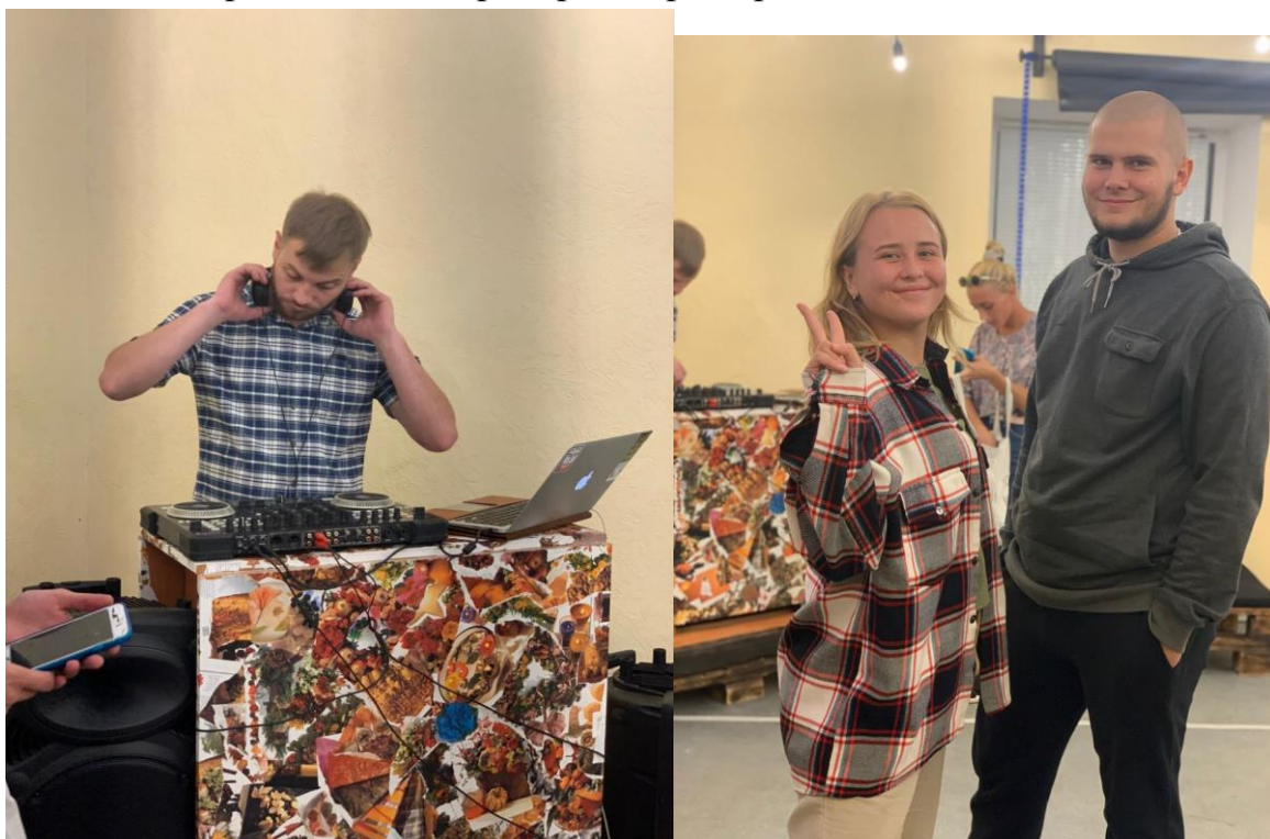
Рис. 27. На фото: Учасники заходу «Квартирник» в просторі «Арт-хаб» в м. Каховка