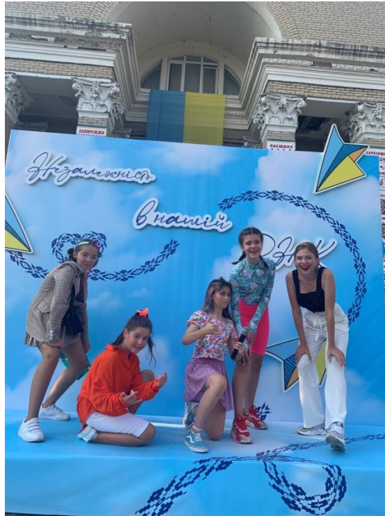
Рис. 34. На фото: Інтерактивна вистава до Дня Незалежності України від театральної студії «арт-хабу» в м. Каховка