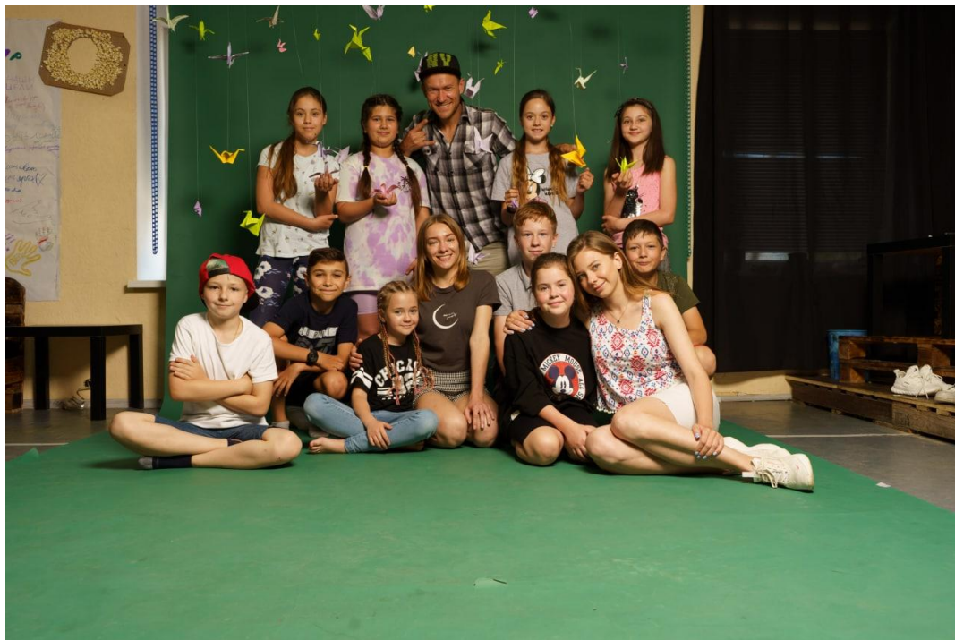
Рис. 21. На фото: Учасники «SUMMER CAMP» в просторі «Арт-хаб» в м. Каховка на сувмісно зробленому фоні із журавлів за технікою орігамі разом з викладачами