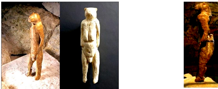
Рис. 1. Реконструкція скульптурки жінки-левиці з печери Штадель (Холенштайн. Німеччина). 38 – 34, 6 тис. р. до н.е.

На наш погляд, найбільш обґрунтованою є точка зору, згідно з якою териантропи є відбитком універсальних релігійних ідей про походження роду від якоїсь природної істоти. З переходом від первісного стада до родоплеменної общини і зміцненням родинних зв'язків зростало прагнення одноплемінників зрозуміти таємницю походження свого роду. Оскільки палеолітична людина, хоч й виокремлювала себе серед тварин, але жила у найтіснішому контакті зі світом природи, своїми предками вона вважала природні істоти, з якими пов'язувались її уявлення про могутність, верховенство, ієрархію. Виникнення тотемних уявлень первісних людей про походження роду від якоїсь природної істоти обумовили зародження у художньо-релігійній практиці образу териантропа. Характерним прикладом є скульптурка жінки-левиці (висота 29,6 см), яка датується 34,6 тисяч років до н. е., або 38 тисяч р. до н. е. з масиву Холенштайн (Hohlenstein), розташованого на плато Швабський Альб (рис.1).