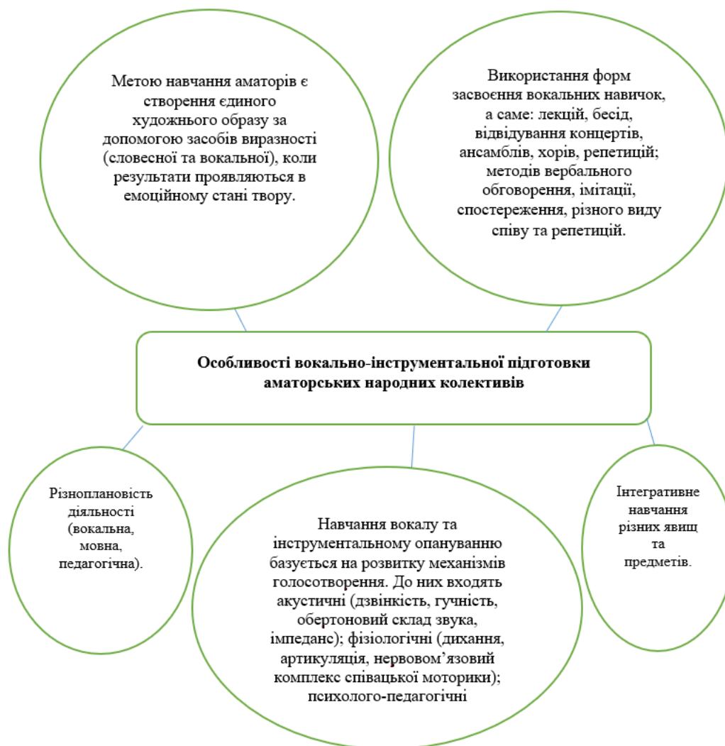
Рис. 1. Характерні риси вокальної підготовки народних колективів

виділити компетентність музикантів та їх обізнаність у сценічній культурі. Виникає чітка необхідність переосмислення усталених поглядів на культивування вокалістів під час навчального процесу, інтеграції нових технологій та підходів, переоцінки принципів, які спрямовані на перетворення аматорів на фахівців.