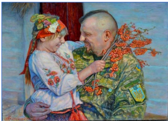
Іл. 11. Юрій Камішиний. Полотно, олія, 2022