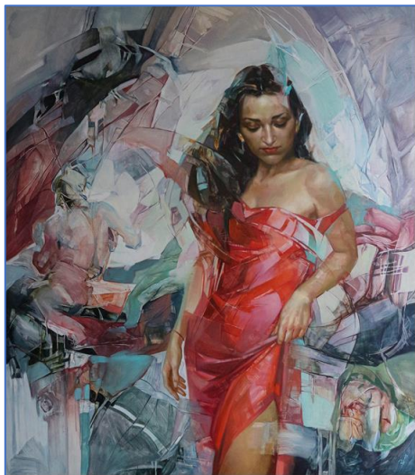
Іл. 3. Іван Цап'як, «Жінка в червоному». Полотно, акрил, олія, 2021

модному фасоні (іл. 3). Жінка ж у 2022 році – це суцільне червоне забарвлення як уособлення великого болю та переживань. У цьому випадку колір несе в собі першооснову – колір крові, що пролилась в українській нації від російської агресії. Зображувана жінка