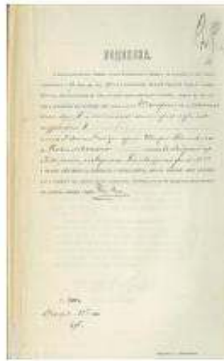
1896 р. Підписки архітектора Краусса