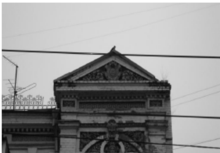
Фрагмент фасаду з поширкою року завершення будівництва