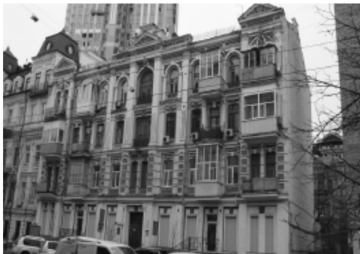
2016 р. Сучасний вигляд будинку