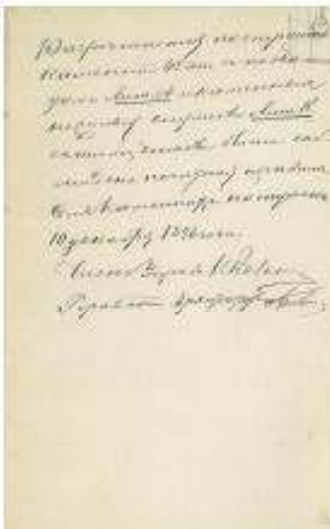
1896 р. Дозвіл міської управи на будівництво

У XXI ст., коли всездозволеність і корумпованість стали нормою, зухвале спаплюження історичного центру Києва призводить до нових втрат. На певний час, коли громадськість почала протестувати проти такого ставлення, процес було призупинено. Але, невдовзі, знову запанувала вигода тих, хто замовляє нову забудову, і тих, хто, нехтуючи нормами та правилами забудови, почав ущільнювати старі квартали центральної частини Києва. А тим часом, місто