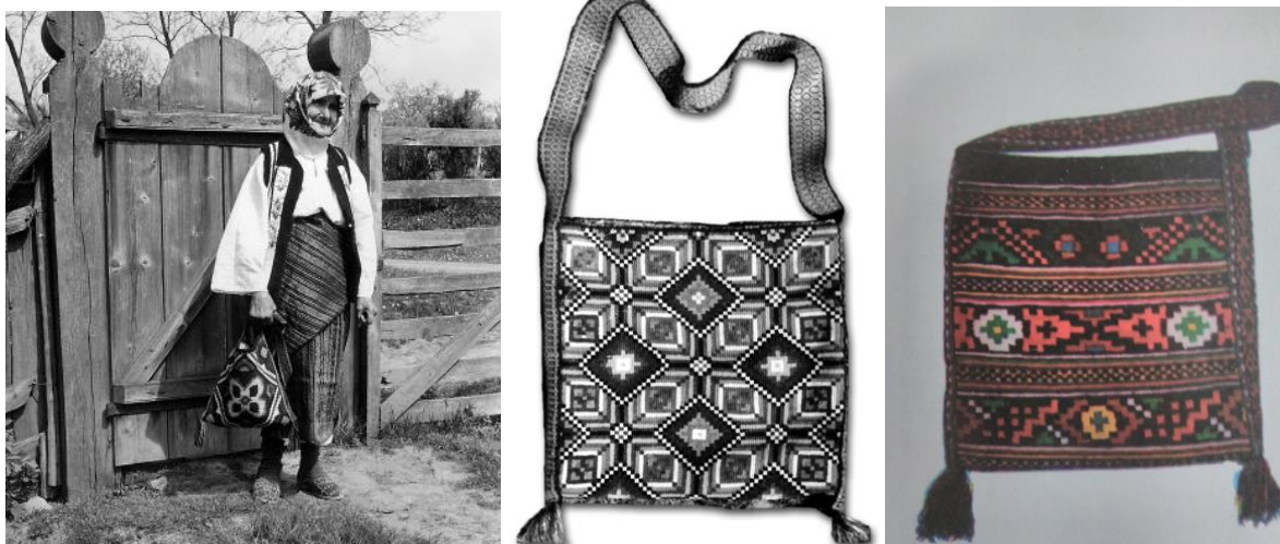
Рис. 1. Жіночий стрій і тканя торба-тайстра (с. Рідківці, Новоселицький район, Чернівецька область, Буковина)

розтягування та сушки полотно ставало більш м'якішим. З такої тканини виробляли національні костюми, які ткали різними візерунками. Доречно підкреслив М. Селівачов, що слово «орнамент» («орламент») стосується, як правило, геометричних візерунків ткацтва, вишивки, різьби. Квіткові зображення, близькі до природи, називають просто «цвіти». Не йменують орнаментом і візерунок, утворений переплетенням ниток основи й поробку: то вже буде «узор» [8]. Орнаментальні мотиви українських вишивок сягають своїм корінням у місцеву флору та фауну, в історичну традицію. У давнину основні орнаментальні мотиви відображали елементи символіки різних стародавніх культів. Художні вишиванки [11, 39]. Яскравою візуалізацією описаного вище є світлина жіночого строю та тканої торби із села Рідківці, що на Буковині (рис. 1).