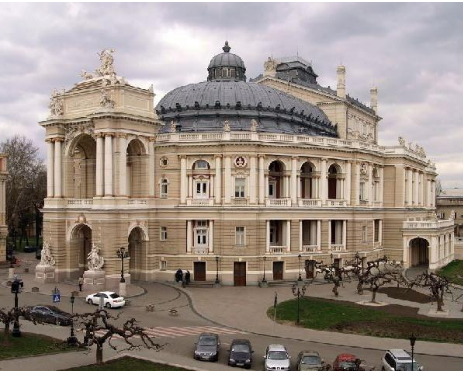
Іл. 25. Одеський національний академічний театр опери та балету. 1887.