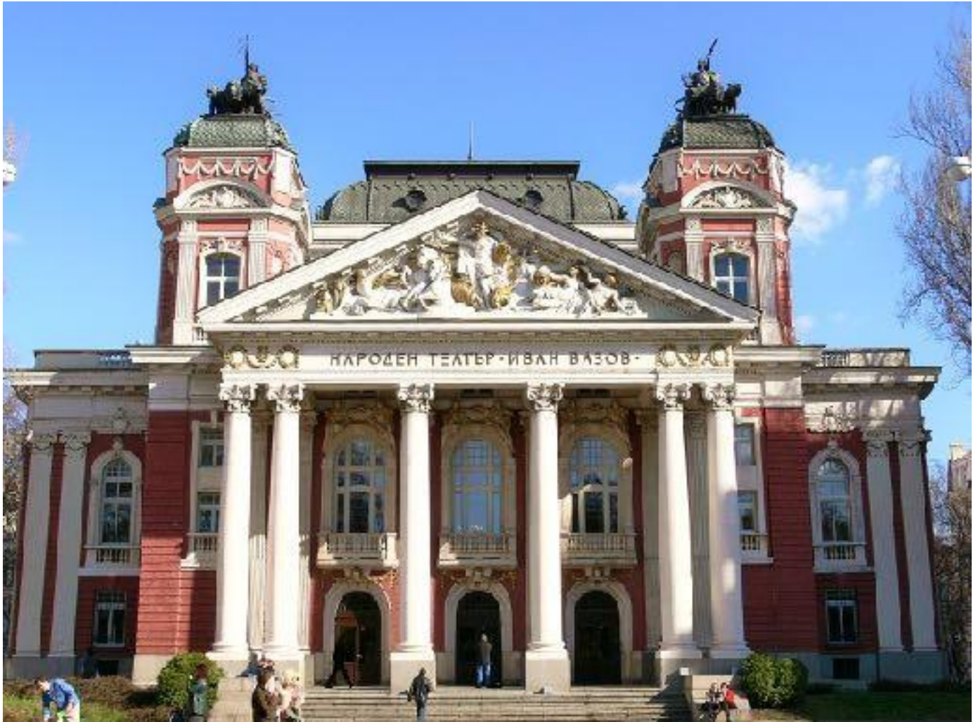
Іл. 8. Національний театр Івана Вазова. 1904.