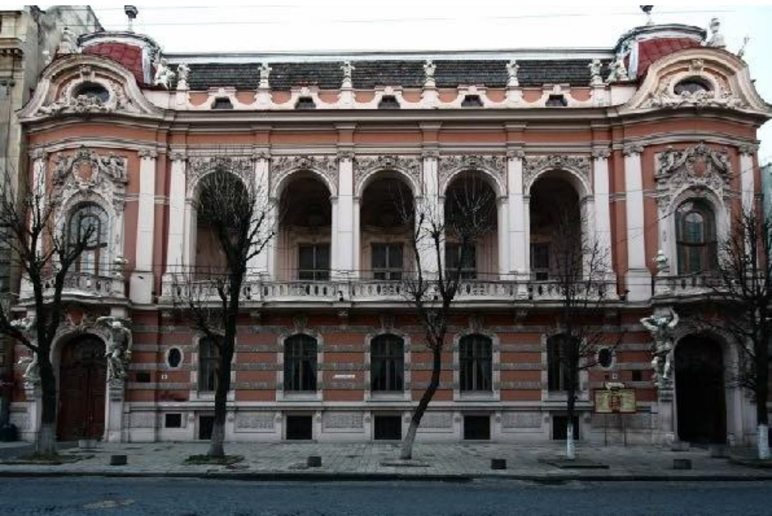
Іл. 27. Австро-Угорський банк у Львові. 1891.