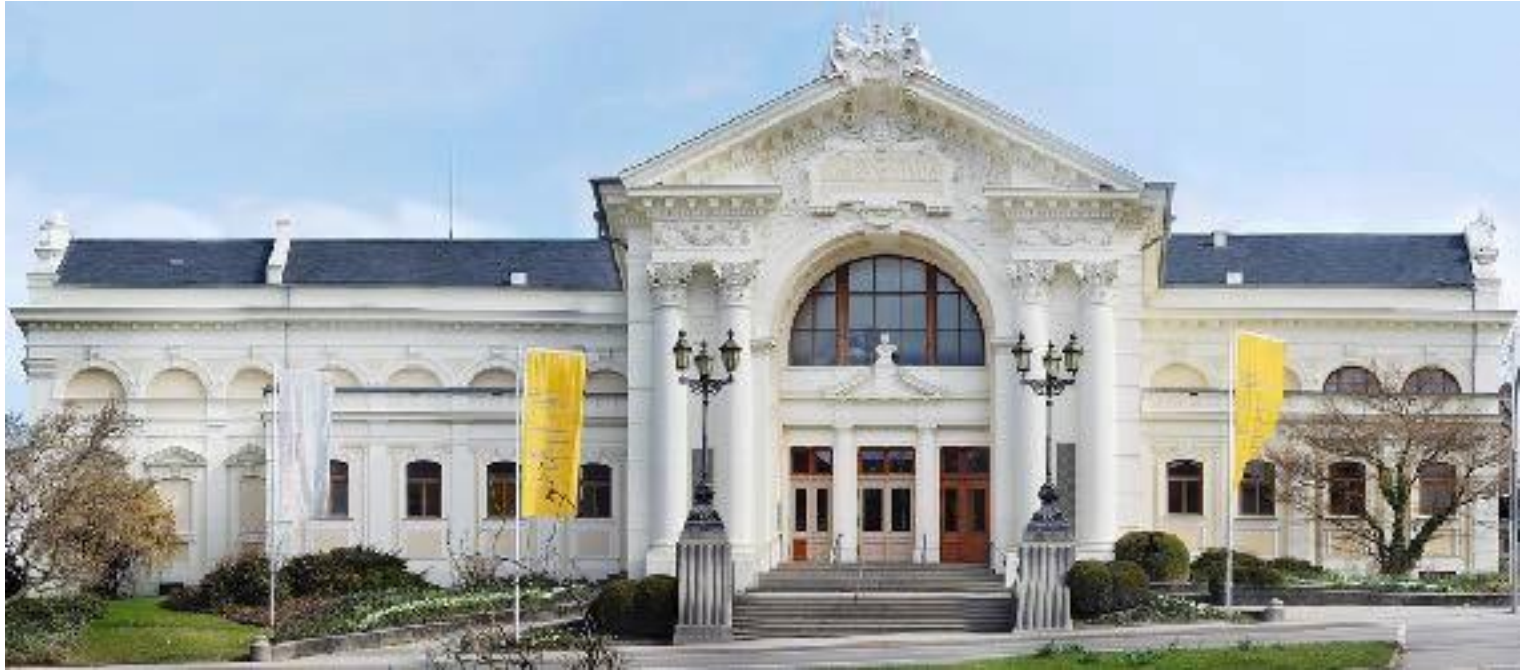
Іл. 12. Концертна залу Равенсбург. 1897.