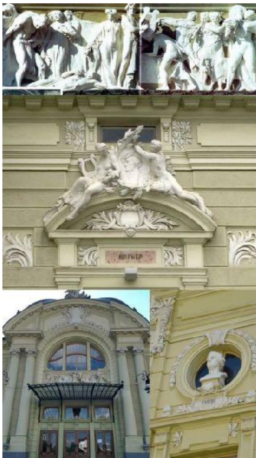
Іл. 29. Оздоблення будівлі Музично-драматичного театру імені О.Кобилянської. Чернівці. 1905.