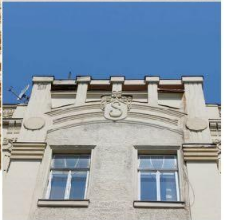
Іл. 22. Дім адвоката Сегаля. 1905.