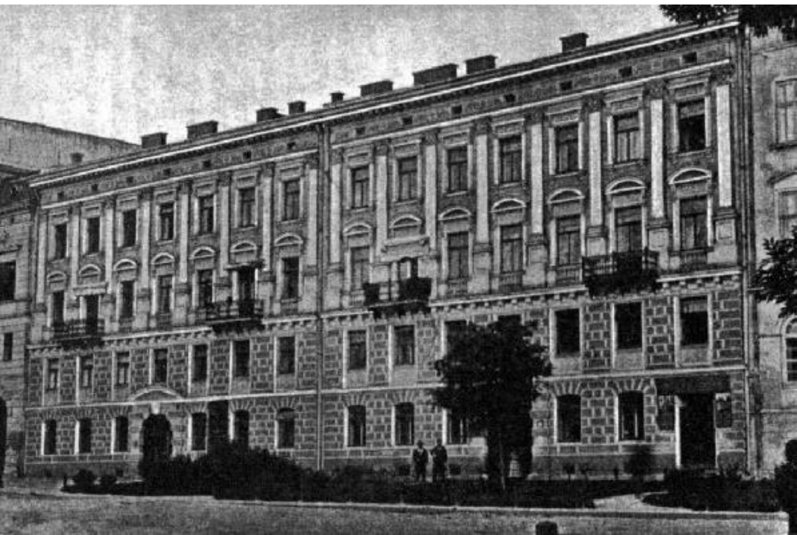
Іл. 23. Наукове товариство імені Шевченка. 1901.