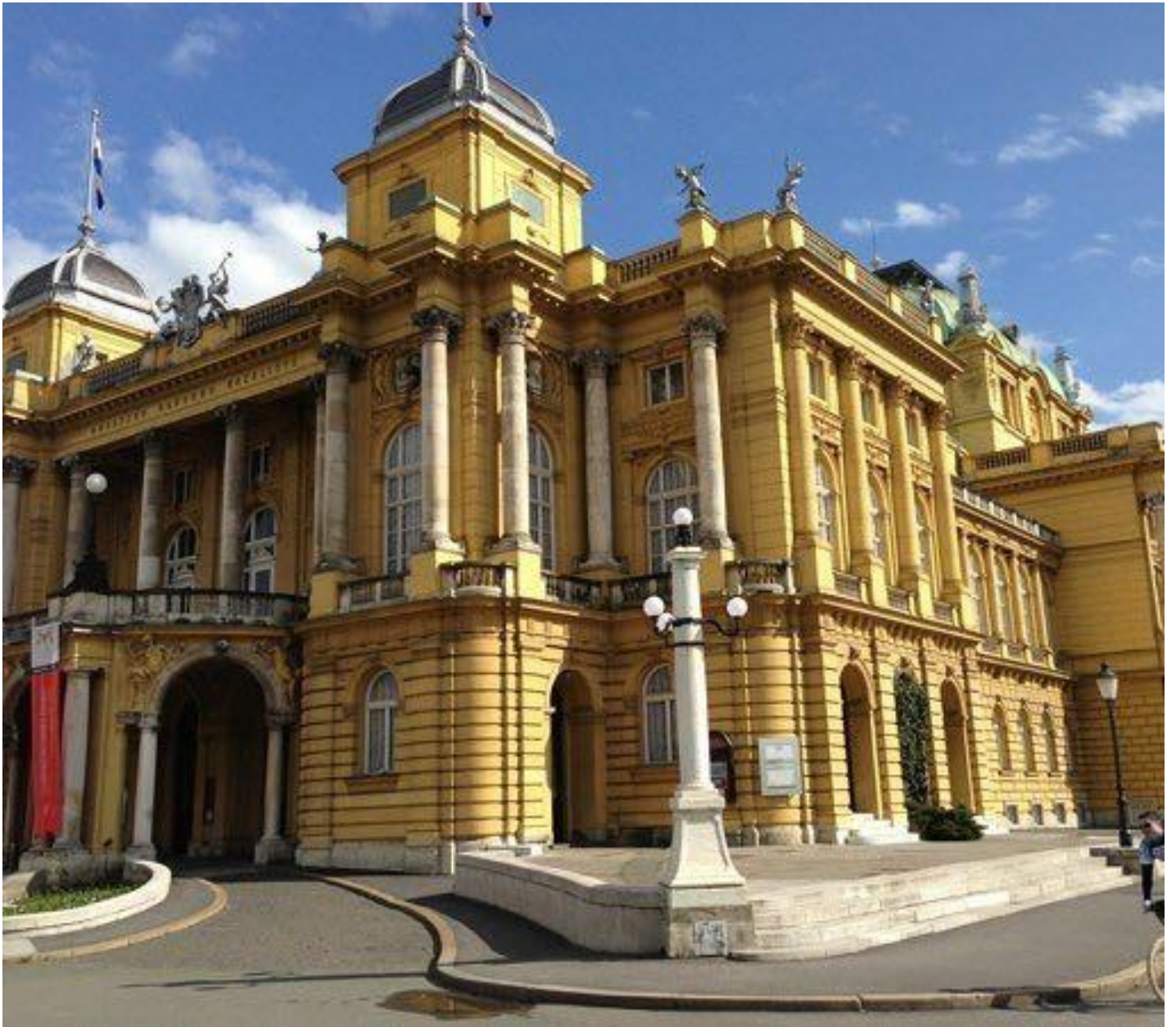
Ил. 5. Хорватський національний театр. 1895.