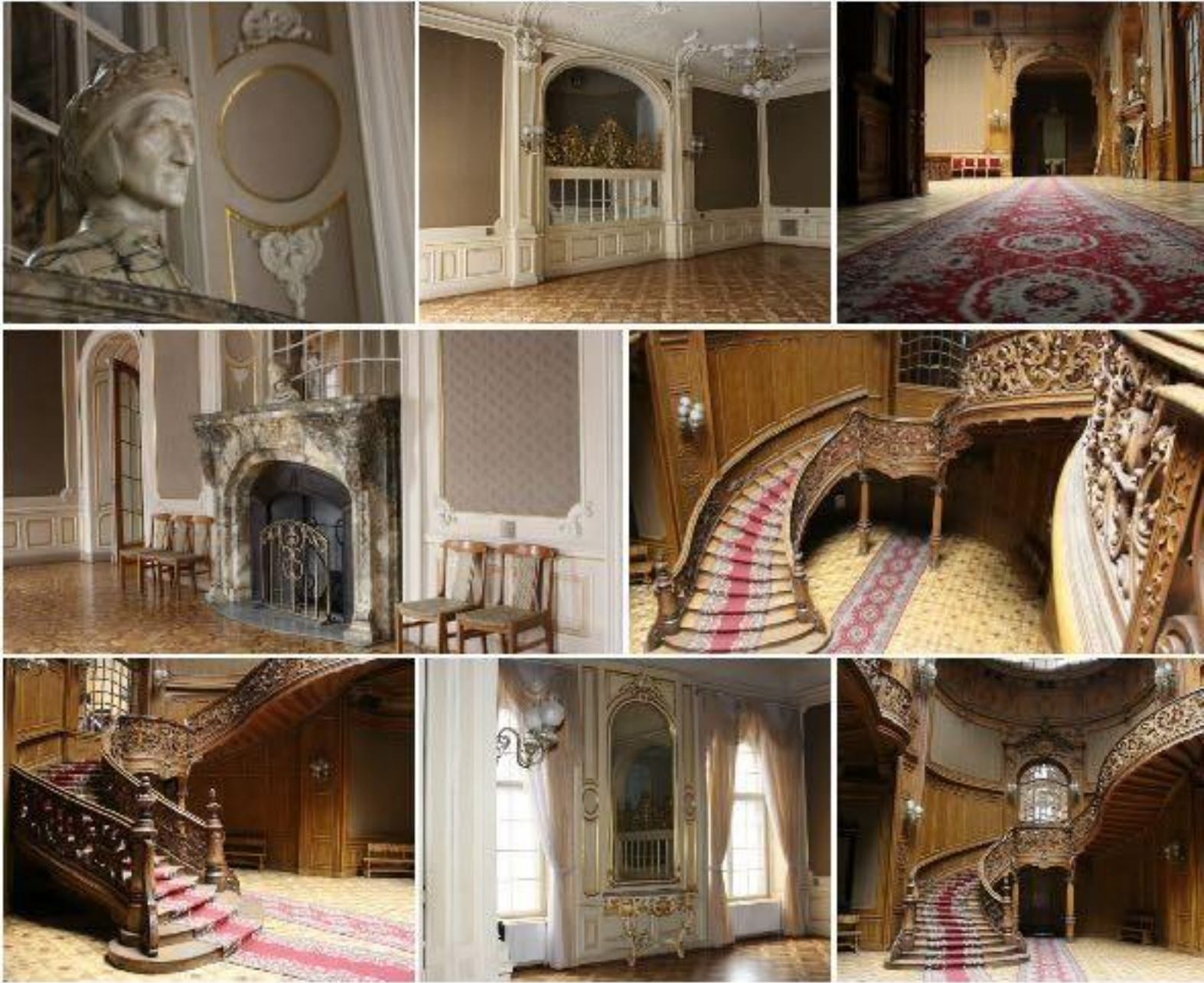
Іл. 30. Будинок Вчених. Інтер'єр. Львів, 1897.