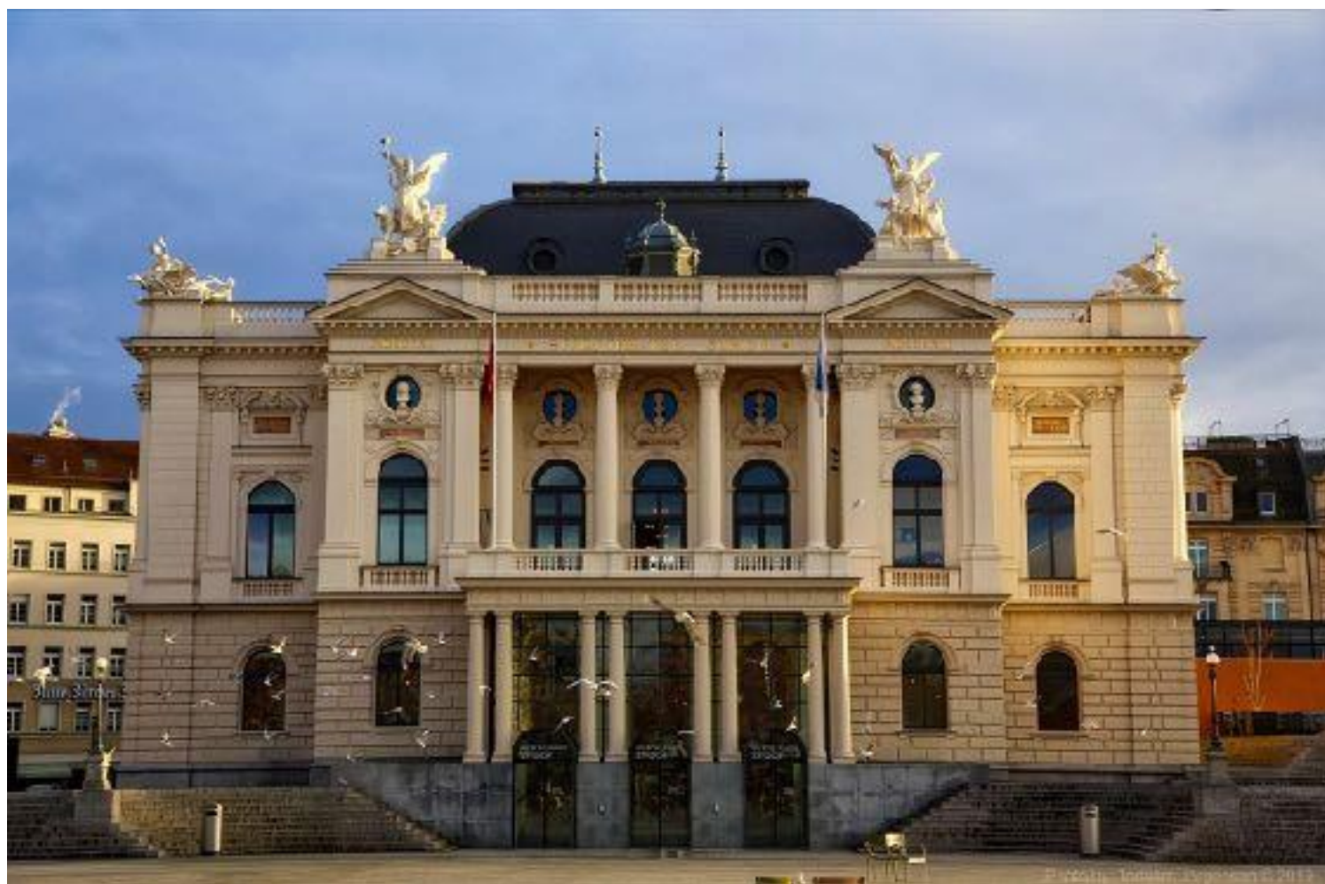
Іл. 13. Цюріхський оперний театр. 1891.