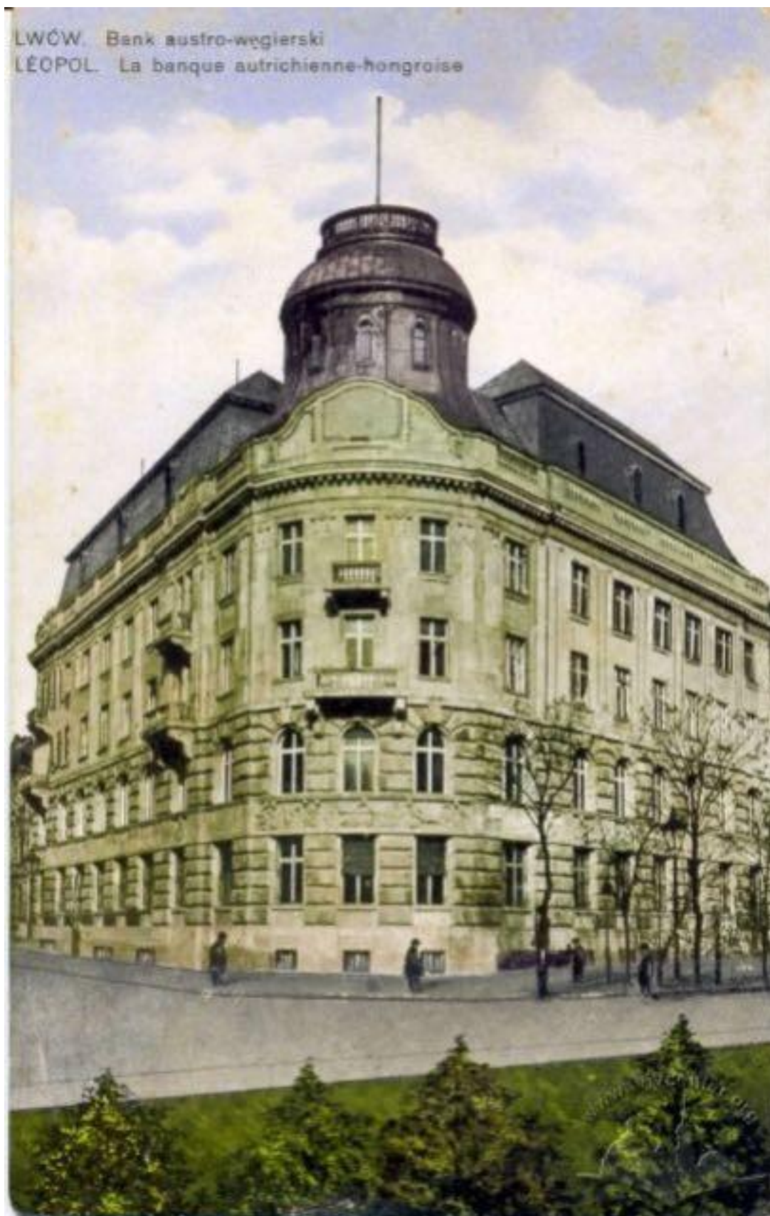
Іл. 26. Казино Герхарда або Будинок вчених. 1897.