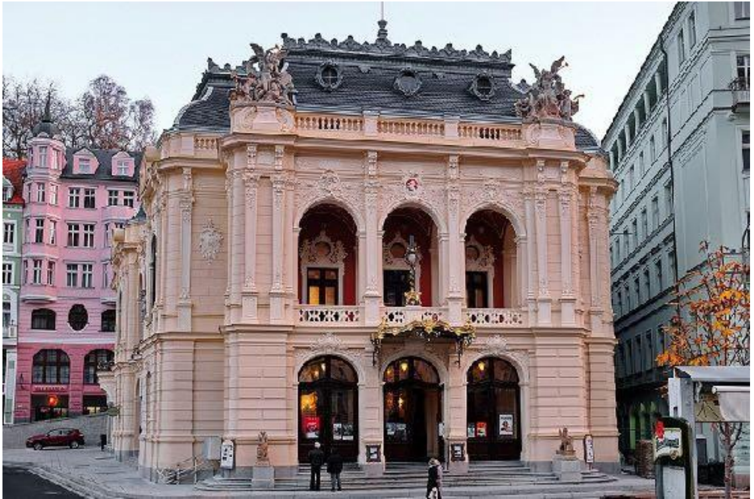
Іл. 7. Карловарський Міський театр. 1884.