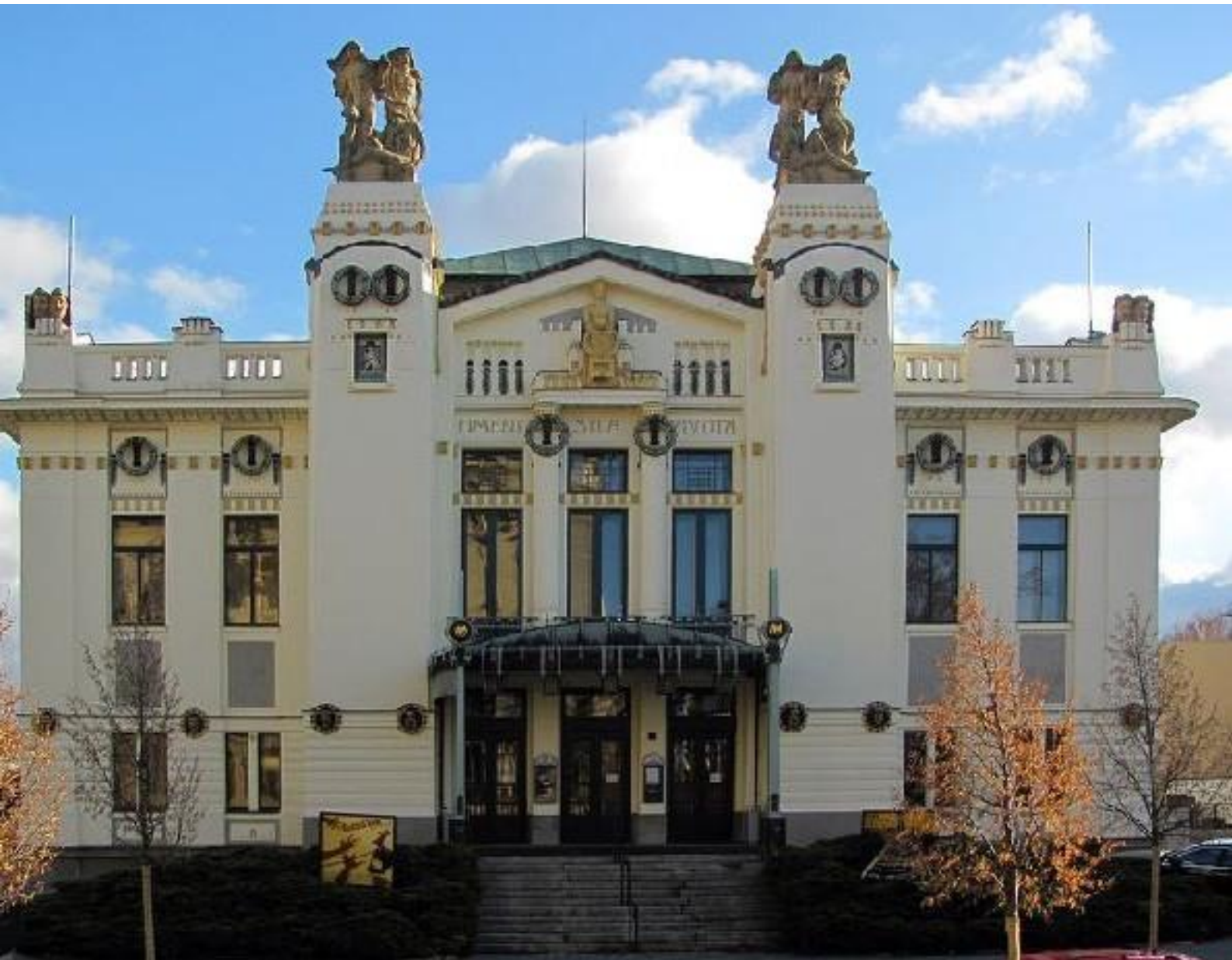
Іл. 17. Млада-Болеславський муніципальний театр. 1909.