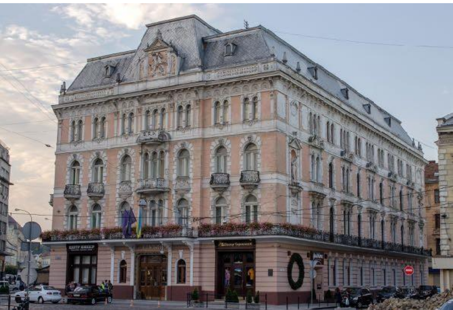
Іл. 21. Готель «Жорж». 1901.