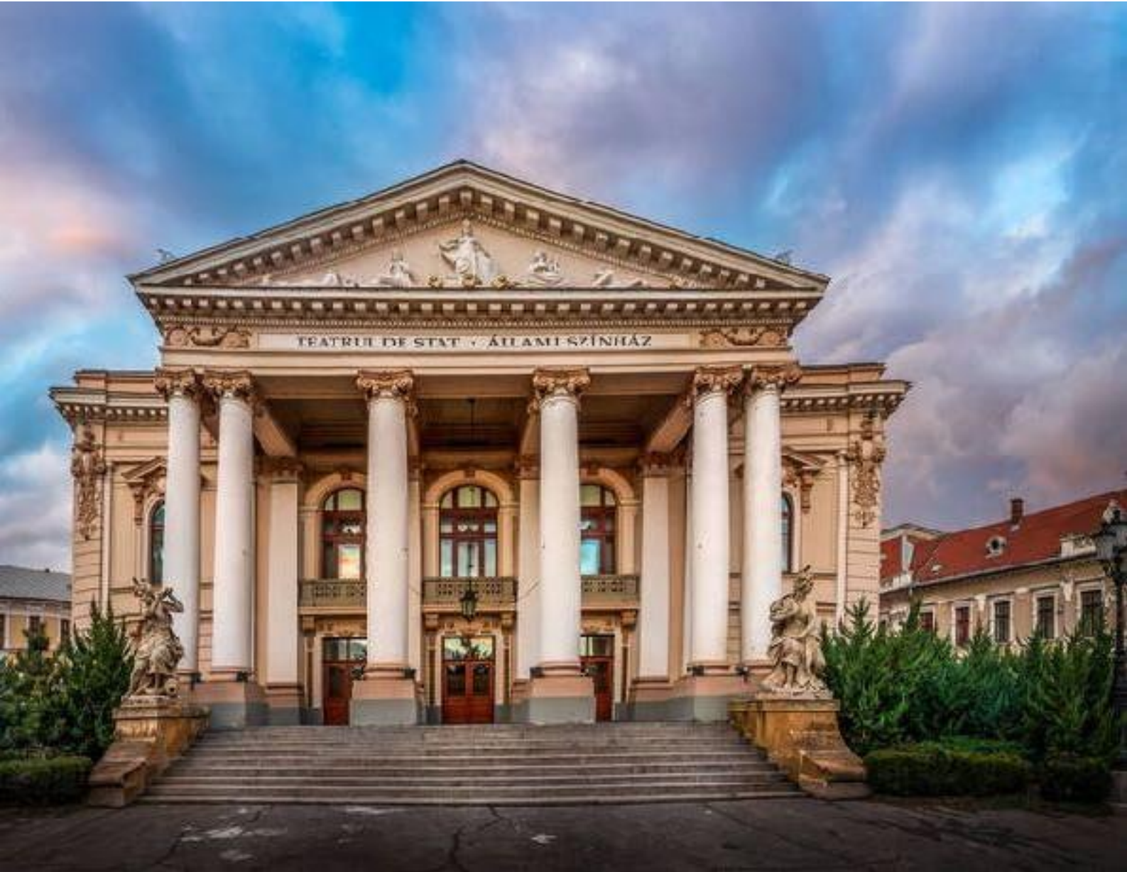
Ил. 20. Державний театр Орадя. 1900.