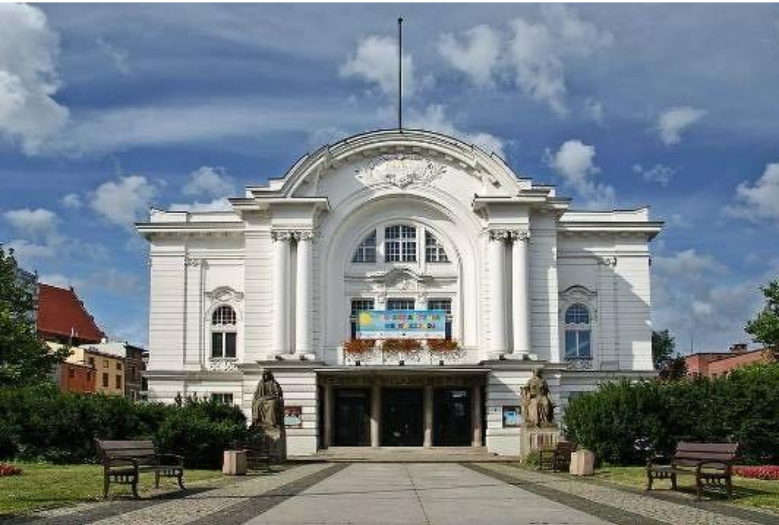
Іл. 16. Театр імені Вільяма Горжиці в Торуні. 1920.