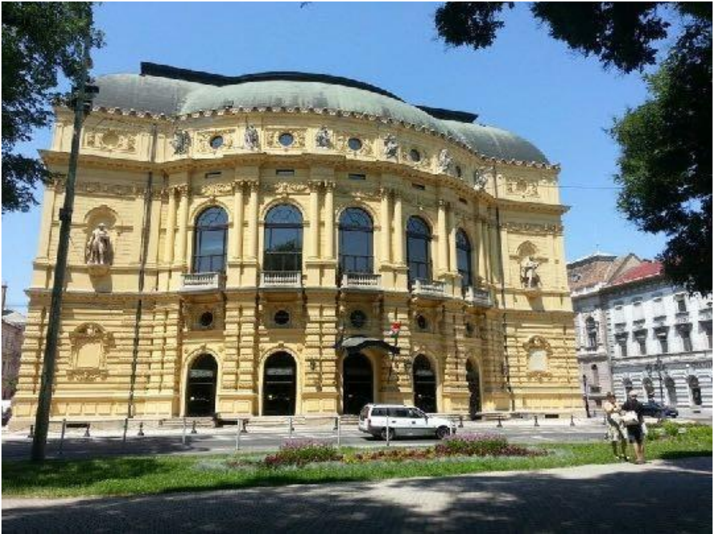
Іл. 9. Національний театр Сегеда. 1883.