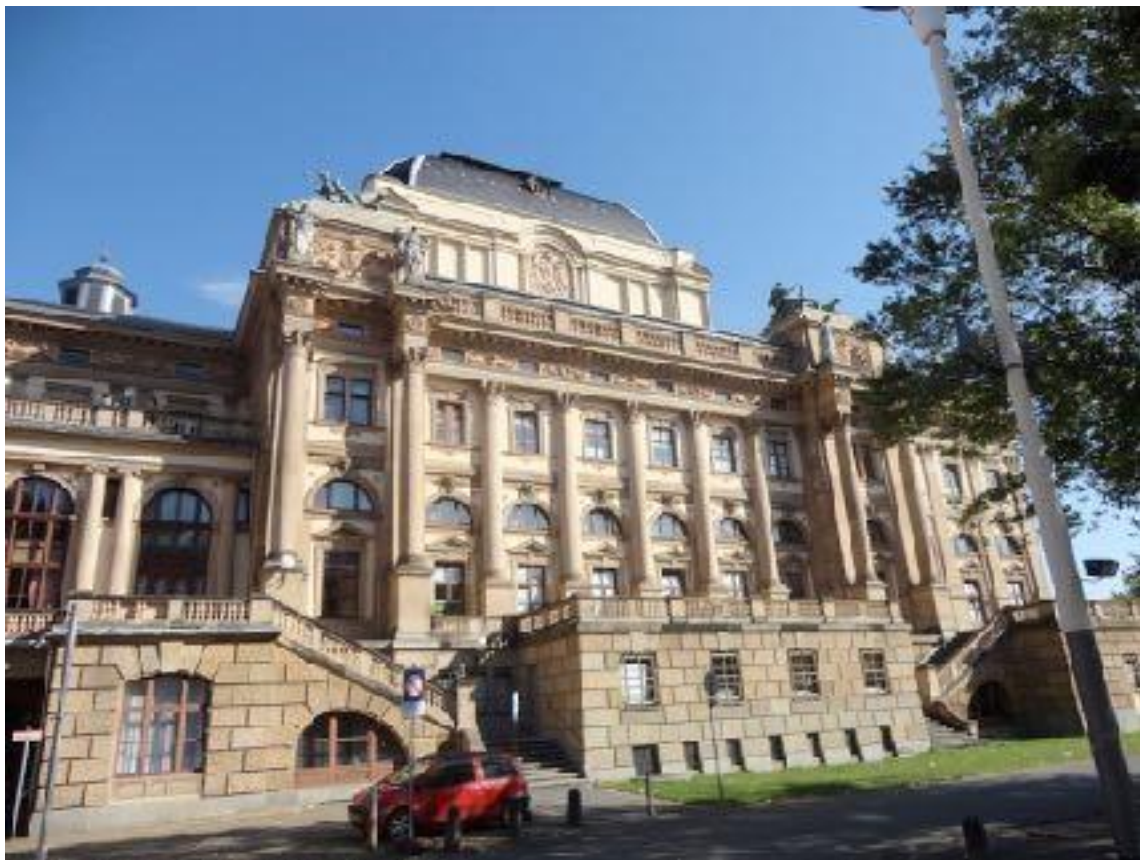
Іл. 3. Міський театр у Гіссені.