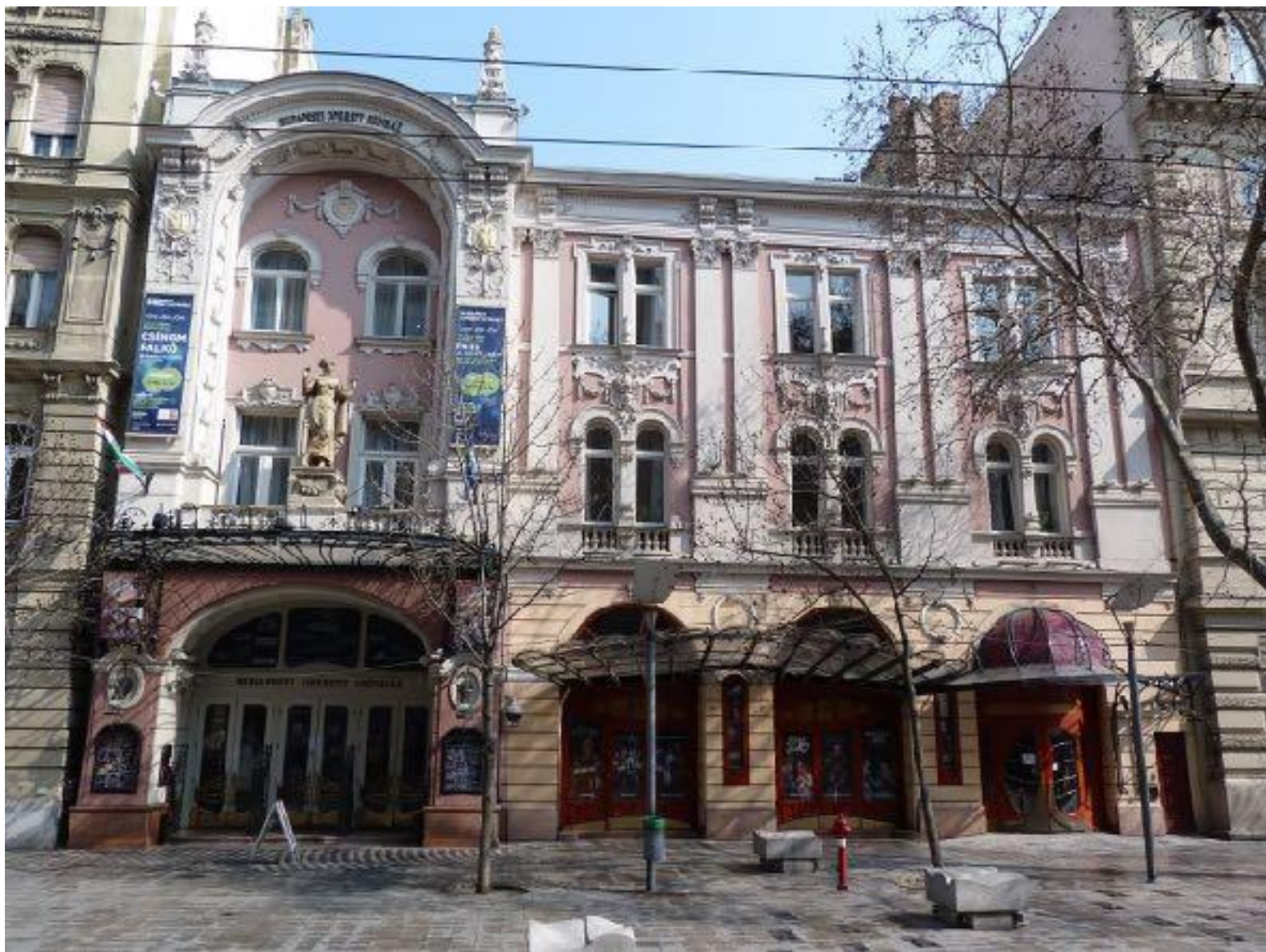
Ил. 19. Будапештський театр оперети. 1923.