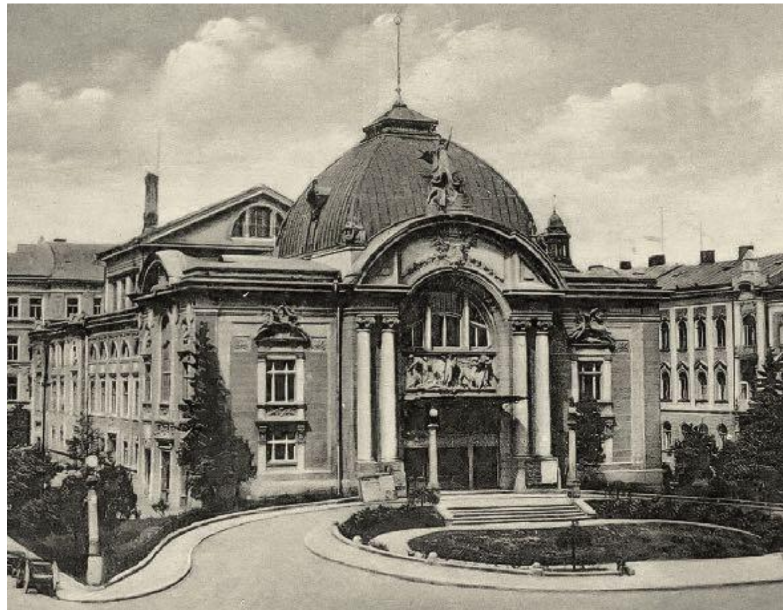
Іл. 24. Музично-драматичний театр імені Ольги Кобилянської. 1905.