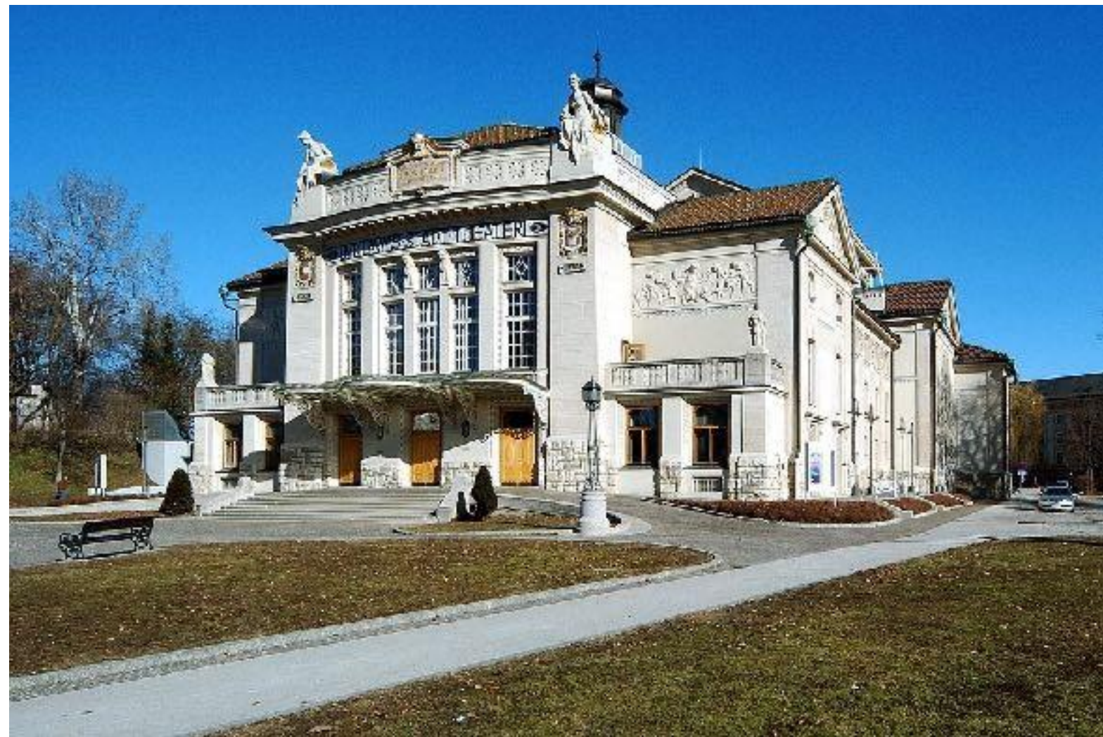
Іл. 11. Міський театр Клагенфурту. 1910.