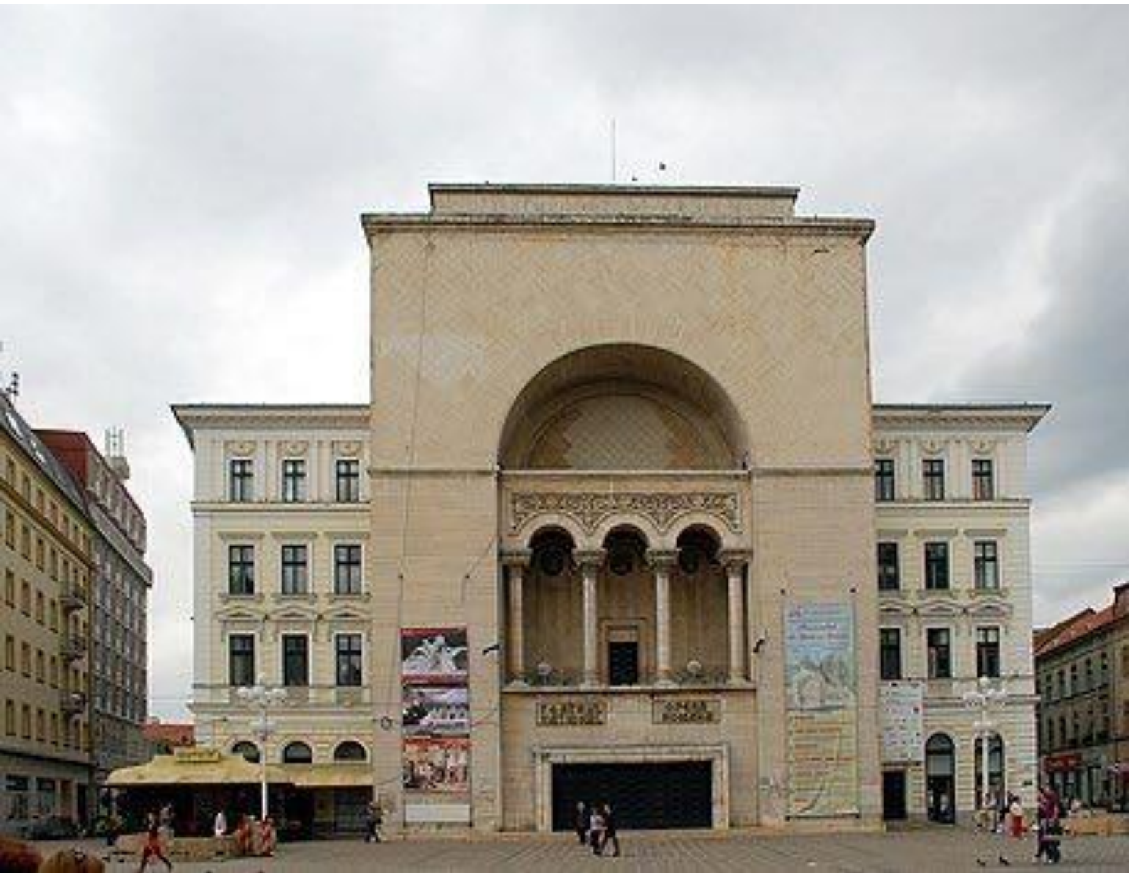
Іл. 14. Румунська Національна опера у Тімішоара. 1953.