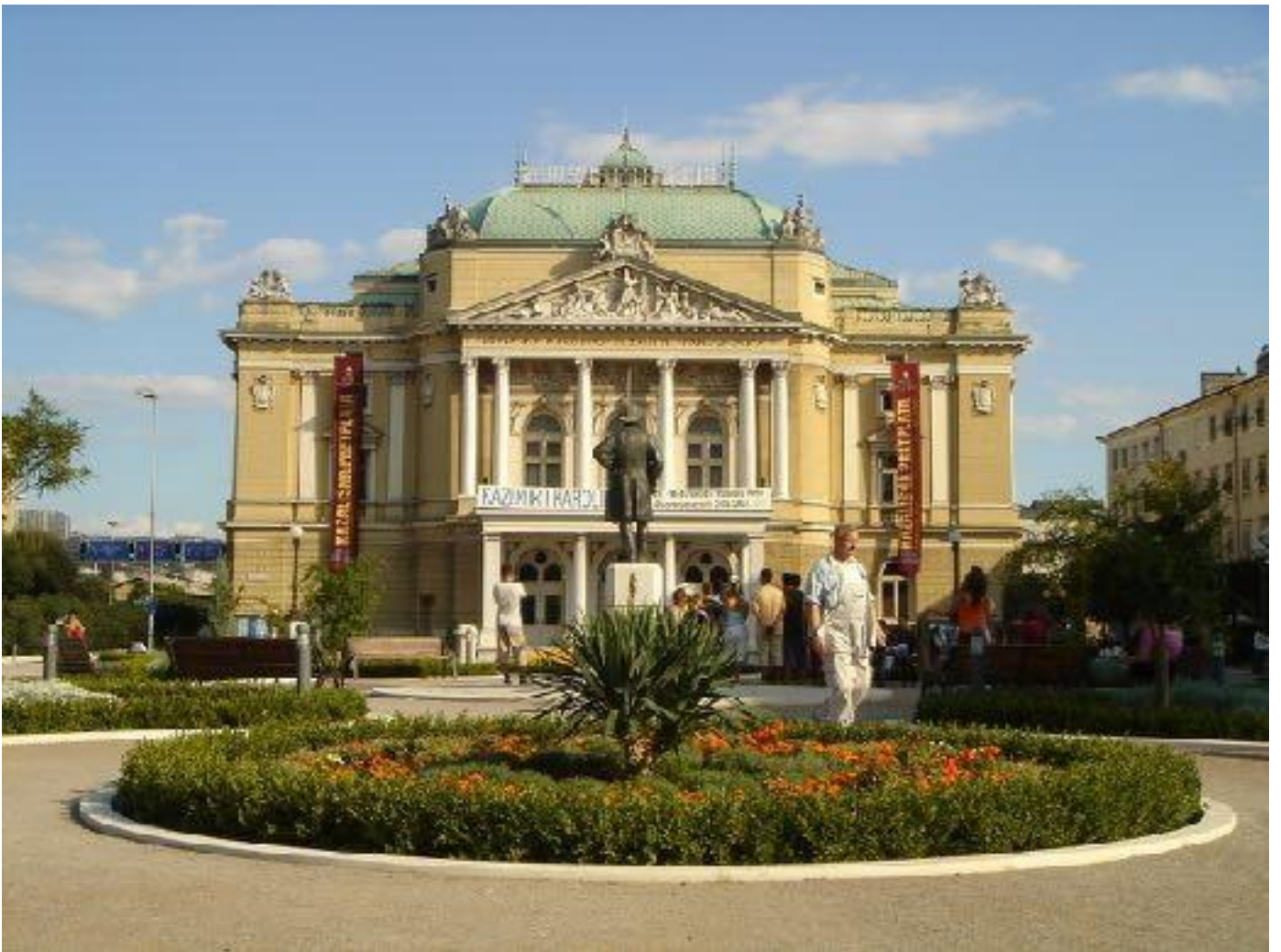
Іл. 6. Хорватський національний театр імені Івана Зайца. 1885.