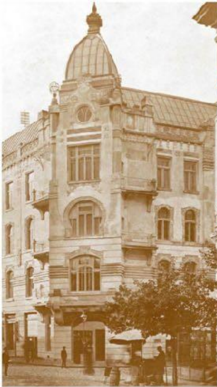
DOM DRA SEGALA WE LWOWIE, ULICY AKADEMICKIEJ I CHOPACZYŹNY, — ARCH. MICHAŁ ULAN.