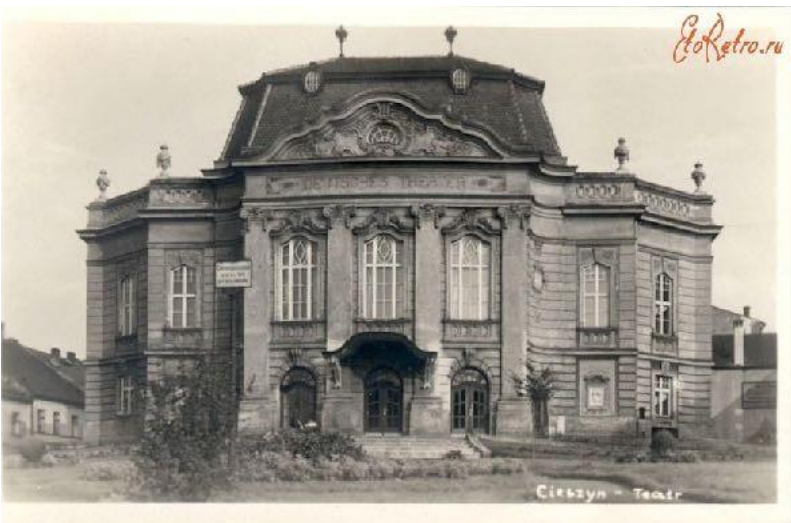
Іл. 10. Театр Адама Міцкевича в Цешині. 1910.