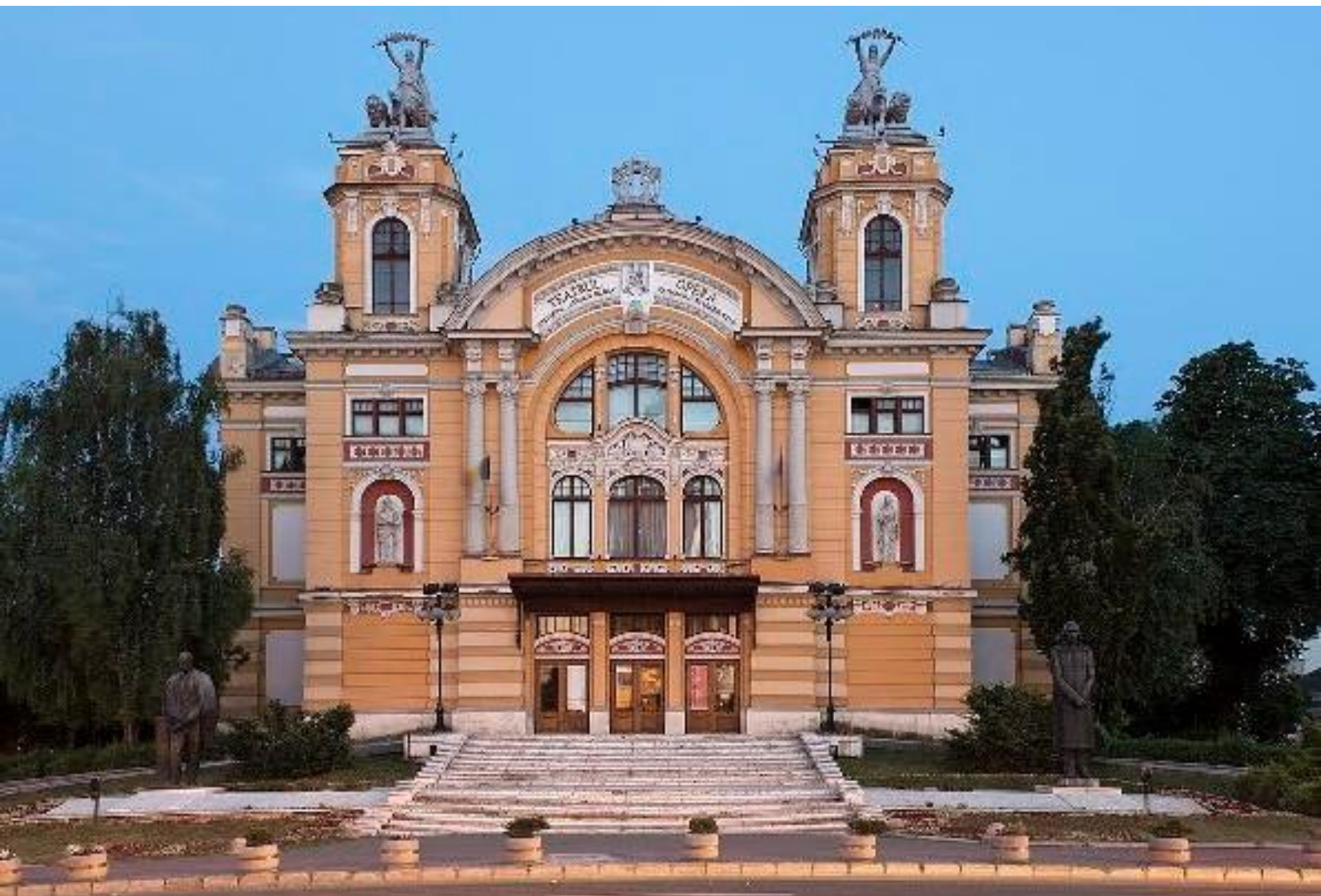
Іл. 15. Національний театр імені Лучіана Благ. 1906.