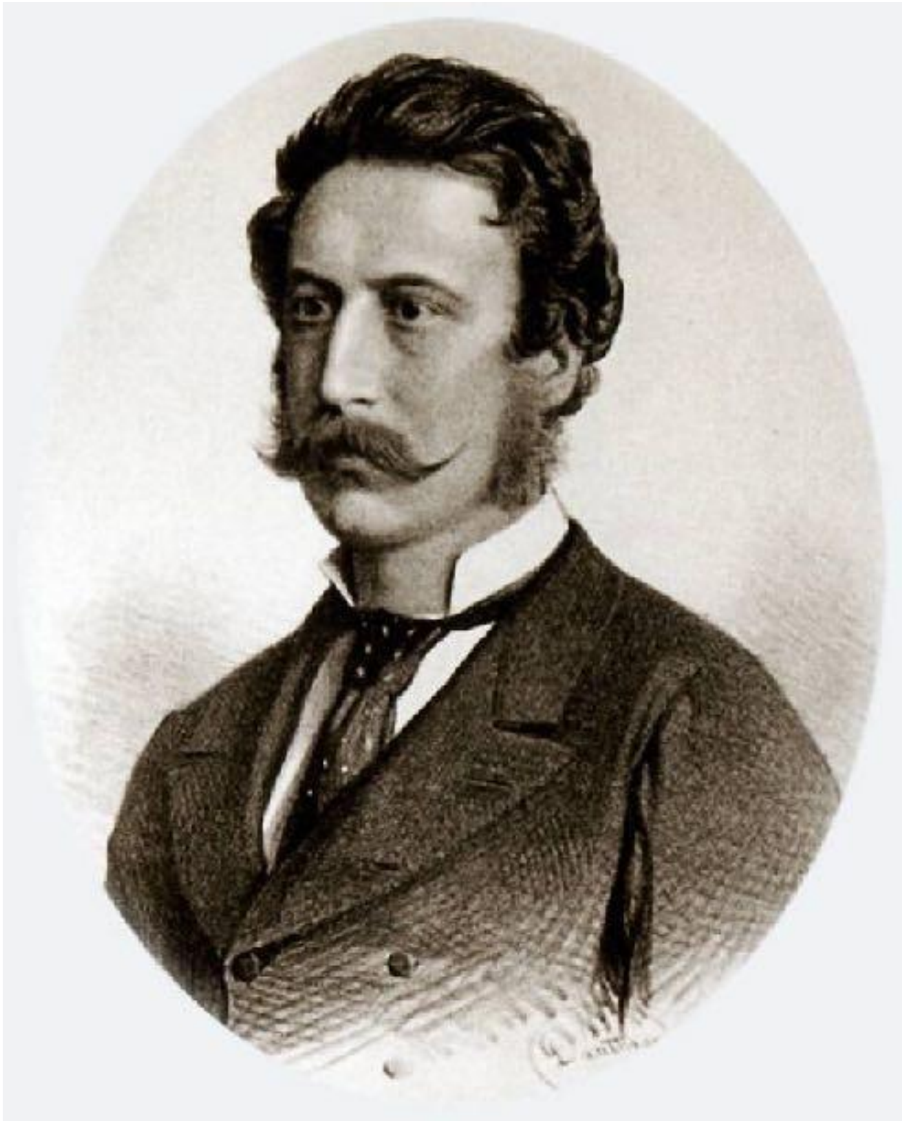
Іл. 1. Фердінанд Фельнер