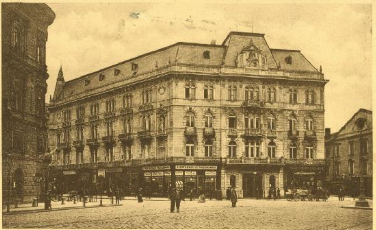
Lwów. Hotel Georgea. — Lemberg. Hotel Georg.

Іл. 28. Готель «Жорж». Поштова листівка з фондів Австрійської Національної бібліотеки.