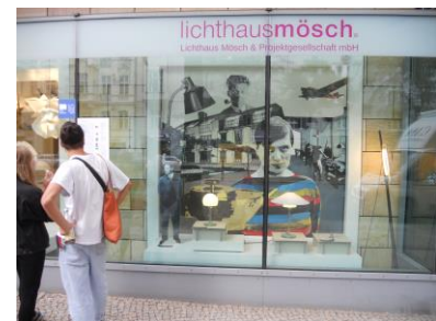
Мал. 3. Баухаузу – 100 років. Берлін, 2019.

Наукова новизна. Вперше в українському мистецтвознавстві комплексно розглянуто культурно-естетичні засади функціонального стилю в предметно-просторовому та візуально-інформаційному середовищі: меблях, посуді, текстилі, знакових формах, промисловій і рекламній графіці, фотографії, плакаті, упаковці, дизайні книги, web-дизайні. На підставі стилістичного аналізу емпіричних матеріалів різних країн доведено, що стилістика школи «Баухауз» має художню та функціональну цінності, а її твори набули статусу світової мистецької спадщини.