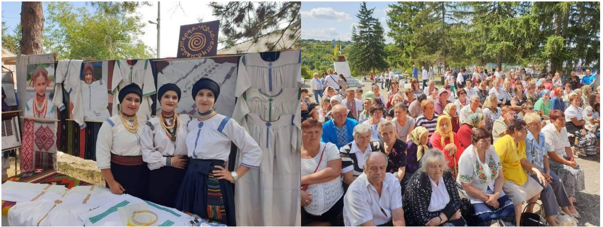
Фото 5,6. Фестиваль «Мамину сорочку пригорну до серця»

4.«Традиція випікання весільного короваю села Бондурівка Чечельницького району Вінницької області. Внесено до переліку Наказ №140 від 08.07.2019. Фестиваль «На гозері» проведено у с.Бондурівка Чечельницького району Вінницької області у 2017 році. Організатори ГО «Етномайстерня Коло», сільська рада. У фестивалі взяли участь колективи Чечельницького району та Вінниці [23].