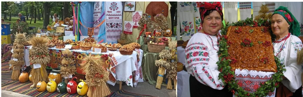
Фото 19, 20. Фестиваль «Скарби Поділля»

12. «Традиційний обрядовий хліб Вінниччини» Наказ №155 від 05.11.2020 р. Щорічно до Дня Незалежності України проводиться фестиваль «Скарби Поділля», обов'язкова складова фестивалю – традиційні хліби усіх вінницьких районів. У 2021 році було проведено тринадцятий фестиваль [28].