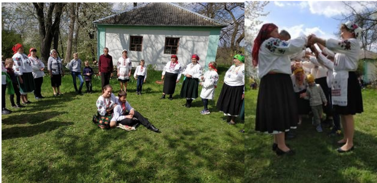
Фото 23, 24. Великодні веснянки у с.Новоселівка

15. «Великодні веснянки села Новоселівка» Наказ №357 від 04.06.2021 р. Проводиться щорічне свято у форматі сільського фестивалю [29].