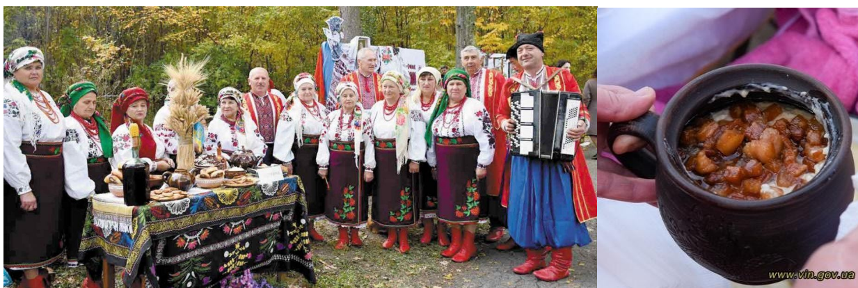
Фото 3,4. Фестиваль «Диво з горнятка – тиманівська каша»

Фестиваль був проведений тричі: у 2019, 2020, 2021 роках.