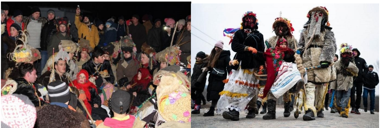
Фото 15,16. Маланкування у селі Попова Гребля

10. «Маланка» села Попова Гребля Чечельницького району Вінницької області. Обряд маланкування проводиться масово, за участі великої кількості жителів села. Двічі маланкування проводилось у форматі фестивалю із запрошенням гостей взяти участь у святкуванні. Після такого досвіду – жителі села відмовились від фестивального формату, оскільки почали спостерігати зміни в традиції [27].