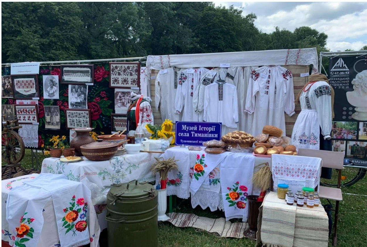
Фото 32. Виставка с.Тиманівка на фестивалі «Живий вогонь»

23 серпня відбувся XIII Обласний фестиваль народного мистецтва «Скарби Поділля». Місце проведення: м.Вінниця, центральний парк ім. М.Леонтовича. У фестивалі взяли участь представники громад з усієї області. Відвідали фестиваль біля 7000 осіб.