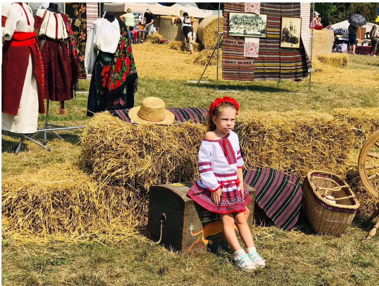
Фото 34. На фестивалі «Покоління незалежних»

24 серпня проведено Молодіжний фестиваль «Покоління незалежних». Місце проведення: м.Вінниця, парк «Дружби народів» (відвідало біля 10000 чол.)