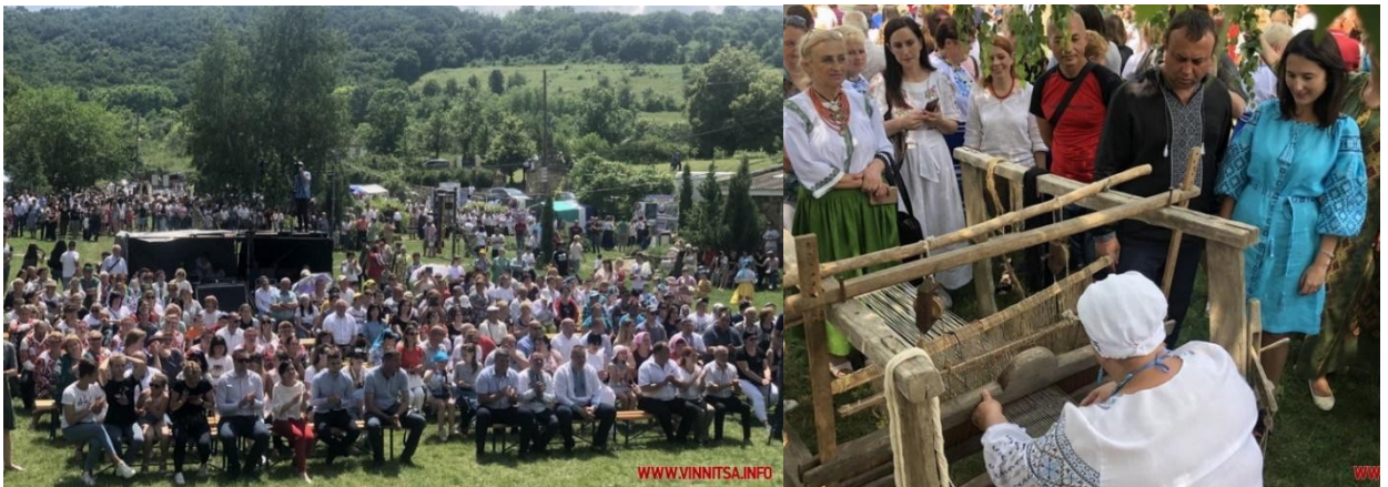
Фото 29, 30. Фестиваль «Подільський оберіг»

фестиваль «Подільський оберіг». У фестивалі взяли участь близько 300 учасників: з них біля 200 – артисти. Більше 100 чоловік – представники громад сусідніх сіл та районів, які взяли участь у фестивалі заради предствлення культури свого села у виробах народного мистецтва (ткацтво, вишивка, гончарство тощо) та локальних особливостях традиційної кухні, тобто елементів нематеріальної культурної спадщини. Село Буша представляло свій елемент НКС «Ткацькі практики сіл Буша та Дорошівка Ямпільського району». Фестиваль відвідало більше 2000 осіб – туристів [32].