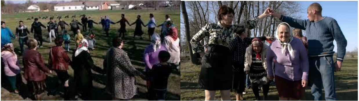
Фото 13,14. Великодне гуляння «Водити Володара»

10. «Маланка» села Попова Гребля Чечельницького району Вінницької області. Обряд маланкування проводиться масово, за участі великої кількості жителів села. Двічі маланкування проводилось у форматі фестивалю із запрошенням гостей взяти участь у святкуванні. Після такого досвіду – жителі села відмовились від фестивального формату, оскільки почали спостерігати зміни в традиції [27].