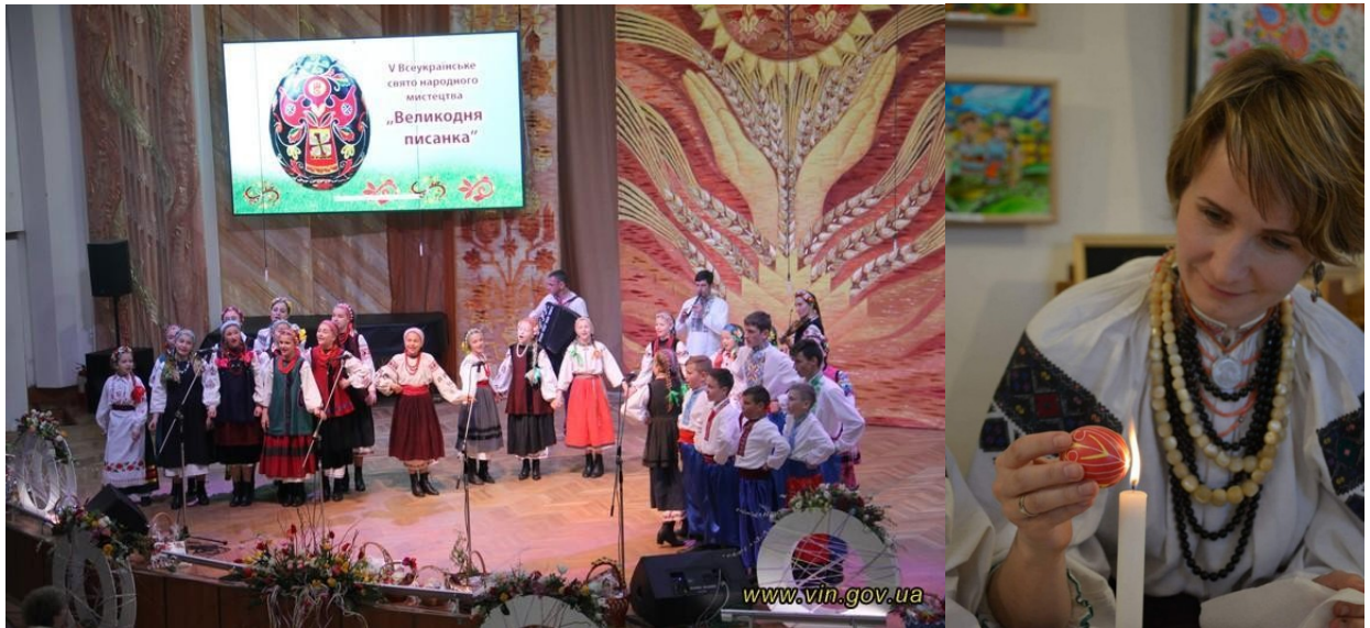
Фото 25, 26. Всеукраїнське свято «Великодня писанка»

28. Писанки Східного Поділля Вінниччина. Всеукраїнське свято народного мистецтва «Великодня писанка». Проводиться кожні три роки [30].