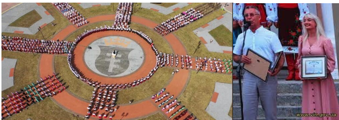
Фото 27, 28. Культурно-мистецька акція «Щедрик – мелодія Вінниччини»

26 червня було проведено культурно-мистецьку акцію «Щедрик – мелодія Вінниччини» у м.Тульчин Тульчинського району Вінницької області на площі біля Палацу Потоцьких. Місто Тульчин обрано не випадково, оскільки тут протягом багатьох років жив і пацював М.Леонтович. Під час акції відбулось встановлення рекорду України з наймасовішого виконання «Щедрика» М.Леонтовича. Одночасно виконували твір 3512 осіб з 68 вокально-хорових колективів Вінницької області. Наразі, працівниками культури Вінницької області готується до подання елемент НКС «Традиція виконання «Щедрика» М.Леонтовича на Вінниччині» [31].