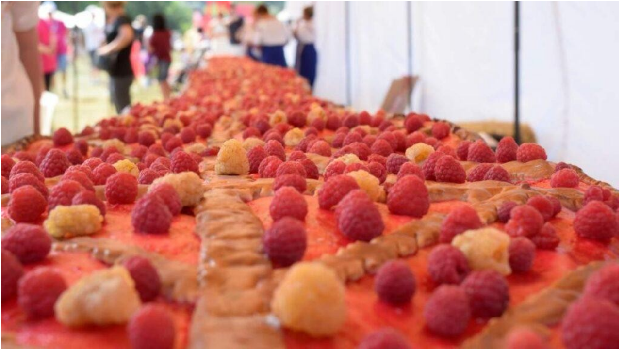
Фото 31. Рекордний малиновий пиріг на фестивалі «МалинаФест»

24 липня відбувся XII Міжнародний фестиваль звичаєвої культури «Живий Вогонь». Місце проведення: с.Якушинці Вінницької області. Засновником та головним організатором фестивалю є Крайове Товариство «Вінницький козацький полк ім. І.Богуна». Фестиваль традиційно присвячений козацькій тематиці і збирає шанувальників традицій козацького бою та побуту. Однак, у 2021 році організатори фестивалю вирішили розширити тематику фестивалю і запросили представників громад, чії елементи НКС включені до Обласного переліку нематеріальної культурної спадщини. На фестивалі були представлені елементи: Традиція орнаментального розпису бубнівської кераміки; Ткацькі практики сіл Буша та Дорошівка Ямпільського району; Картопля по-уланівськи; Традиції випікання Байківських весільних короваїв; Традиційна жіноча вишита сорочка «з квіткою» с.Клембівка Ямпільського району Вінницької області; Традиційний обрядовий хліб Вінниччини; Створення та Побутування витинанки на Вінниччині. Локація, де були розташовані представники громад з презентаціями елементів НКС, користувалась чи не найбільшим попитом у гостей фестивалю. Фестиваль відвідали близько