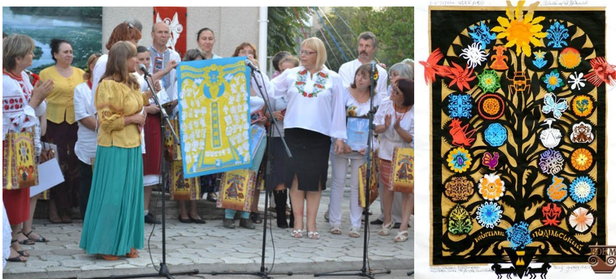
Фото 21, 22. Міжнародне свято «Українська витинанка»

14. «Створення та побутування витинанки на Вінниччині» Наказ №357 04.06.2021 р. Міжнародне свято народного мистецтва «Українська витинанка» проводиться з 2011 року у форматі міжнародного фестивалю раз у три роки у м.Могилів-Подільський Вінницької області [29].