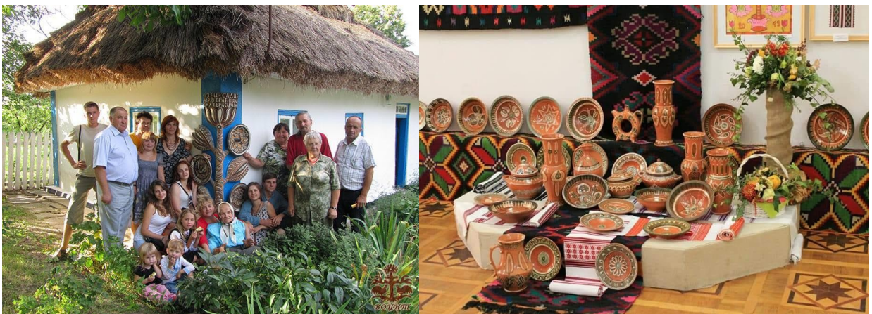
Фото 1,2. Обласний пленер гончарів «Освячені горном»

Новоселівка, Гайсинського району, які є історичним та фактичним ареалом побутування даного елемента, по 2020 рік включно проводились обласні (у 2022 році всеукраїнський) пленери-практикуми гончарного мистецтва «Освячені горном». Протягом 10-14 днів на базі сільського клубу с.Бубнівка відбувалась практична робота майстрів народного мистецтва з гончарства. Під час цієї роботи проводились майстер-класи, які відвідували всі бажаючі, залучаючи місцевих жителів та туристів з інших міст. В останній день роботи пленеру організовували свято обласного рівня, під час якого в обох селах, бубнівці та Новоселівці, відбувались виступи місцевих хореографічних та вокальних колективів, які приїхали з обласного центру та з інших сіл та міст області. Одночасно проводився ярмарок (виставка-продаж) майстрів народного мистецтва Вінницької області. Окрім організаторів та учасників пленеру, на свято приїжджали люди із сусідніх сіл, районних центрів та з м.Вінниця. За термінологічним визначенням фестивалів, останній день пленеру є фестивалем з усіма притаманними йому ознаками [20].