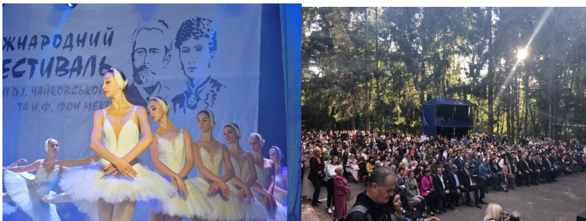
Фото 35, 36. Фестиваль ім. П. І. Чайковського та баронеси фон Мекк

5 вересня відбувся XVIII Міжнародний фестиваль імені П.І.Чайковського та Н.Ф. фон Мекк. Місце проведення: смт Браїлів Жмеринської ТГ Вінницької області, територія садиби баронеси Н.Ф. Мекк. Відвідало біля 5000 осіб.