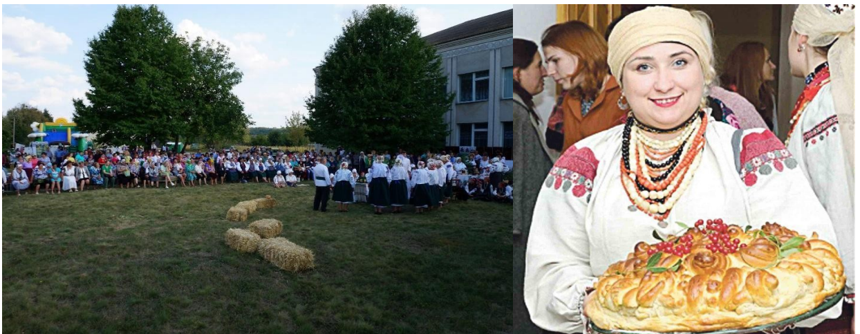
Фото 7,8. Фестиваль «На гозері»

4.«Традиція випікання весільного короваю села Бондурівка Чечельницького району Вінницької області. Внесено до переліку Наказ №140 від 08.07.2019. Фестиваль «На гозері» проведено у с.Бондурівка Чечельницького району Вінницької області у 2017 році. Організатори ГО «Етномайстерня Коло», сільська рада. У фестивалі взяли участь колективи Чечельницького району та Вінниці [23].