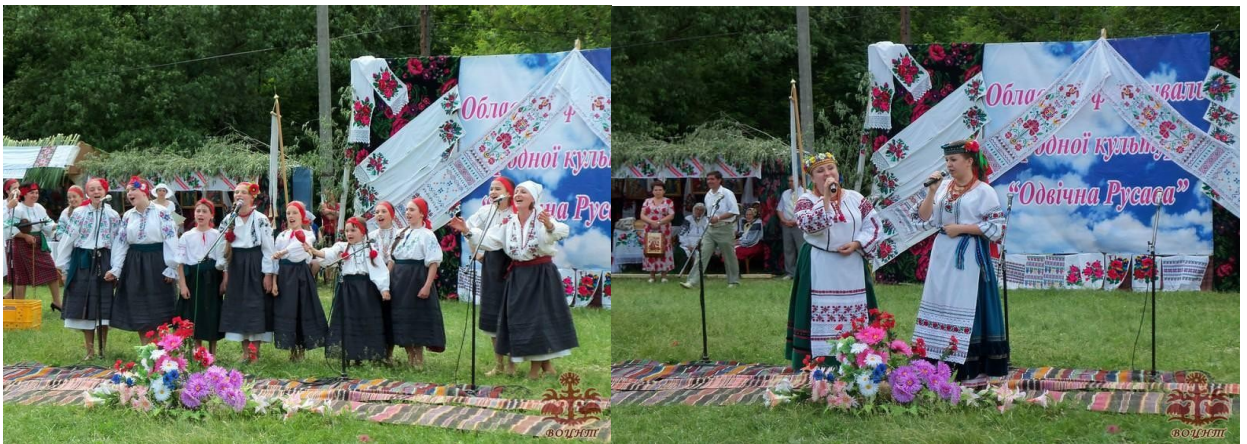
Фото 11, 12. Фестиваль «Одвічна Русава»

8. «Пісенна традиція села Стіна Томашпільського району Вінницької області»; Наказ №49 від 14.04.2020 р. З 2010 року в с.Стіна кожні два роки проводиться фестиваль «Одвічна Русава», присвячений традиціям рідного краю, в тому числі пісенній традиції. Фестиваль почергово має районний і обласний формати [25].