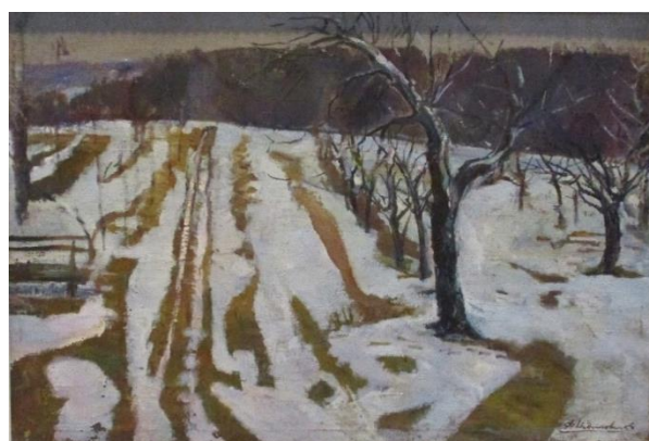
Рис. 4. Засніжений сад, п., о., 60 x 80, 1995 р. [12, 69]

Художник різноманітний у композиціях, очевидно, вони давались йому легко. Він тонко відчував простір і вміло його осягав (рис. 1–4). Влучно віднаходив смисловий і композиційний центри. Найсильнішим, напевно, компонентом мистецтва Ф. Недошовенка є колір. Сміливо розбиратися в поліфонії предметних форм і планів перспективи йому дало змогу відмінне почуття єдності тону й колірної гармонії. За рідкісними винятками (наприклад «В осінньому натюрморті», 1995) йому притаманна витончена, ненасичена колірна гама.