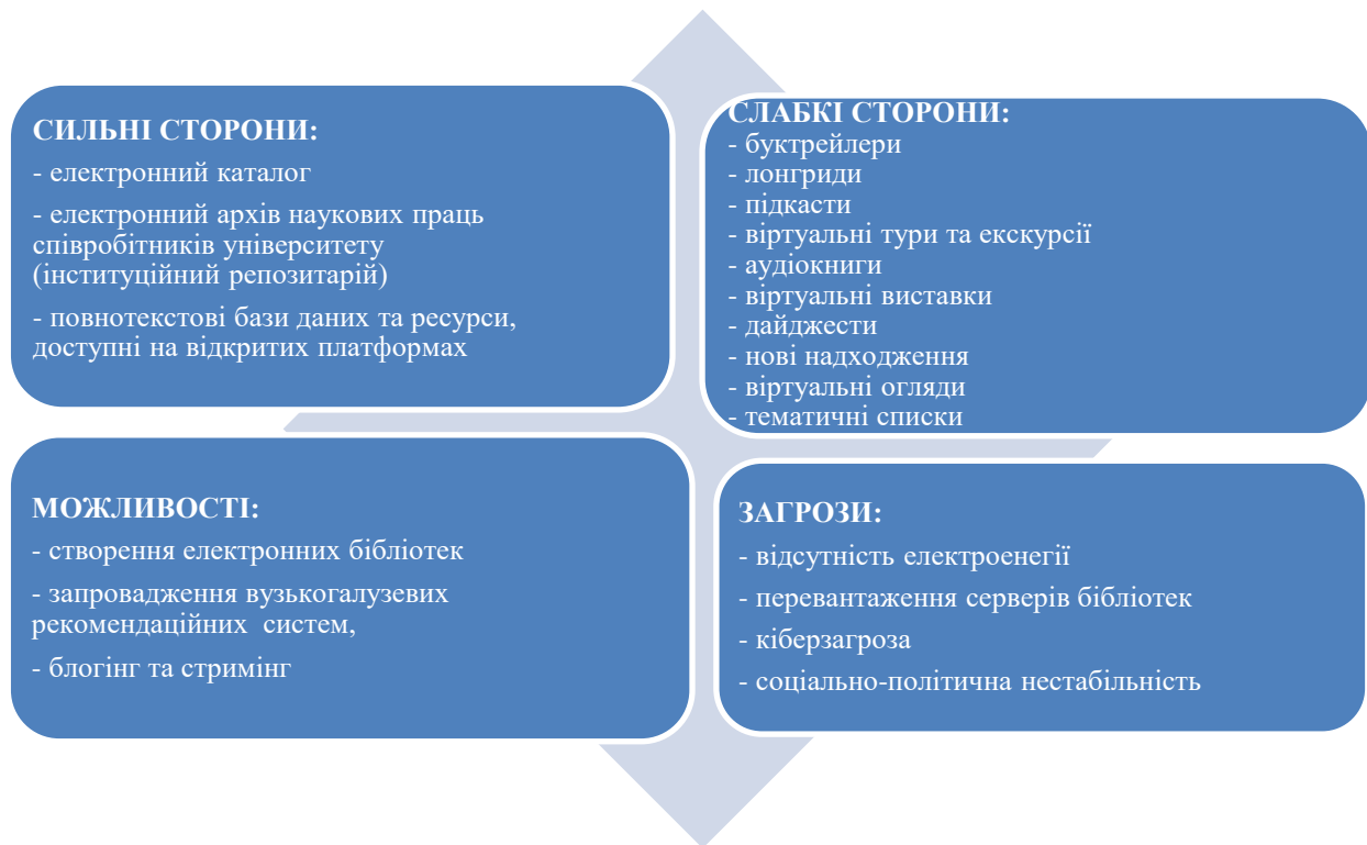
Рис. 2. SWOT-аналіз електронних інформаційних ресурсів бібліотек закладів вищої освіти України

Сильні сторони. Наведена табл. 2 засвідчує, що поширеними електронними інформаційними ресурсами залишаються електронний каталог та електронний архів наукових праць співробітників університету (інституційний репозитарій). Ці електронні інформаційні ресурси стали основними для бібліотек, вони були популярними ще задовго до часів карантинних обмежень.