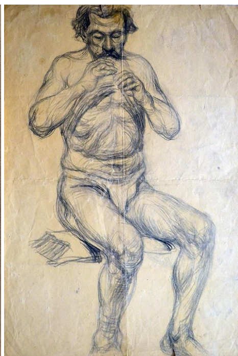
Рис. 5. М. І. Сапожников. «Малюнок натурника для Лісовика». Папір, олівець, 71,5×49 см. Збірка Дніпровського художнього музею

Дослідивши колекцію творів Михайла Сапожникова виявили зв'язок із 26 картинами символістських серій 53 допоміжних робіт, серед яких такі: пленерні етюди – 12 одиниць, ескізи – 5 одиниць, начерки чоловічих, жіночих постатей та академічні постановки, виконані в різноманітних техніках оригінальної графіки – 34 одиниці, а також 2 естампи виконаних в техніці лінориду, які присвячені провідному персонажу символістських творів художника – міфологічній постаті Пана.