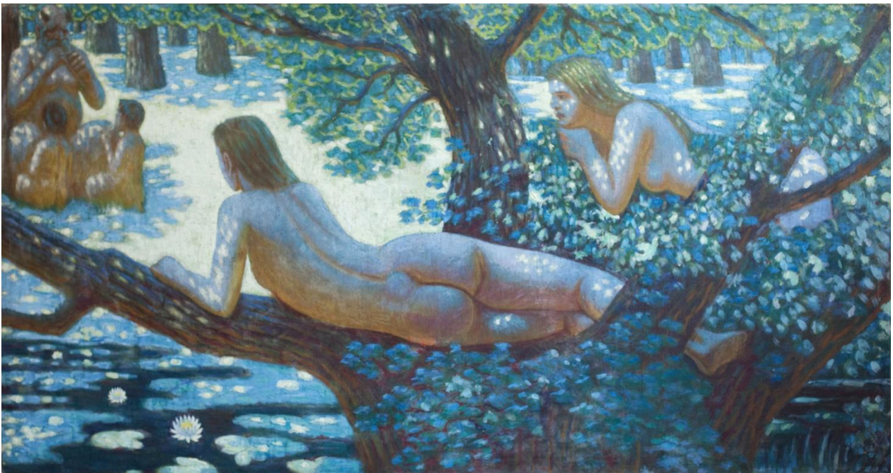
Рис. 3. М. І. Сапожников. «Пісня сопілки». 1918–1924. Полотно, клейові фарби, 100,5×188,5 см. Збірка Дніпровського художнього музею