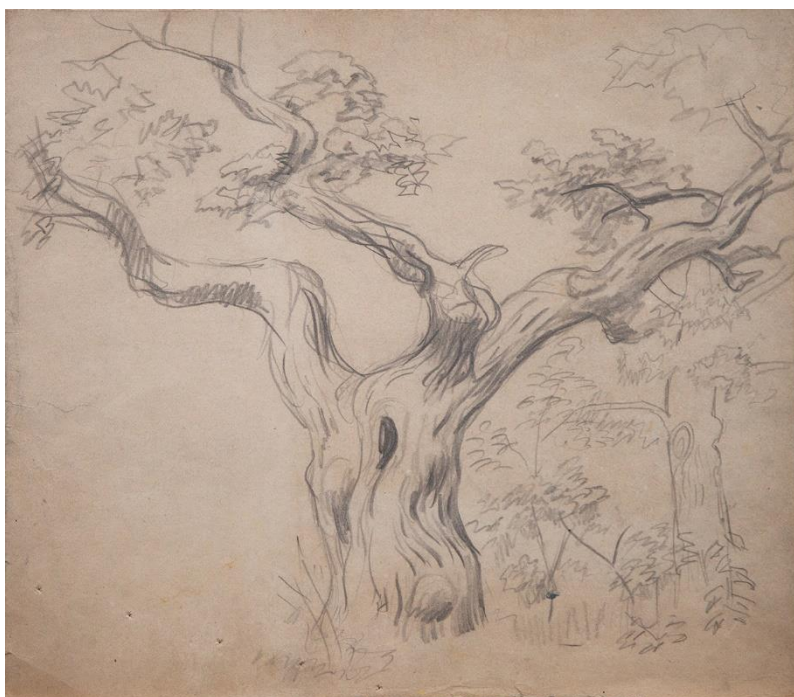
Рис. 4. М. І. Сапожников. «Дерево». Папір, олівець, 33×37,5 см. Збірка Дніпровського художнього музею