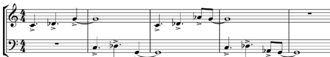
mm. 200–203. French Horns and Basses are 'in Canon'

нагнітають атмосферу. Як підтвердження такого настрою, ми відчуваємо весь трагізм ситуації в переломному моменті кульмінації «Червоної» частини (такт № 200). Акомпануючи, валторни та секції низької міді немов обмінюються тризвучним мотивом у тісному розташуванні з дисонансним звучанням Re бемоль . Цей фрагмент виразно відображає боротьбу за життя дядька композитора і в цей момент мелодичні дисонанси підкреслюють драматичний зміст події.