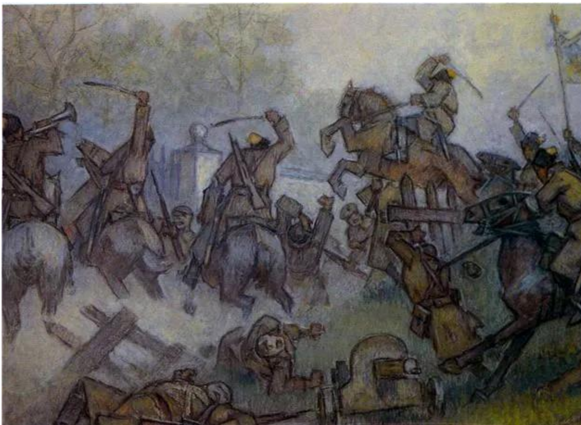
Рис. 1. Кавалерійська атака. Акварель