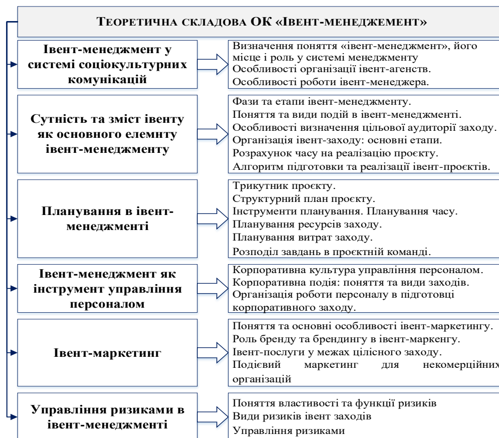
Рис. 1. Теоретичні складові курсу «Івент-менеджмент» в ОП «Соціальні комунікації та інформаційна діяльність» спеціальності 029 «Інформаційна, бібліотечна та архівна справа» у Національному університеті «Львівська політехніка»