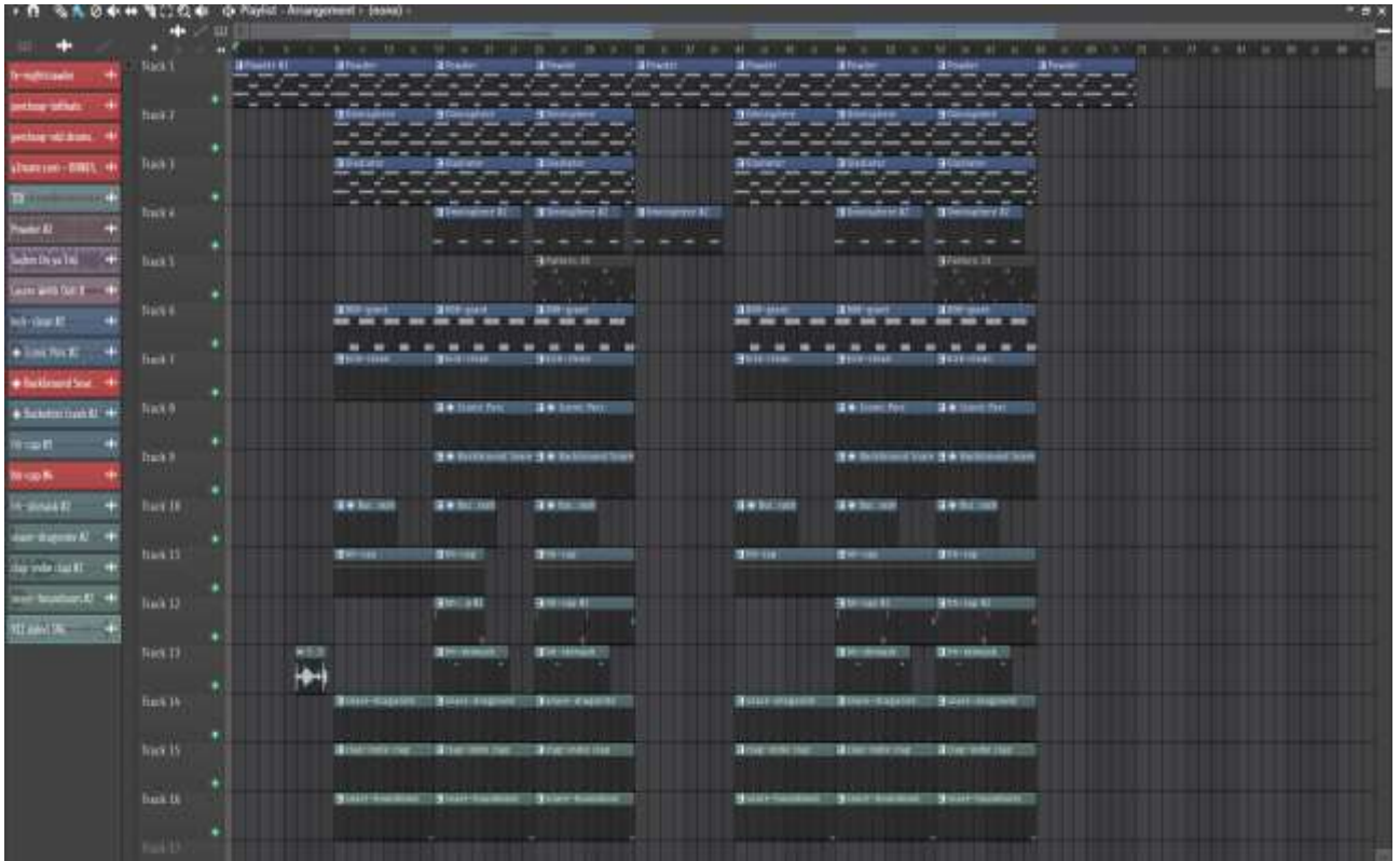
Проект інструменталу «ГmNotHereAnymore».