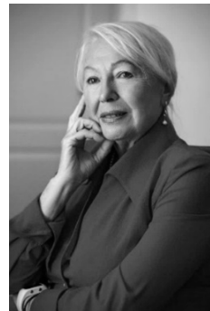
Алла Терещенко , член-кореспондент Національної академії мистецтв України, доктор мистецтвознавства, професор, провідний науковий співробітник відділу музикознавства Інституту мистецтвознавства, фольклористики та етнології імені М. Т. Рильського НАН України, професор Київського національного університету театру і кіно імені І. Карпенка-Карого, м. Київ, з доповіддю «Шлях до визнання. Початок (про інструменталістів Львівської музичної школи)»