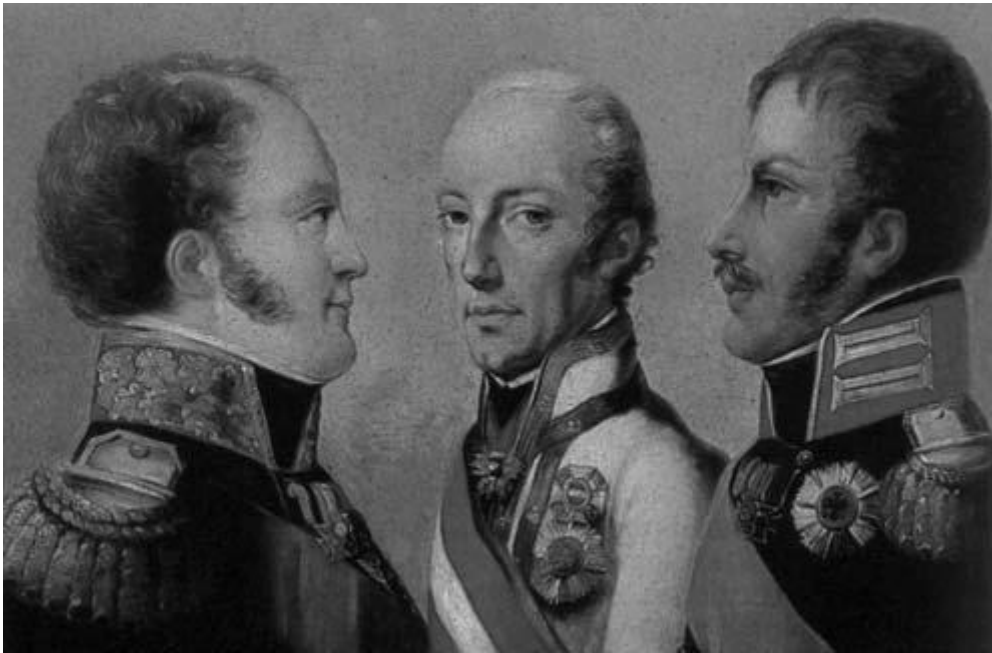
Правителі держав Священного союзу: російський цар Олександр I, пруський король Фрідріх Вільгельм III, австрійський імператор Франц I.

мусульманин не міг брати участь у Священному союзі християнських монархів) і Папи Римського. Хоча Британія офіційно не ввійшла до Союзу, вона фактично координувала свою політику відповідно до його політичної лінії.