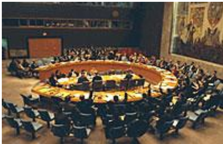
Засідання Ради Безпеки ООН.