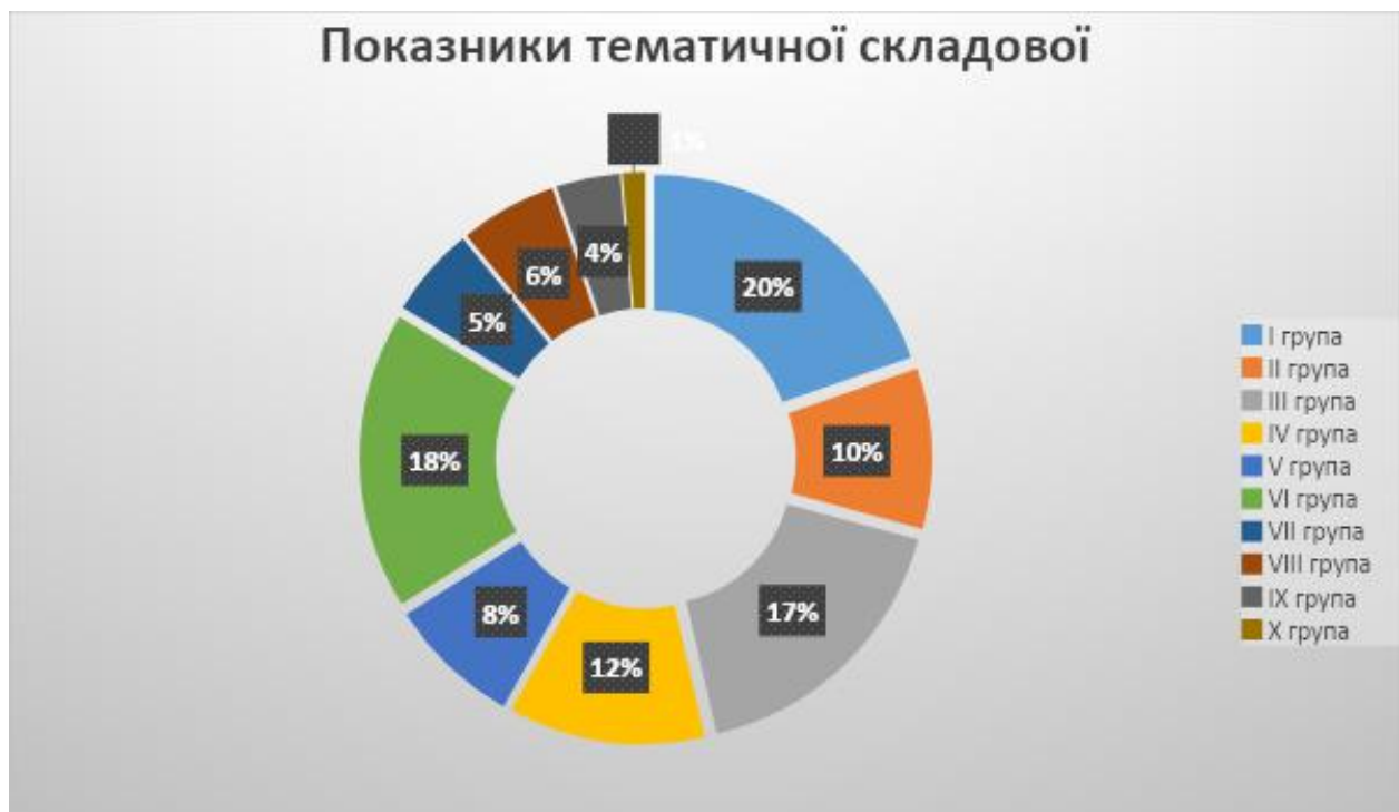
Діагр. 1. Загальні показники тематичної складової бібліотекознавчої періодики

бібліотекознавства, реорганізаційні зміни у формуванні краєзнавства, умовно належатимуть до десятої групи. Частка цих публікацій у досліджуваних виданнях, за вказаний період, складає 1% від загальної кількості тематичної спрямованості публікацій.