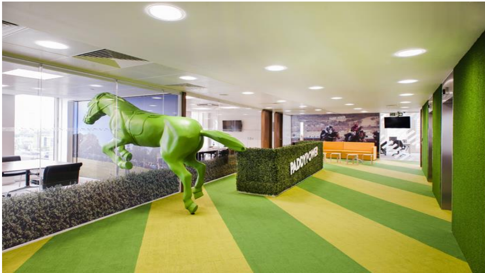
Рис. 1.7. Лондонський офіс компанії Paddy Power Незвичайний дизайн стелі з «хмарним» принтом