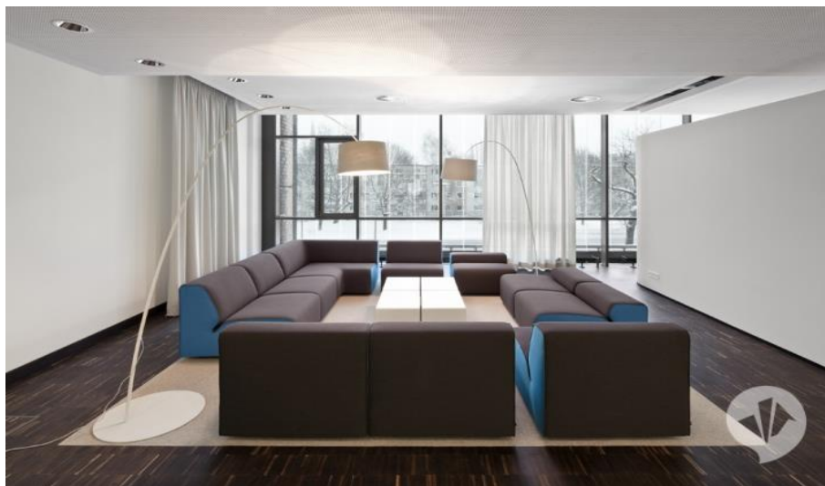
Рис. 1.2. Інтер'єр офісу MTV Networks

Білі пластикові вкраплення, які підсвічуються з внутрішньої сторони, прикрашають практично кожну стіну, пофарбовану в блідо-фіолетовий колір, що надає приміщенню тепло і затишок.