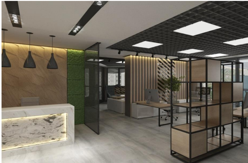
Рис. 1.15. Інтер'єр офіса Веґо Україна