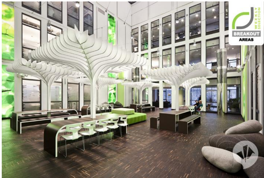
Рис. 1.1. Сучасний інтер'єр головного офісу MTV Networks

Білі пластикові вкраплення, які підсвічуються з внутрішньої сторони, прикрашають практично кожну стіну, пофарбовану в блідо-фіолетовий колір, що надає приміщенню тепло і затишок.