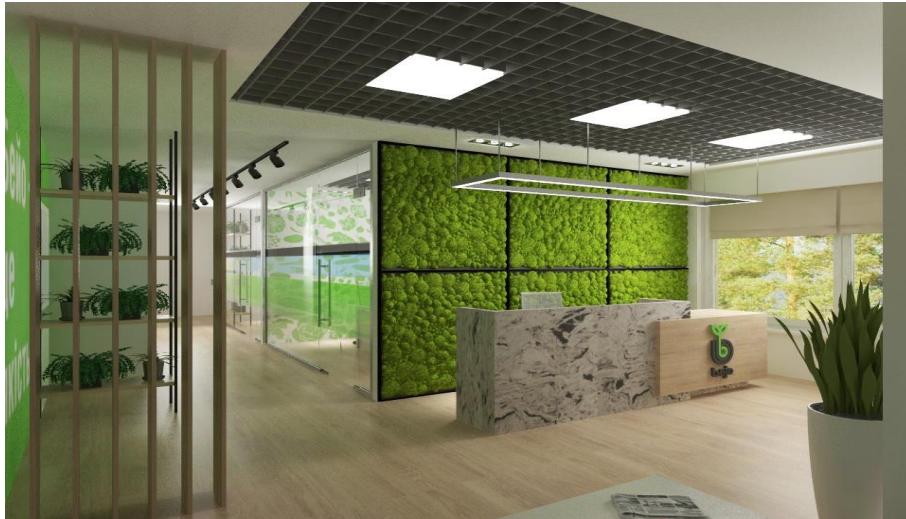
Рис. 1.13. Дизайн офісу Вежо Україна

Стильний проект для українського офісу міжнародної компанії Вежо. Ретельно продумане планування, сучасні матеріали і технології, функціональні меблі та техніка.