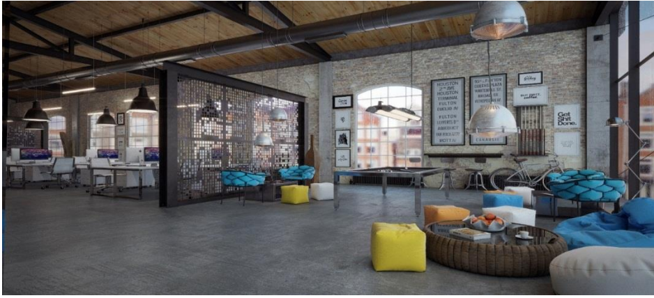
Рис. 1.11. Інтер'єр офісу в стилі «open space»

Часто в даному стилі «open space» виконують дизайн маленького офісу, що дозволяє максимально та раціонально використовувати наявний простір. Найчастіше такі офіси оформляють в світлих тонах, використовуючи один-два яскравих акценти, наприклад, фотошпалери.