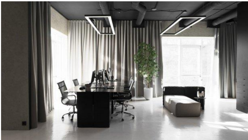
Рис. 1.12. Дизайн інтер'єру офісу Ya Vsesvit.

Проект української студії Yakusha - офіс Ya Vsesvit.