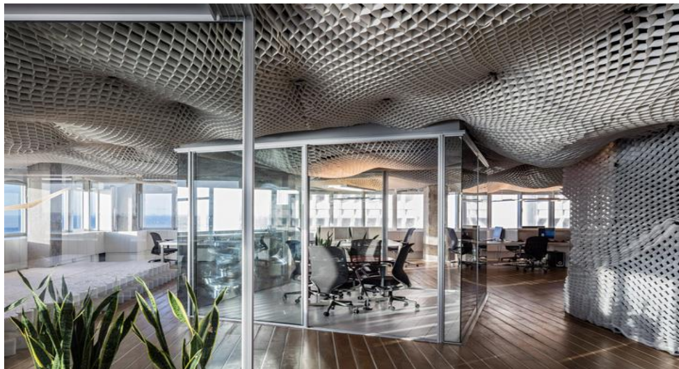
Рис.1.8. Незвичайний дизайн стелі в офісі компанії PRS

Paritzki & Liani Architects створила незвичайний дизайн стелі офісу в Тель-Авіві. «Роздутий стелю» був створений з використанням фірмового продукту марки PRS. Ізраїльської студії було запропоновано спроектувати новий офіс для PRS на 12-му поверсі багатоповерхового вежі Шарбат.