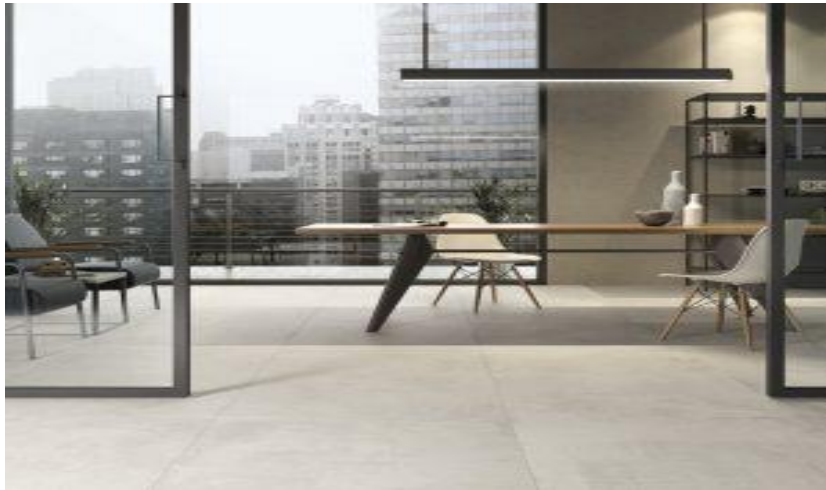
Рис. 3.1. Плитка з керамограніту

Відповідно, розробка стильового оформлення інтер'єру виконується з врахуванням особливостей та побажань конкретної особистості. У кожної людини погляди на особистий простір абсолютно різні: хтось цінує гармонійність інтер'єрів кожної кімнати та спокійні, стримані тони, а інші віддають перевагу нестандартним, креативним рішенням та яскравим кольорам.