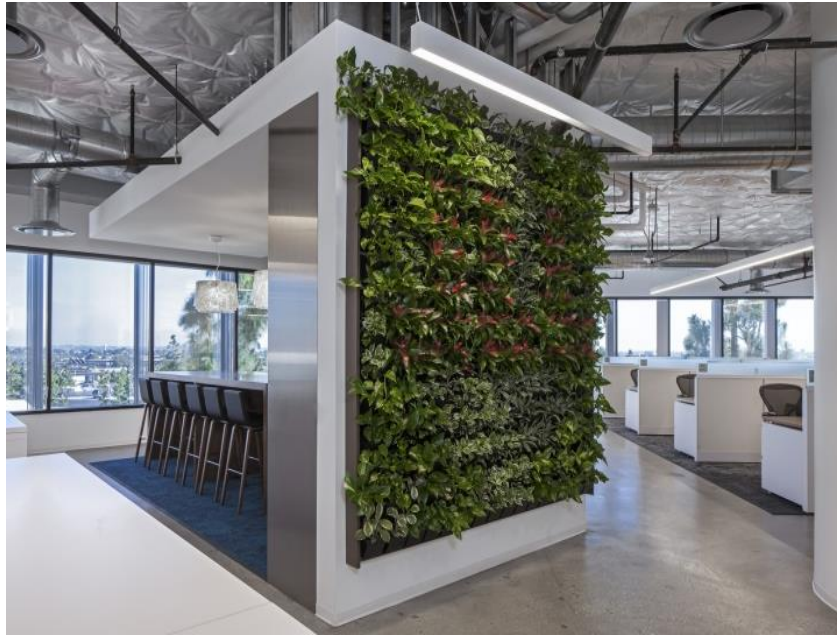
Рис. 1.3. Дизайн офісу Wirt Design Group

планування дозволяє клієнтам вільно переміщатися по офісу і насолоджуватися панорамними видами з вікон.