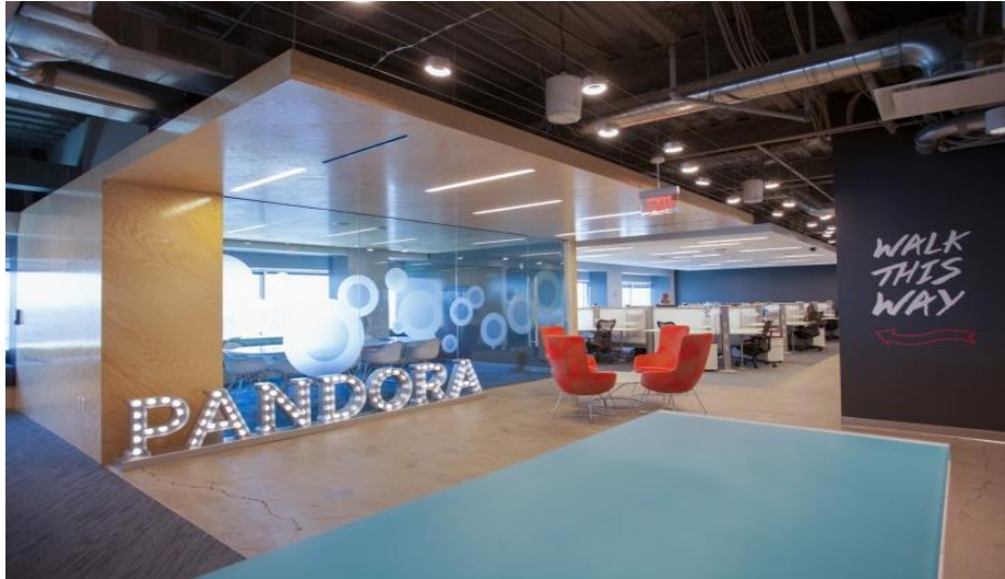
Рис. 1.5. Інтер'єр приміщення офісу компанії Pandora Media

Інтернет компанія Pandora Media отримала повний спектр дизайнерських послуг для свого офісу в Бостоні. Інтер'єр приміщень був натхненний специфікою фірми, яка займається музикою. По всьому офісу можна побачити графіті, дублюючі типові написи на концертних майданчиках.