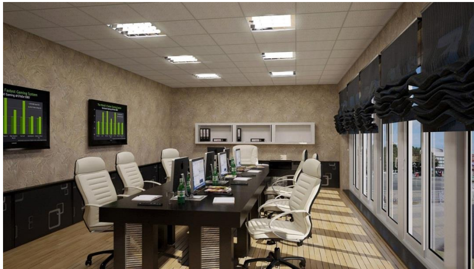
Рис. 1.10. Дизайн офісу в стилі «open space»

Назва стиль це насам-перед - максимум відкритого простору. Такий дизайн офісу отримав велику популярність в різних компаніях в США і тепер набирає популярності у вітчизняних компаніях. Інтер'єр офісу який виконаний в стилі «open space», відрізняється такими перевагами: