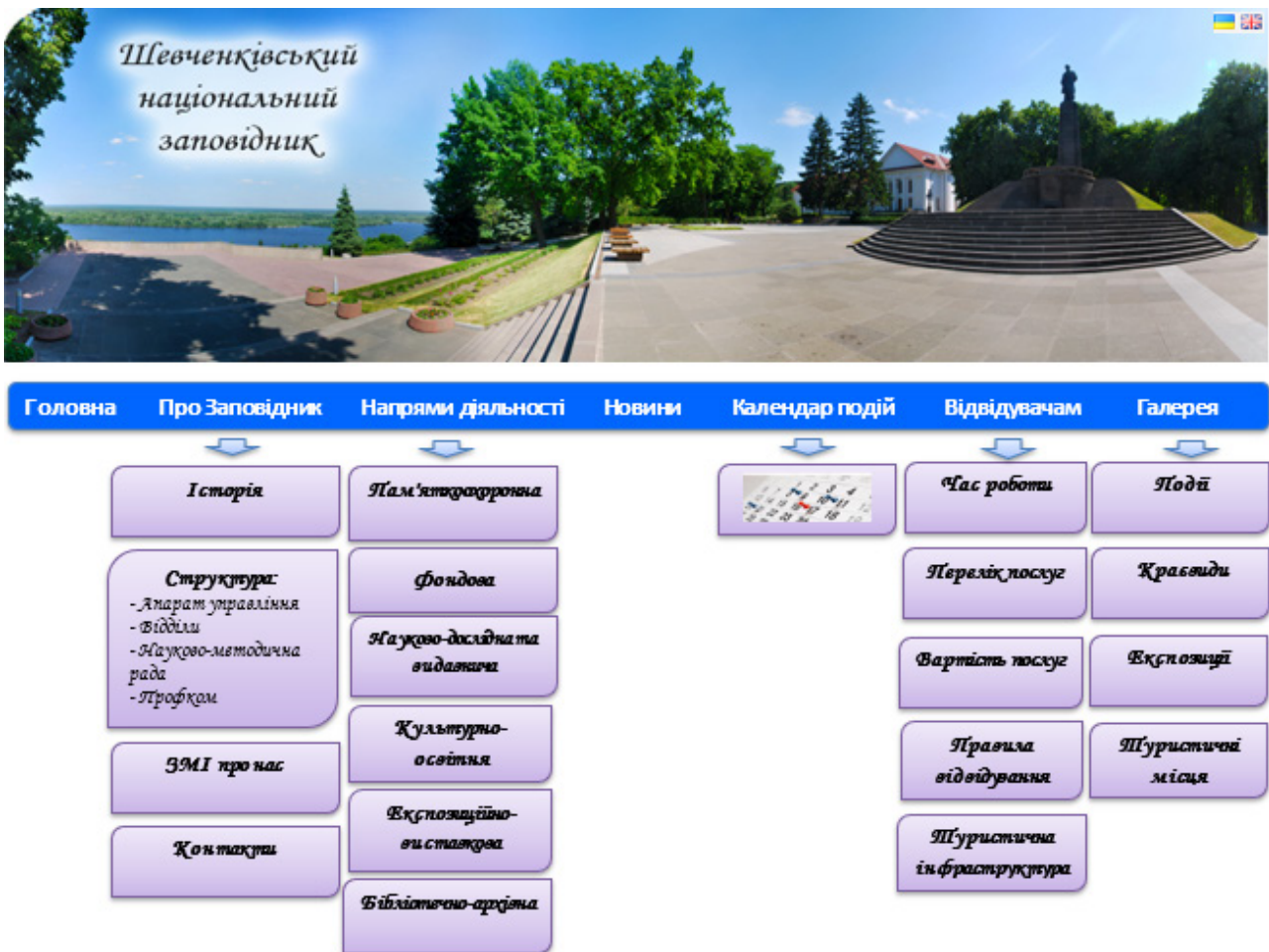
Рис. 4. Структуризація інформаційного наповнення меню веб-сайту ШНЗ (альтернативний варіант розроблений на основі проведеного аналізу)

дослідна та видавнича», «Культурно-освітня», «Експозиційно-виставкова», «Бібліотечно-архівна»), «Новини», «Календар подій», «Відвідувачам» (підрозділи: «Час роботи», «Перелік послуг», «Вартість послуг», «Правила відвідування», «Туристична інфраструктура») та «Галерея» (підрозділи: «Події», «Краєвиди», «Експозиції», «Туристичні місця») (Рис. 4).