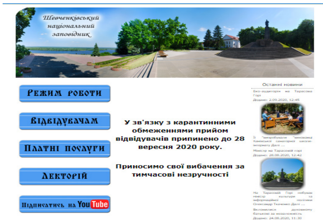
Рис. 1. Головна сторінка веб-сайту ШНЗ

Головна сторінка організована як стартова для пошуку необхідних документально-інформаційних ресурсів та довідкової інформації (Рис. 1).