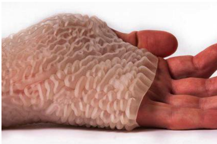
Рис. 2. Н. Оксман. Прототип захисної рукавички «Carpal Skin». 2010

Найбільш помітний вплив подібних технологій в більшій мірі орієнтований на прояв в майбутньому, тому на етапі виникнення ці технології можуть містити невизначені, неоднозначні і не до кінця узгоджені елементи. Залежно від інформаційного джерела список цих технологій може варіюватися, але більшість авторів сходиться на думці, що освітні технології, інформаційні технології, нанотехнології, біотехнології, когнітологія (наука про мислення), психотехнологія, робототехніка, штучний інтелект та інші напрямки відносяться до емергентних технологій [12].