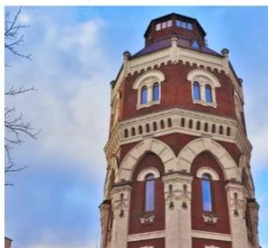
Рис. 2.3. Архітектура модерну Віктора Нільсена.