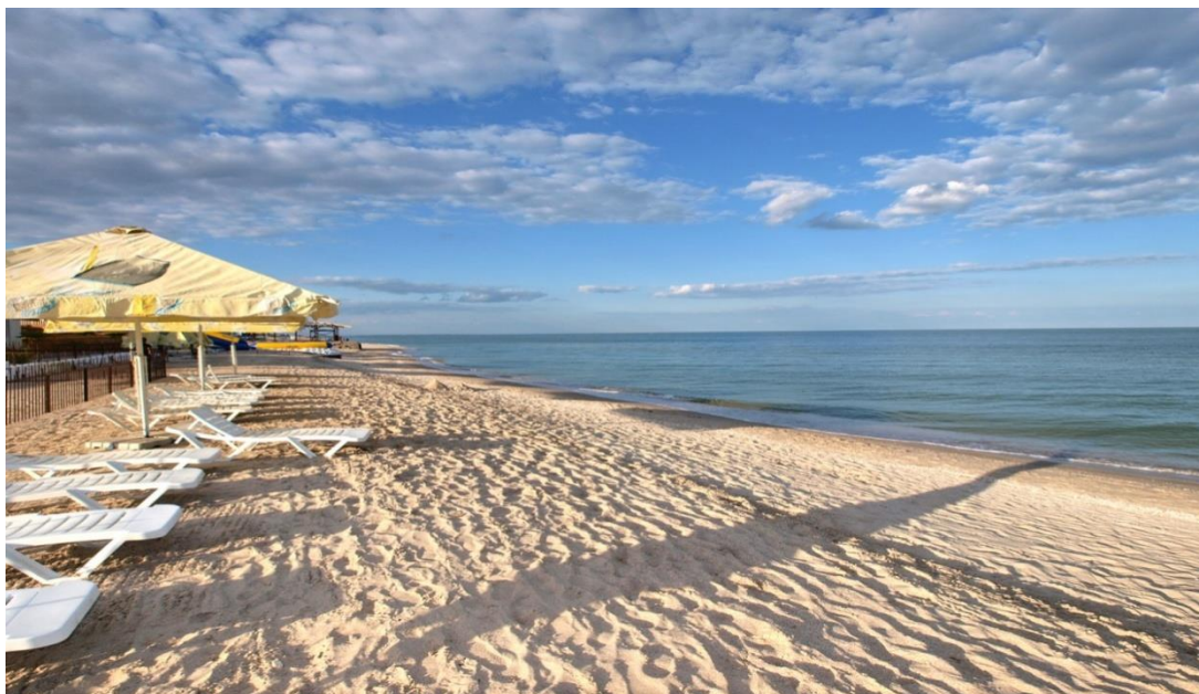
Рис. 2.1. – Азовське море