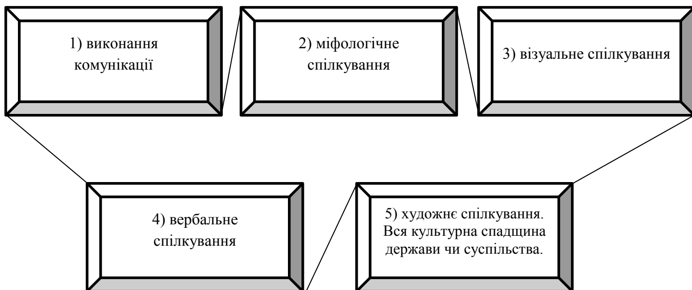
Рис. 1.1 – Складові комунікаційного простору