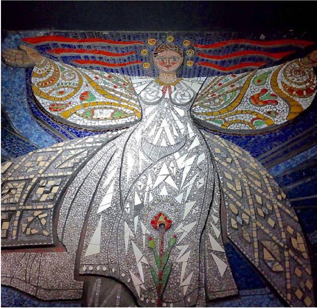
Рис. 2.2. Мозаїки Віктора Арнаутова.