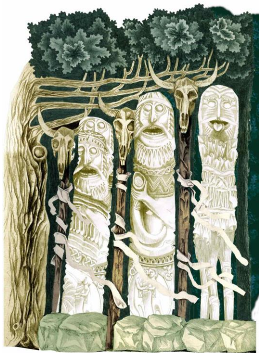
Рис. 9. Цугорка О. Ескіз декорацій до балету «Володар Борисфену», Київ, 2010

Художник-постановник – людина, яка візуалізує театральну постановку: бере участь у процесі вибору костюмів, оформлення сцени, визначення образів акторів та інших важливих організаційних моментах, від яких залежить успішність театральної постановки. Тобто художник театру генерує ідеї, необхідні для створення автентичної атмосфери.