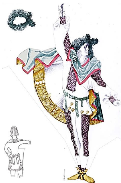
Рис. 11. Цугорка О. Ескіз костюма воїна Полян до балету «Володар Борисфену», Київ, 2010

українського декоративного мистецтва від його витоків до сучасності, творчість класиків українського та світового декоративного мистецтва минулого й сценографів сучасного театру. Важливим для нього є вміння «читати» сценографічний ескіз, розуміти просторове рішення декорації в макеті, форми та методи декоративних прийомів у кожній конкретній виставі.