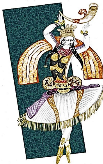
Рис. 10. Цугорка О. Ескіз костюма Зореслави до балету «Володар Борисфену», Київ, 2010

Цікавим є дослідження М. Френкеля, де він описує художника театру як «сценографа» й наголошує, що «сценограф – це автор пластичної режисури вистави, відразу ж доповнивши, що це художник, який оволодіє