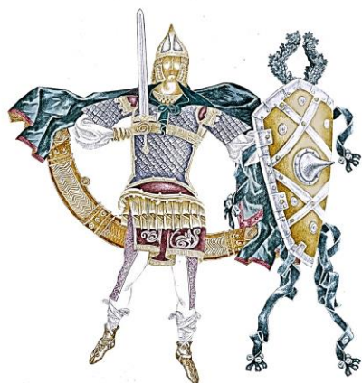
Рис. 12. Цугорка О. Ескіз костюма воїна Полян до балету «Володар Борисфену», Київ, 2010

«Володар Борисфену» – балет-легенда про те, звідки пішла Русь і її народ. Тому декорації до балету «Володар Борисфену» виконують три основні функції: ігрову, позначення місця дії та виявлення характерів персонажів (персонажну функцію), щоб перенести глядача в інший історичний вимір. А глибинна філософія декорацій має безпосередній зв'язок з хореографією постановки та режисерським задумом. Тому, дивлячись виставу, глядач неначе відкриває перед собою завісу часу (рис. 1–12).