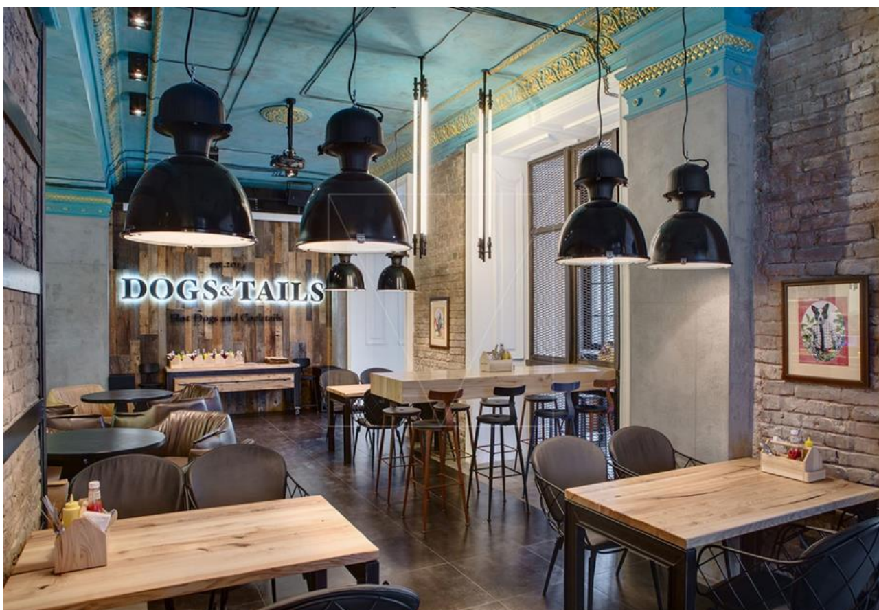
Рис 1.1. Фрагмент інтер'єру головної зали проекту «DOGS&TAILS» у м. Київ

Першим розглянемо бар «DOGS&TAILS» у м. Київ. Автором проекту якого є- Сергій Махно.