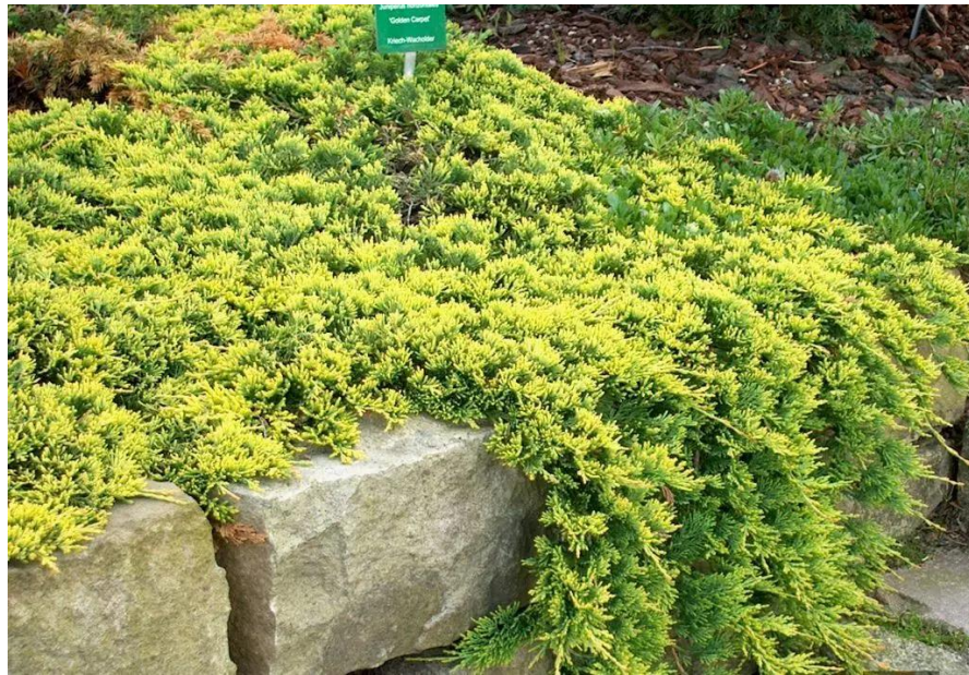
Рис. 3.4. Ялівець горизонтальний Голден Карпет Juniperus Golden Carpet

Далі на задньому фоні розташоване велика каміння, а попереду сосна гірська «Pumilio», після неї зростає дві маленьких, кругленьких та пухнастих сосни гірських «Варелла»