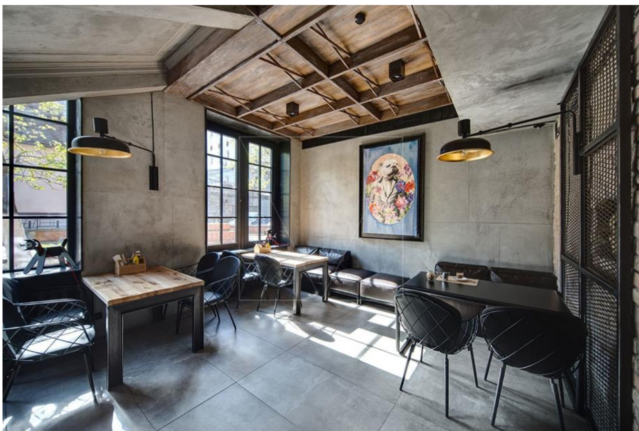
Рис.1.2. Фрагмент інтер'єру другої зали проєкту «DOGS&TAILS» у м. Київ

В основі лежать чорний та різні відтінки коричневого кольорів. Акцентом є стеля з ліпленням блакитного кольору з елементами позолоти. Також контрастом виступають столи та табурети у простому виконанні зі світлої деревини, також чорні розкішні шкіряні крісла та дивани (Рис. 1.2.).