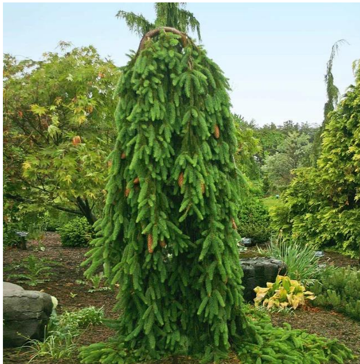
Рис. 3.9. Ялина звичайна Inversa

Ялина звичайна Інверса (на штамбі) — являється прекрасним вибором для ландшафтного дизайну. Вона завдяки своїй незвичайній формі та густій, зеленій хвої є ідеальним вибором для створення головної прикраси в саду. Ялина може використовуватися як частина живої огорожі, та як окремий акцентний елемент в композиції з іншими рослинами. Її набита густота хвої також допоможе затримати вологу в ґрунті, що робить її ідеальною для використання у садах та ландшафтах (Рис.3.9.) [31].