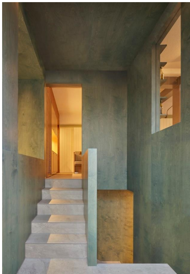
Рис. 1.5. Фрагмент головної зали Рис. 1.6. Перехід з першої зони в підвальну

Цікаве, контрастне поєднання білої текстури на стелі та пофарбованих дерев'яних стін в легкий відтінок зеленого. На стінах, як елемент декору розміщені полички із зеленими пляшками вина на яких класичні білі етикетки, які додають стінам родзинки (Рис.1.7.).