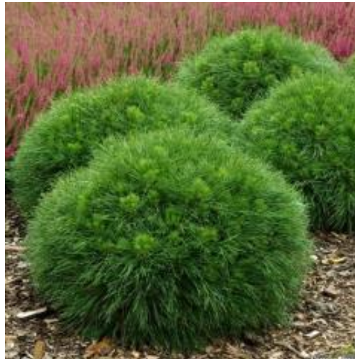
Рис.3.6. Сосна гірська Варелла

Сосна гірська « Варелла»- незвичайна карликова, шаровидна, повільно зростаюча. Вона має дуже щільну крону, густу. У дорослому віці вона може досягти 1-1,4 м. в діаметрі та висоті. Хвоя завжди темно-зелена, незвична довжина розміщена дуже щільно, складаючи вигляд одного цілого. Молоді прирости мають хвою коротшу ніж дорослі, за рахунок цього навколо крони виходить ефект «ореола» (Рис.3.6.) [28].