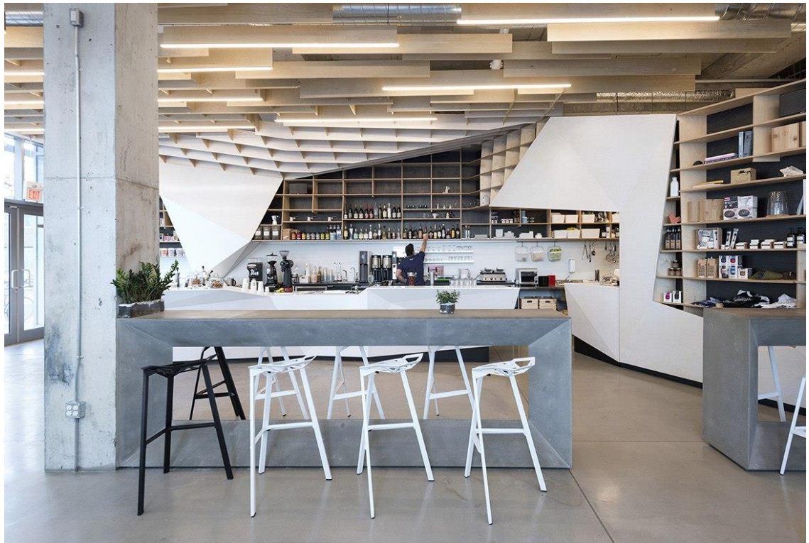
Рис. 1.9. Головна зала (вид з боку)

Цікаве стилістичне вирішення поділу зали, використовуючи колони. Не менш важливу роль тут відіграє освітлення. Завдяки адаптивному освітленню покращуються бажані враження. Тут використовується прохолодне освітлення яке допомагає підсилити сонячне сяйво в першій половині дня та створюючи ніжне атмосферне сяйво вночі (Рис.1.10.).