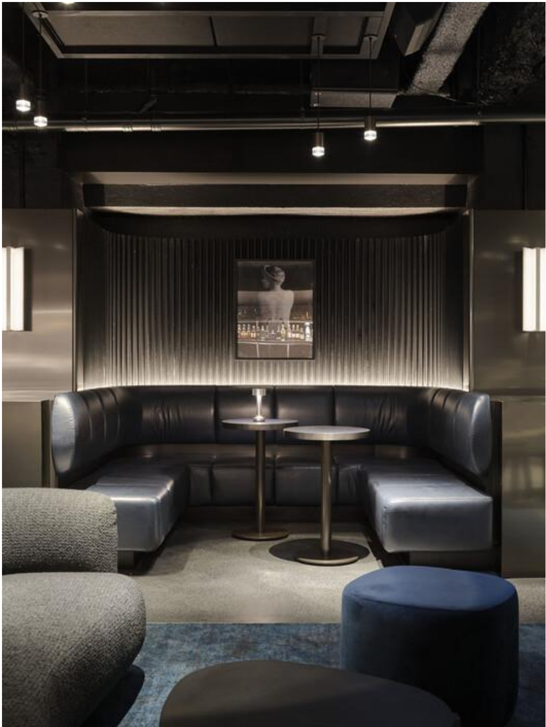
Рис.1.16. Фрагмент зали