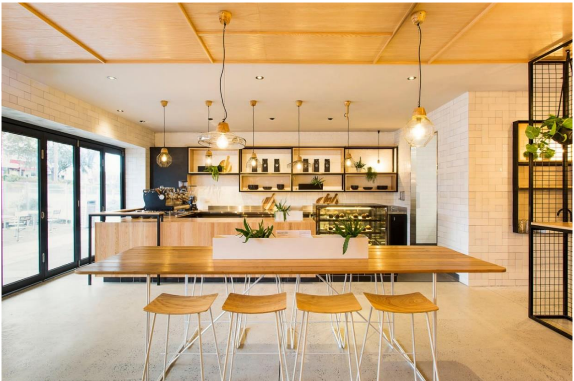
Рис.1.14. Фрагмент зали з розміщенням барної стійки

Яскравим доповненням слугують звисаючі світильники з теплим світлом, що додає максимального комфорту та затишку. Також в якості декору виступили кашпо з ампельними декоративно-листяними рослинами (Рис. 1.14.).