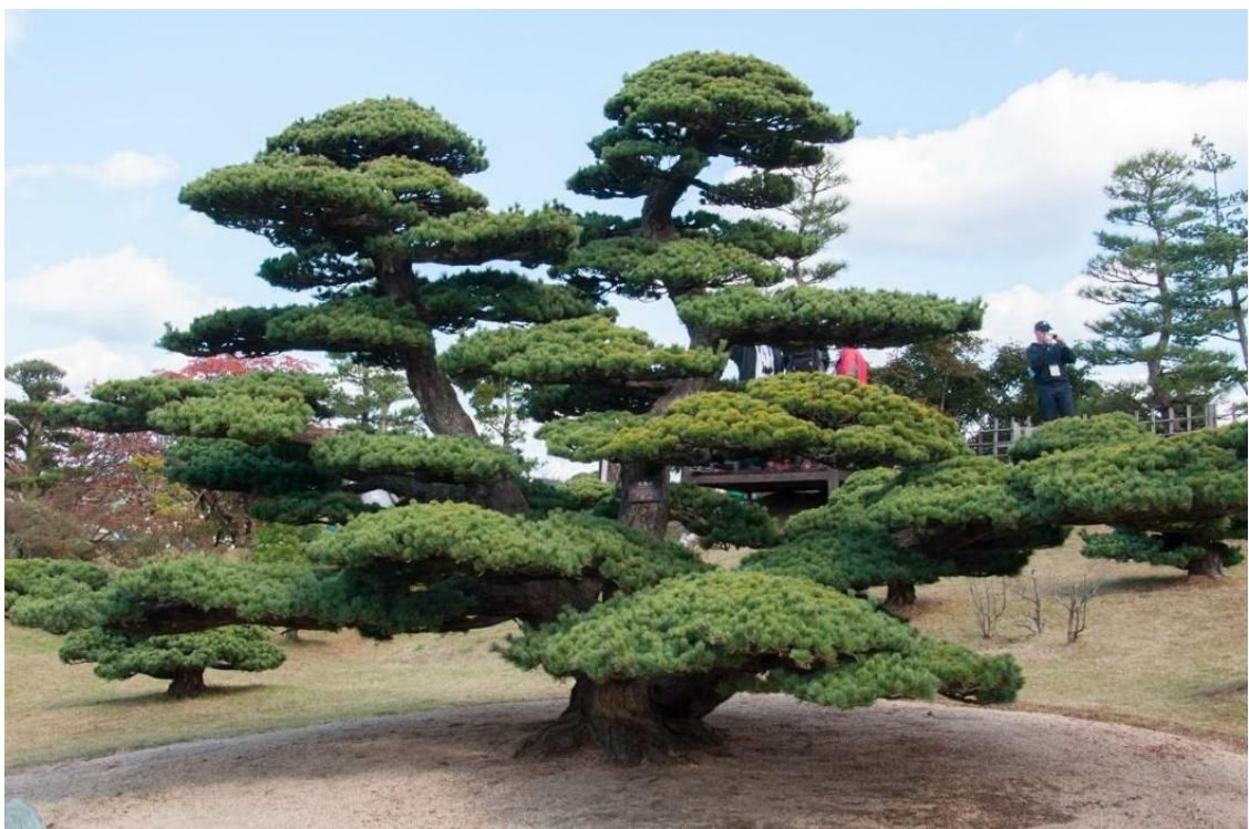
Рис.3.2. Сосна чорна ( Pinus nigra ) формована в нівакі.

Найважливішим акцентом ділянки стане сосна чорна ( Pinus nigra ) формована в нівакі. Вона запам'ятовується своєю оригінальністю та вишуканістю, являючи собою унікальність ландшафтного мистецтва, створюючи дивовижну атмосферу навколо себе. Сосна чорна, вирощена в стилі Нівакі має привабливий незвичний вигляд, підходить для ділянок будь-якого розміру та виду (Рис.3.2.).