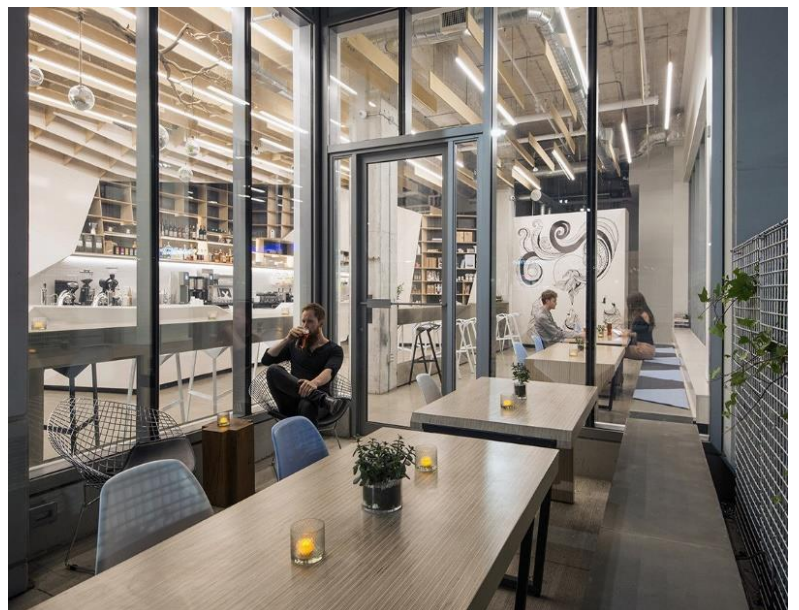
Рис.1.10, рис.1.11. Фрагменти зони з місцями