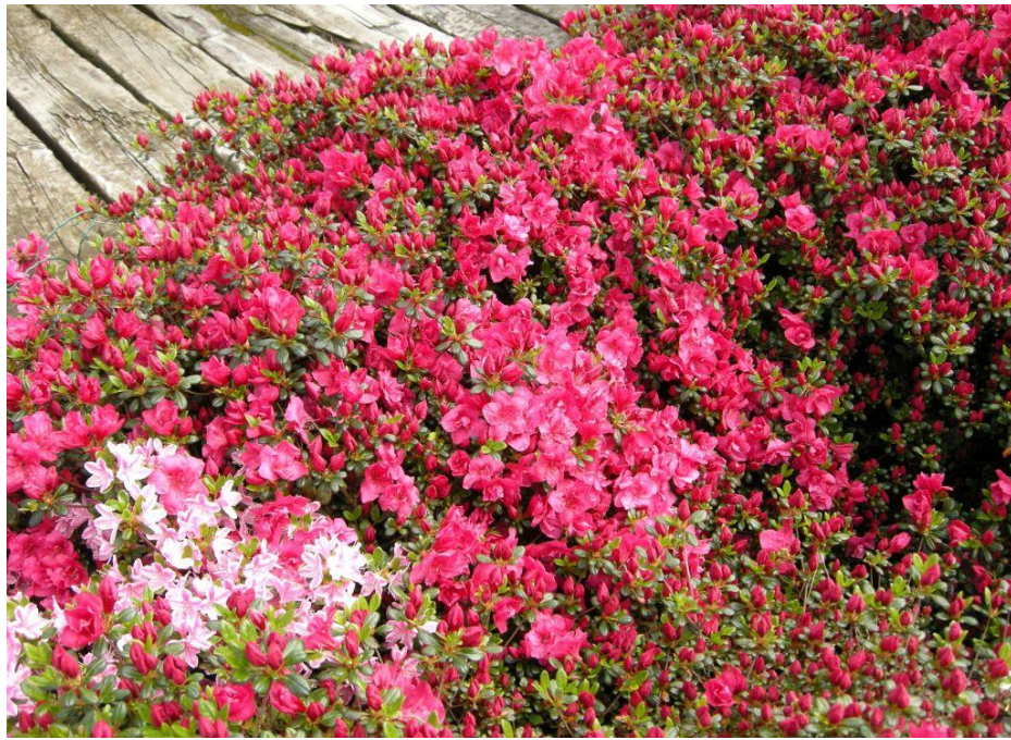
Рис.3.3. Японська азалія «Addy Wery»

На відміну від сосни чорної азалія японська більш примхлива. Вона потребує кислого ґрунту \text{pH} -3,5-4. Але це легко виправити: при посадці потрібно викопати посадкову яму діаметром 50 сантиметрів та глибиною- 40 сантиметрів. Засипати замість викопаної землі спеціальну суміш для азалій з відповідною кислотністю. Азалія любить притінені місця, в цьому їй допоможе сосна, яка буде притіняти її своїми гілками [34].