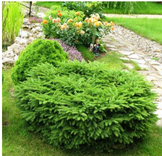
Рис.3.8. Ялина звичайна Нідіформіс (Nidiformis)

Ялина звичайна Nidiformis – це гарний вічнозелений карликовий чагарник незвичайної заокругленої форми (Рис.3.8.).