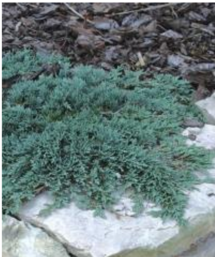
Рис.3.10. Ялівець горизонтальний Айс Блю

Цей ялівець горизонтальний Айс Блю зарубіжні ландшафтні дизайнери часто використовують як крихкий блакитний килим замість газону, який потрібно підживлювати, обробляти, постійно стригти, поливати та випалювати бур'яни. Він добре виглядає у композиціях з хвойними конусоподібними деревами, що ростуть біля нього, зеленого і золотистого забарвлення [32].