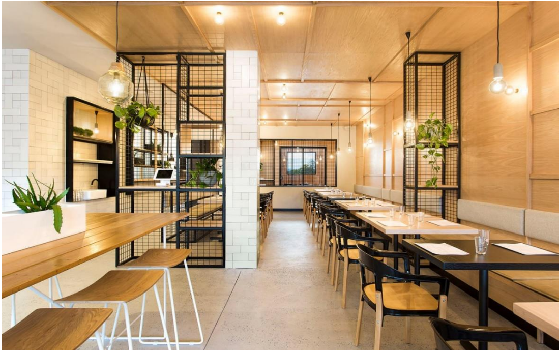
Рис. 1.11. Головна зала

Ще один з цікавих аналогів — це ресторан-кав'ярня « Hutch & Co», вона знаходиться в м. Лілідейл, Австралія. Розроблена архітектором Біасол(Рис. 1.11.) [19].