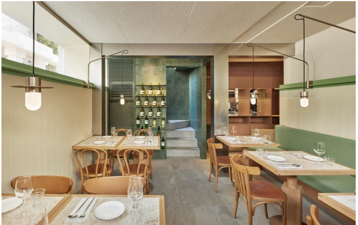
Рис. 1.7. Зала першого поверху

Все це доповнено оригінальними світильниками, які розмістили на молдингу. Створюється динамічна картинка простору, поєднуючи контрастні тони зелених, білих та теракотових стін в поєднанні з теплими тонами деревини меблів. Також дизайну надає завершеності теплий тон світла.