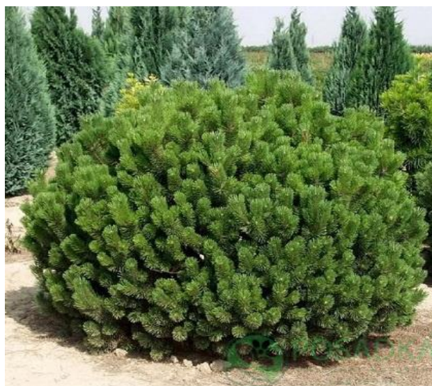
Рис. 3.5. Сосна горная Pumilio

Сосна гірська «Pumilio»- приваблива, низька, має овальну форму, вважається однією з кращих сортів для озеленення міської та промислової території. Має малі щорічні прирости, які не перевищують 10 см. в рік. В дорослому віці може сягати 1м. у висоту та 2 в ширину. Вона невибаглива, любить світлі ділянки та добре почуває себе навіть в тіні(Рис.3.5.) [27].