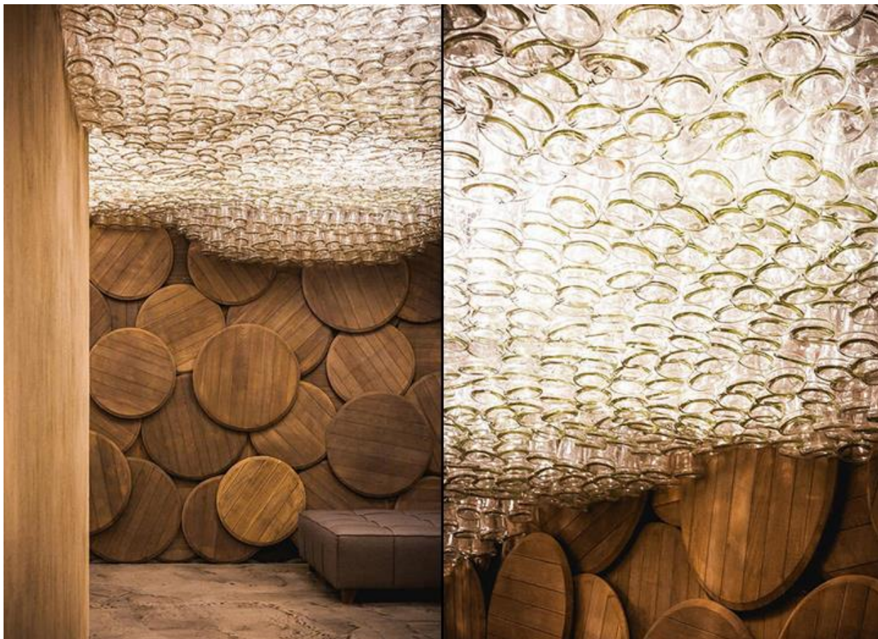
Рис. 1.4. Фрагмент інтер'єру другої зали

Завдяки цьому передається справжнє відчуття тієї атмосфери.