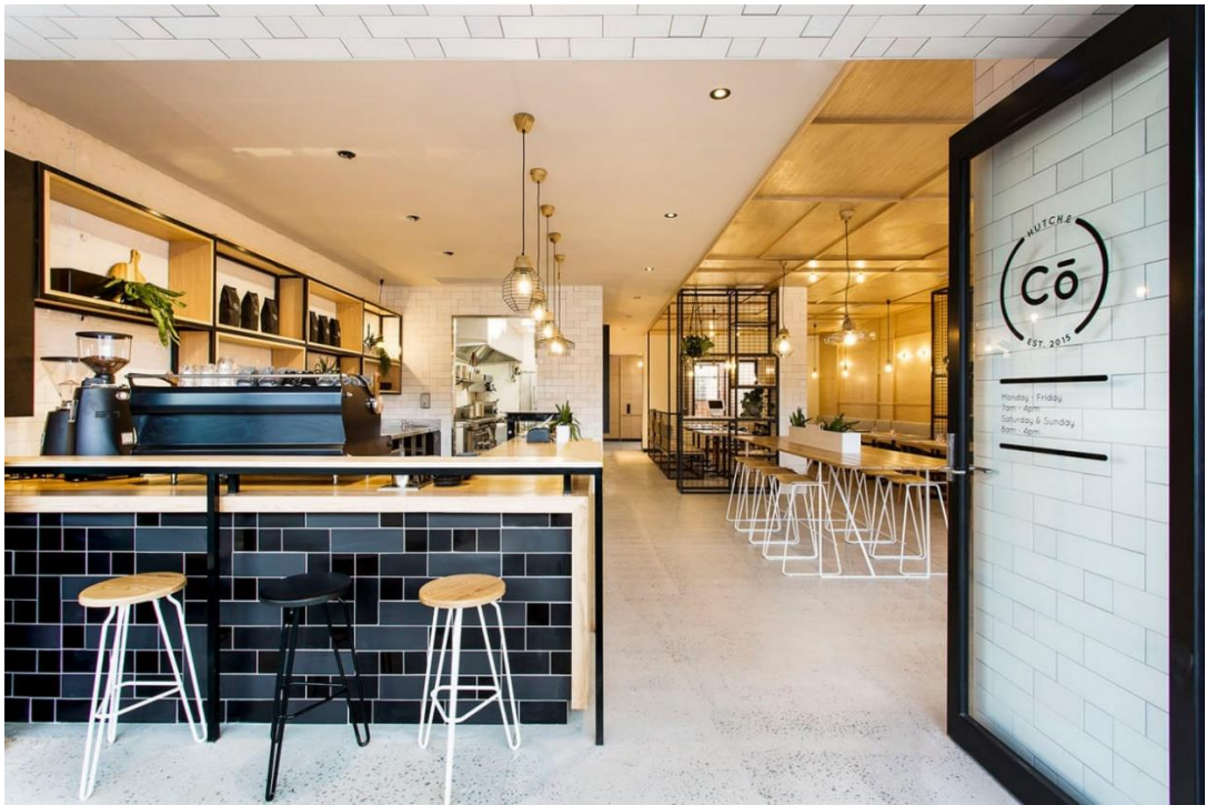
Рис.1.13. Вигляд кафе з входу

Яскравим доповненням слугують звисаючі світильники з теплим світлом, що додає максимального комфорту та затишку. Також в якості декору виступили кашпо з ампельними декоративно-листяними рослинами (Рис. 1.14.).