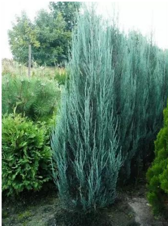
Рис.3.1. Ялівець скельний Blue Arrow

Блакитний ялівець Блю Ерроу- один з найпопулярніших різновидів вічнозелених рослин. Він має колоно видну, вузьку, щільну крону. Може сягати 4-5 метрів заввишки та 1 метр в діаметрі. Його перевагою є яскравий блакитний колір, висока морозостійкість. Він не вибагливий та добре переносить стрижку. Має середню швидкість зростання. Весняна стрижка сприяє гарному загущенню крони. Але стрижуться тільки листяні частини гілки, а не оголена деревина. Полюбляє рости на сонечку та добре переносить затінок(Рис.3.1.) [33].