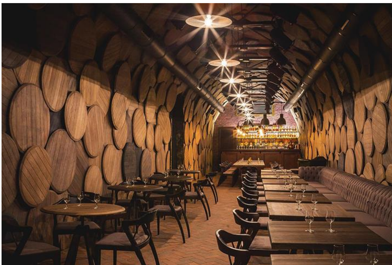
Рис. 1.3. Фрагмент головної зали

Дизайн інтер'єру імітує форму дубової діжки, приміщення має продовгувату форму та оздоблене натуральною дубовою деревиною. Стеля й стіни повністю прикрашені начебто справжніми кришками від дубових діжок [16].