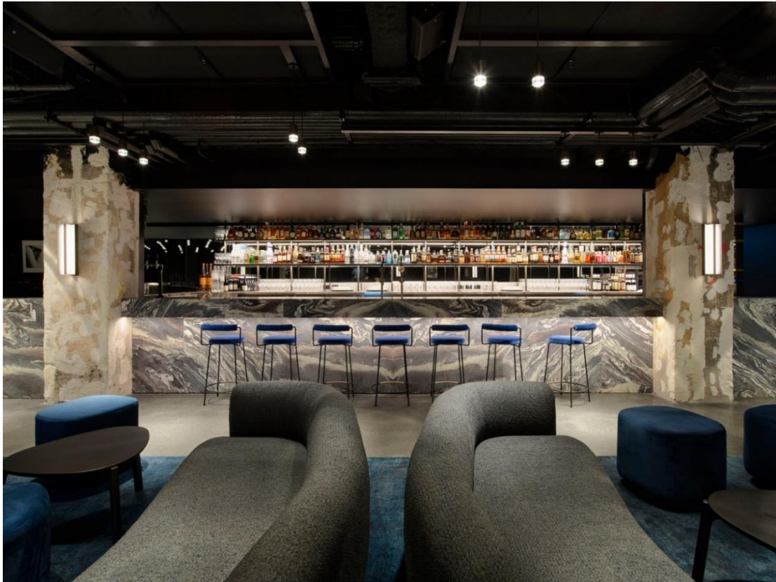
Рис. 1.15. Зала з видом на барну стійку

Розглянемо наступний аналог – ресторан-бар «Charles Grand Brasserie», м. Сідней, Австралія. Архітектори: COX Architecture , Н&Е Architects [21] Відрізняється своєю елегантністю та пишністю (Рис.1.15.).