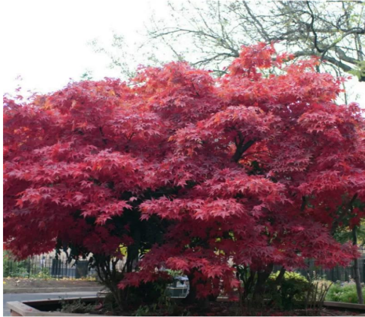
Рис.3.7. Клен японський червоний 'Atropurpureum'

Умови вирощування: теплолюбний, витримує морози до -15 С. Вимагає родючого гумусного, свіжого, з гарним дренажем ґрунту. Використання в ландшафтному дизайні: Рекомендується в одиночних і групових посадках. Добре витримує умови міста.[29]