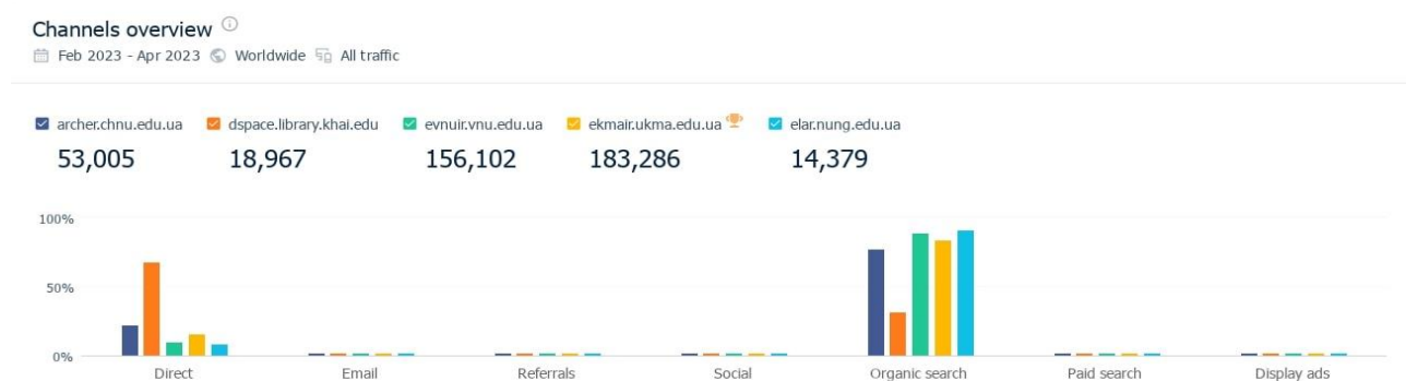
Рис. 4. Канали, що генерують трафік до сайтів репозитаріїв ЧВУ, ХАІ, ВНУ, КМА, ІФНТУНГ

Згідно із цими графіками основними каналами для використання сайтів репозитаріїв є такі: