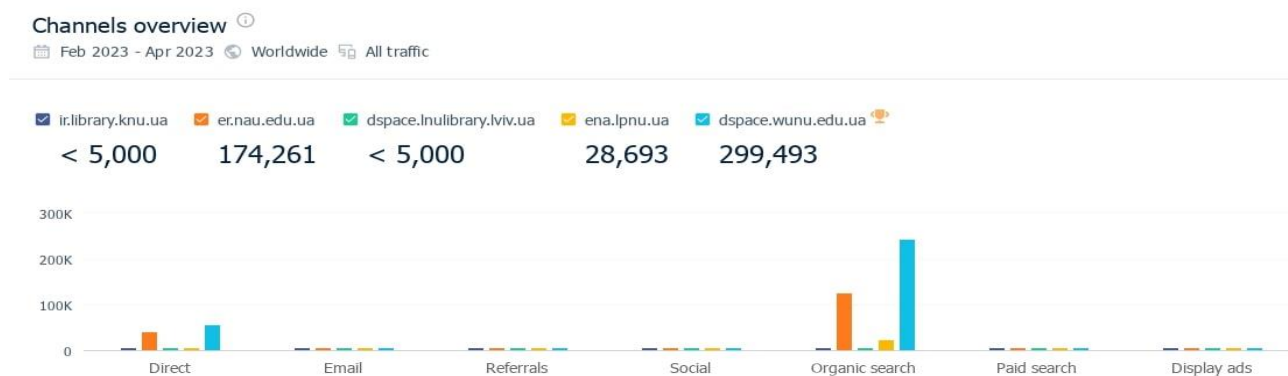
Рис. 3. Канали, що генерують трафік до сайтів репозитаріїв КНУ, НАУ, ЛНУ, ЛНУ ЛП, ЗУНУ

генерують трафік до сайтів репозитаріїв аналізованих ЗВО, що представлена на рис. 3 і 4 : direct (прямий: трафік від користувачів, які безпосередньо вводять URL-адресу, використовують закладку чи збережене посилання тощо); email (електронна пошта: трафік, надісланий з електронної пошти вебклієнтів, таких як gmail.com); referrals (реферали, що включають трафік, який надходить на сайт через афілійованих осіб, посилання, контент-партнерів, трафік від висвітлення новин тощо); social (соціальні: трафік, надісланий із сайтів соціальних мереж, наприклад Facebook); organic search (звичайний пошук, на результати якого не впливає платна реклама); paid search (оплачений пошук, тобто результати пошуку системи, від платної реклами про бренд або орієнтацію на релевантну аудиторію для конкретних продуктів); display ads (медійні оголошення: трафік, надісланий з інших доменів через відому рекламну платформу).