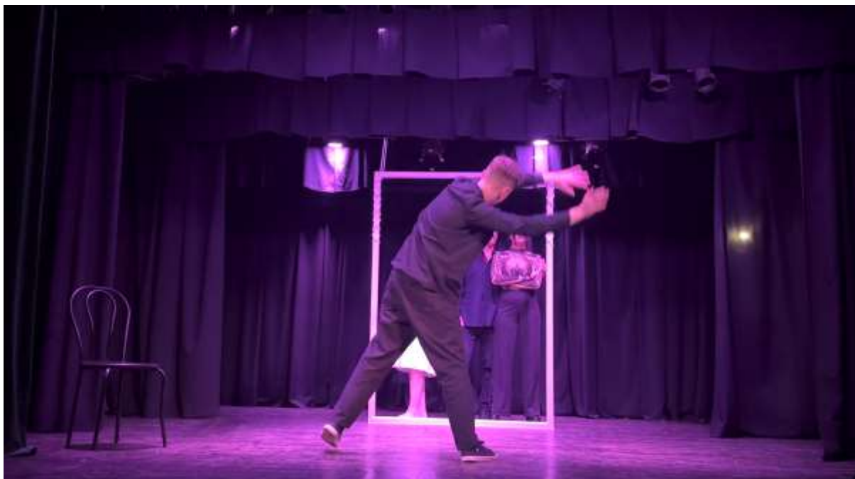
IV епізод. «Сліпе кохання»