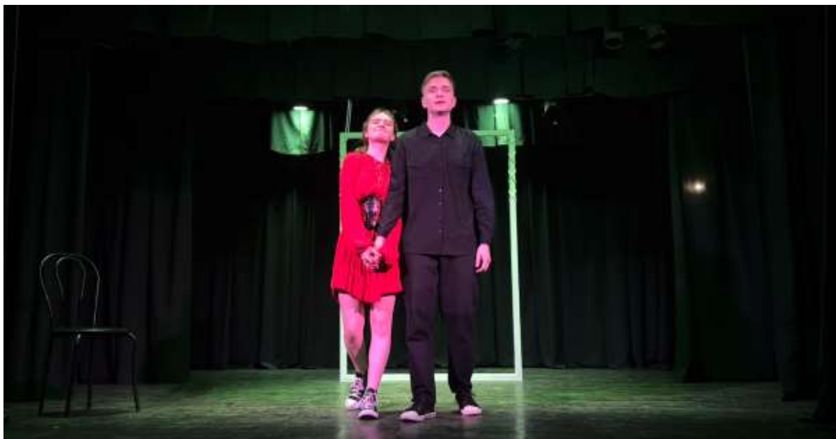
У епізод. «Фінал»