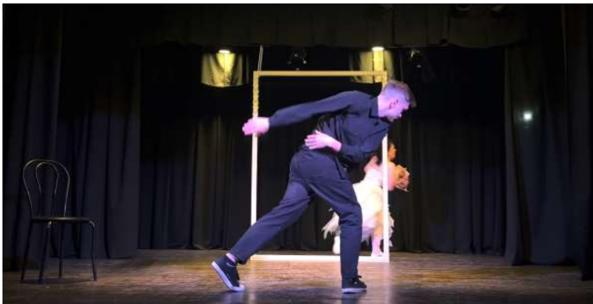
III епізод. «Почуття на трьох»