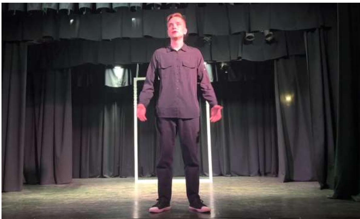
II епізод. «Сповідь нещасної»