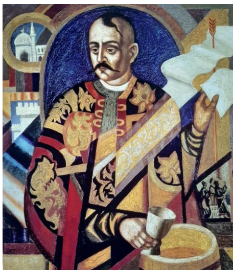
Рис. 4. «Байда Вишневецький», 1991

Основними творами на історичну тематику є відомі картини митця: «Вірність Україні» (1972), «Гетьман Дорошенко» (1975), «Гонта і Залізняк» (1976), «Гайдамаки» (1979), «Гетсиманська молитва» (1981), «Маруся Чурай» (1986), «Портрет гетьмана Сагайдачного» (1991), «Кобзар Вересай» (1994), «Мазепа і Карл XII» (1995), «Галшка Гулевичівна» (1997).