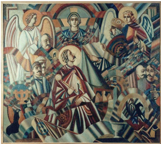
Рис. 3. «Посвячення в гетьмани»

НАОМА. Ф. Гуменюк є активним учасником як персональних, так і групових виставок у різних країнах світу, які відбулися, зокрема, в Торонто, Вінніпегу, Оттаві, Гамільтоні (Канада), Нью-Йорку (США), Духцові (Чехословаччина), Єревані (Вірменія), Баку (Азербайджан), Парижі (Франція) [4]. У 1988 році виставку Ф. Гуменюка експонували в залах Національного архіву Канади в Оттаві, в Українському музеї в Нью-Йорку. Там же, познайомившись з місцевою українською інтелігенцією, художник зміг ближче побачити життя діаспори та зафіксувати її на полотні. «Великдень у Торонто» — одна з композицій «канадського» періоду. Пізніше була участь у виставці робіт українських художників в Гранд-Пале, у Парижі; персональна виставка у Національному художньому музеї в Києві, де була представлена ціла галерея гетьманів, і присудження в 1993 році Національної премії імені Тараса Шевченка в галузі образотворчого мистецтва [14].