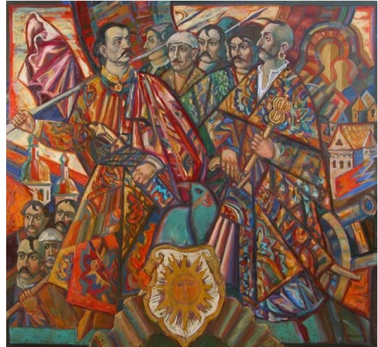
Рис. 5. «Гонта і Залізняк»

Основними творами на історичну тематику є відомі картини митця: «Вірність Україні» (1972), «Гетьман Дорошенко» (1975), «Гонта і Залізняк» (1976), «Гайдамаки» (1979), «Гетсиманська молитва» (1981), «Маруся Чурай» (1986), «Портрет гетьмана Сагайдачного» (1991), «Кобзар Вересай» (1994), «Мазепа і Карл XII» (1995), «Галшка Гулевичівна» (1997).