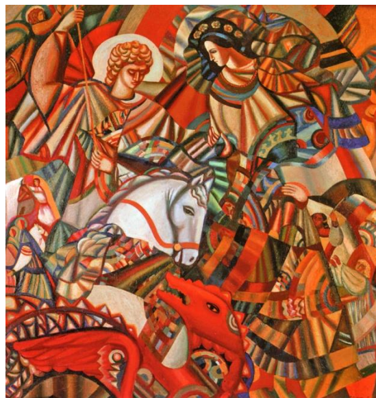
Рис. 1. «Змієборець (Святий Юрій)», 1978, н.о.

висушеній рибині, яке було оберегом чумаків під час походів. До 200-ліття Т. Шевченка (2014 р.) він створив понад 40 ілюстрацій до «Кобзаря».