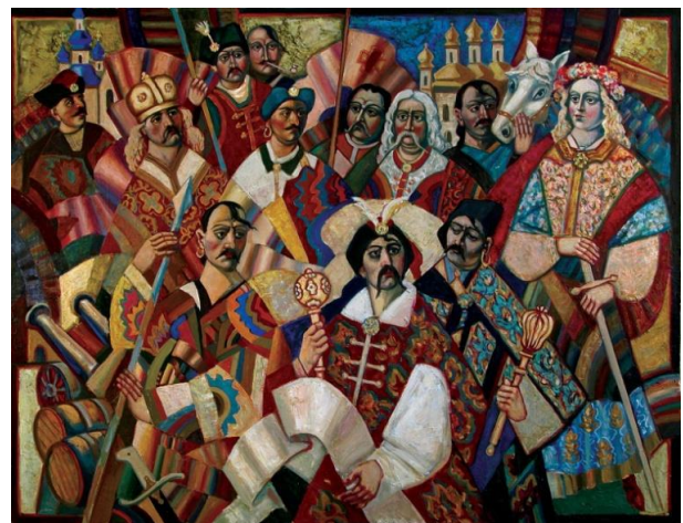
Рис. 6 «Ще покрийть Україну червоні жупани», 1991

Полотна Ф.Гуменюка складно сплутати з іншими, - в його картинах вдало сполучаються традиційна українська символіка та сучасні засади малярства, а поєднання традицій та авангардних віянь надають його творам особливої самобутності.