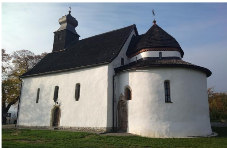
Рис. 1. Горянська ротонда (церква Святої Анни)

В Україні, зокрема в Горянах, вперше зустрічаємося з сюжетом «Дари волхвів» у тій трактовці, яка згодом твердо увійде в українське мистецтво. До Марії, яка невимушено сидить з дитиною на руках, підносять дари. Хлопчик з чисто дитячою безпосередністю одною ручкою ухопився за руку матері, а другу простягнув до дарів. Хоч одяг й зображений без світлотіньової ліпки, рисунок правдиво пов'язаний з позами, з поворотами і жестами фігур. Загальний колорит фресок, завдяки тонкій гармонії білих, вохристо-рожевих, золотистих, сіро-зелених та сіро-синіх Тонів, напрочуд гарний.