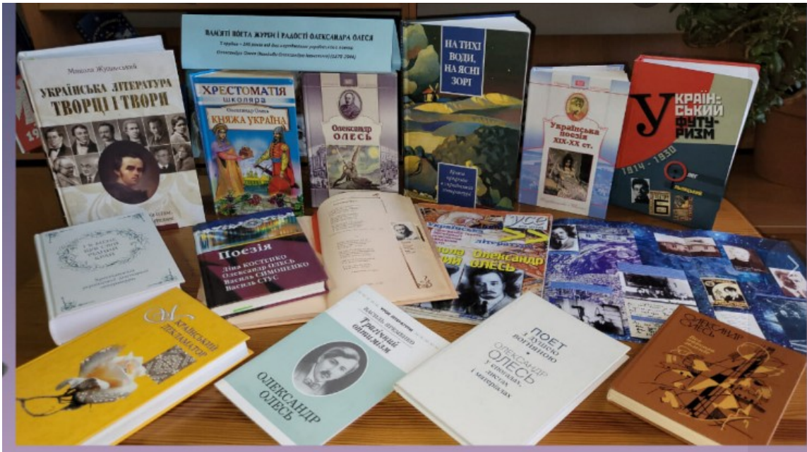
Рис. А. 3. Виставка до 145-риччя з дня народження Олександра Олесь. Вінницька обласна бібліотека для юнацтва. URL : https://www.facebook.com/photo.php? fbid=749746793858497&set=pb.100064695488558.-2207520000&type=3