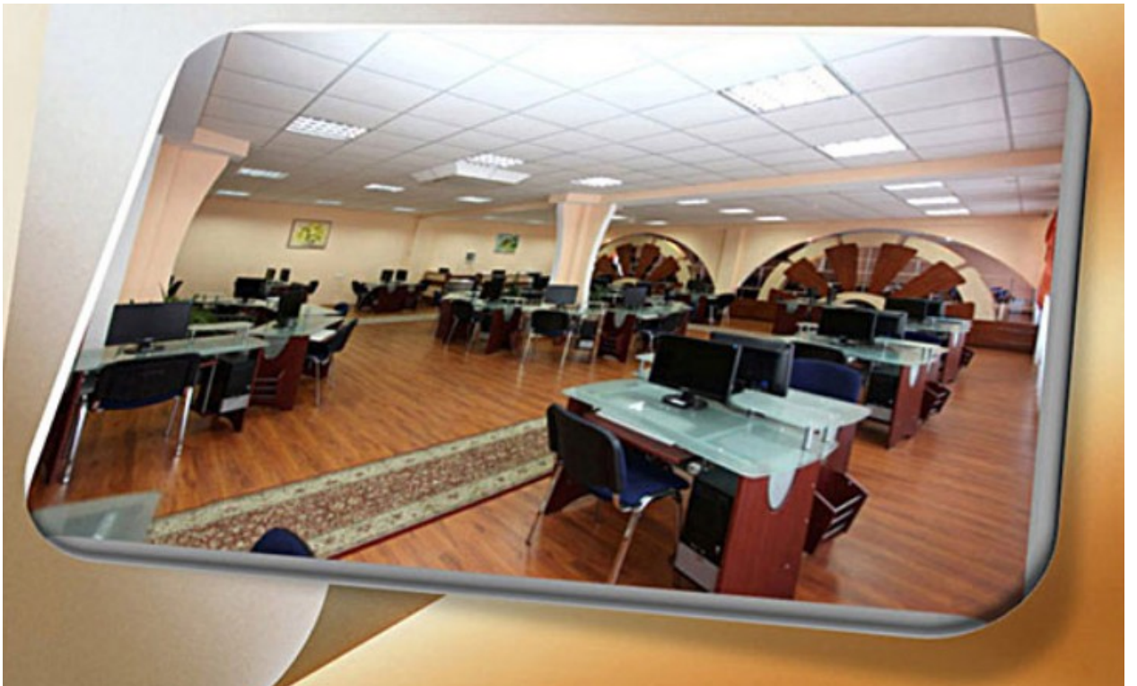
Рис. А.5. Простір бібліотеки Вінницького державного педагогічного університету імені Михайла Коцюбинського. URL : https://library.vspu.edu.ua/html/ist.htm