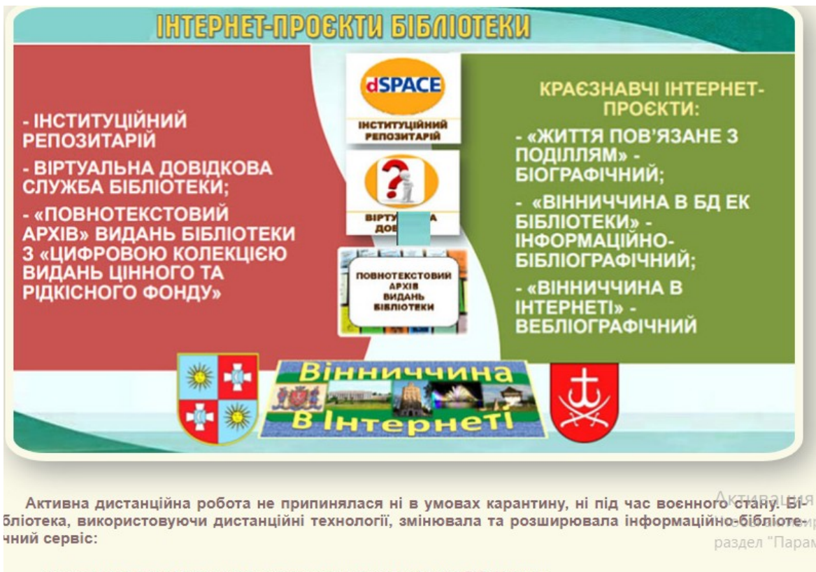
Рис. А.4. Інтернет-проекти бібліотеки Вінницького державного педагогічного університету імені Михайла Коцюбинського. URL : https://library.vspu.edu.ua/html/ist.htm