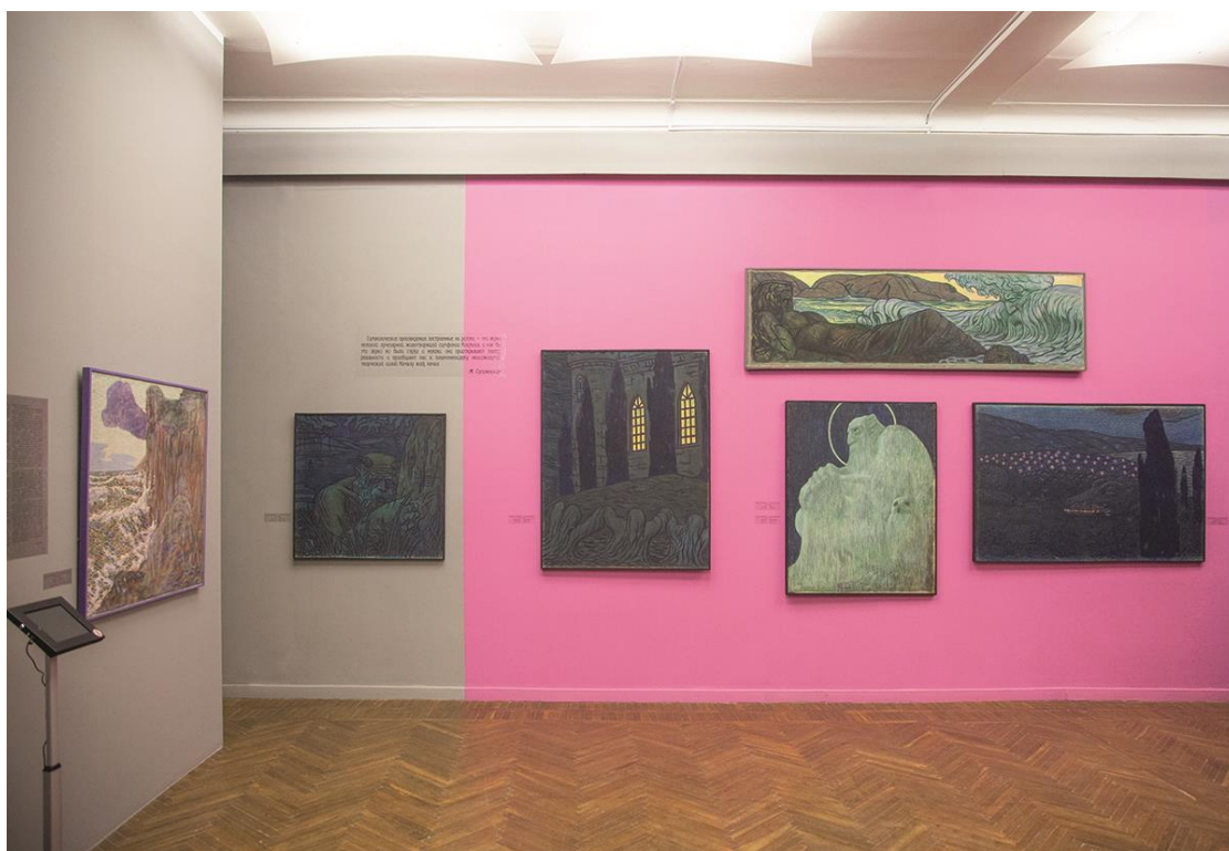
Рис. 6. Дніпровський художній музей. Зала основної експозиції №4 «Модерн. Авангард. Символізм» (тематичний кейс «Мистецтво символізму. Світ символів Михайла Сапожникова»)