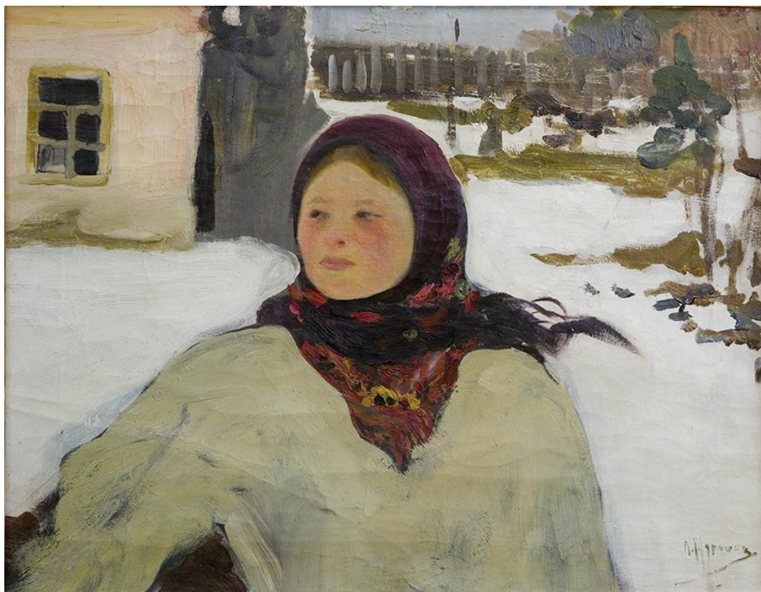
Рис. 3. Олександр Мурашко (1875–1919) Дівчина. Близько 1906 р. Полотно, олія, 64×82 см Збірка Дніпровського художнього музею