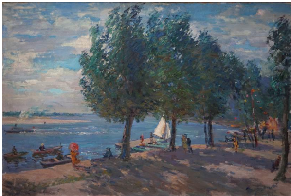
Рис. 4. М. П. Глущенко. «Пристань на Дніпрі». 1944. Полотно, олія, 73×91 см Колекція Дніпровського художнього музею

творчих поїздках Україною [7, 19–21]. Живописні полотна набувають виразного, яскравого колориту, а манера письма стає розкутішою. Візуальним прикладом може слугувати робота «Пристань на Дніпрі» Ж-794, 1944 (полотно, олія, 73×91 см) (рис. 4).