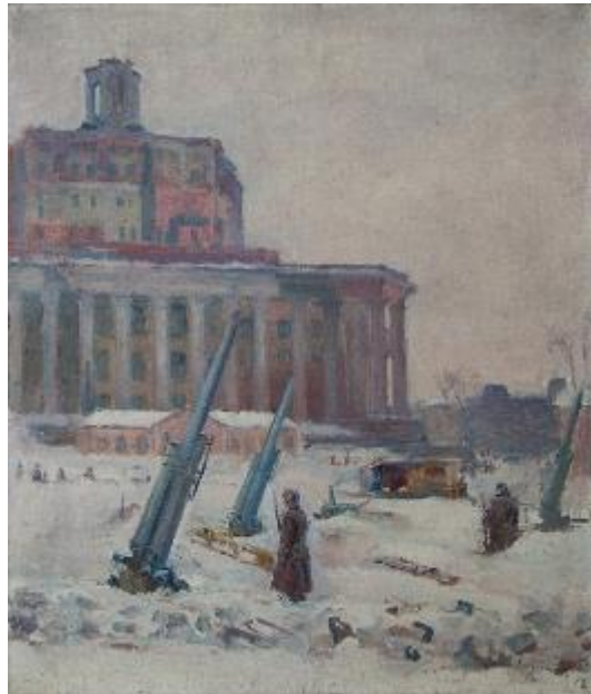
Рис. 3. М. П. Глуценко. «Зенітки біля ЦБЧА». 1942. Полотно, олія, 64,5×54,5 см Колекція Дніпровського художнього музею

Московський воєнний період. М. П. Глуценко – один з найактивніших учасників виставок, присвячених боротьбі із фашистськими загарбниками [6, 174], він активно працює над тематичними композиціями [7, 11]. У зібранні Дніпровського художнього музею міститься живописна робота «Зенітки біля ЦБЧА» НДФ-702, 1942 (полотно, олія, 64,5×54,5 см) (рис. 3). Для періоду характерні поєднання історичного й побутового воєнного тла, економність колористичної гами – приглушені кольори та тони, невігядлива об'ємно-просторова композицію перших планів на тлі класичного пейзажу.