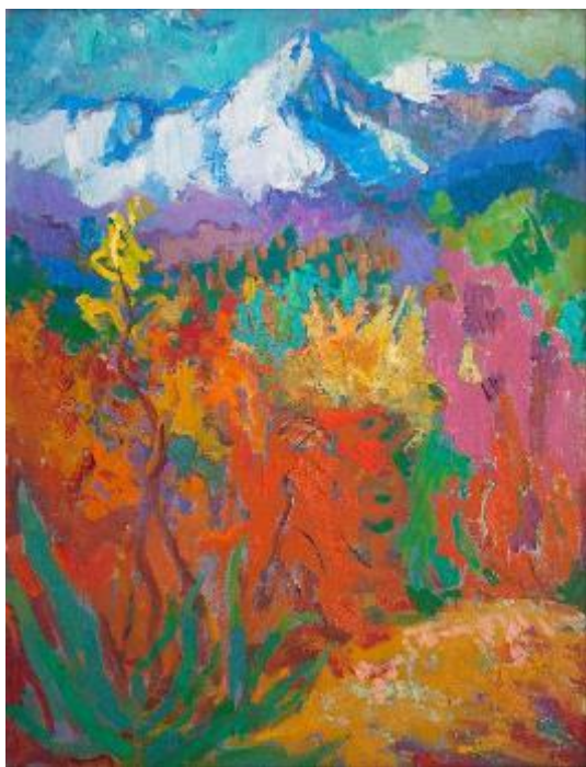
Рис. 1. М. П. Глуценко. «Осінь у розпалі». 1965 (?). Полотно, олія, 90×70 см Колекція Дніпровського художнього музею