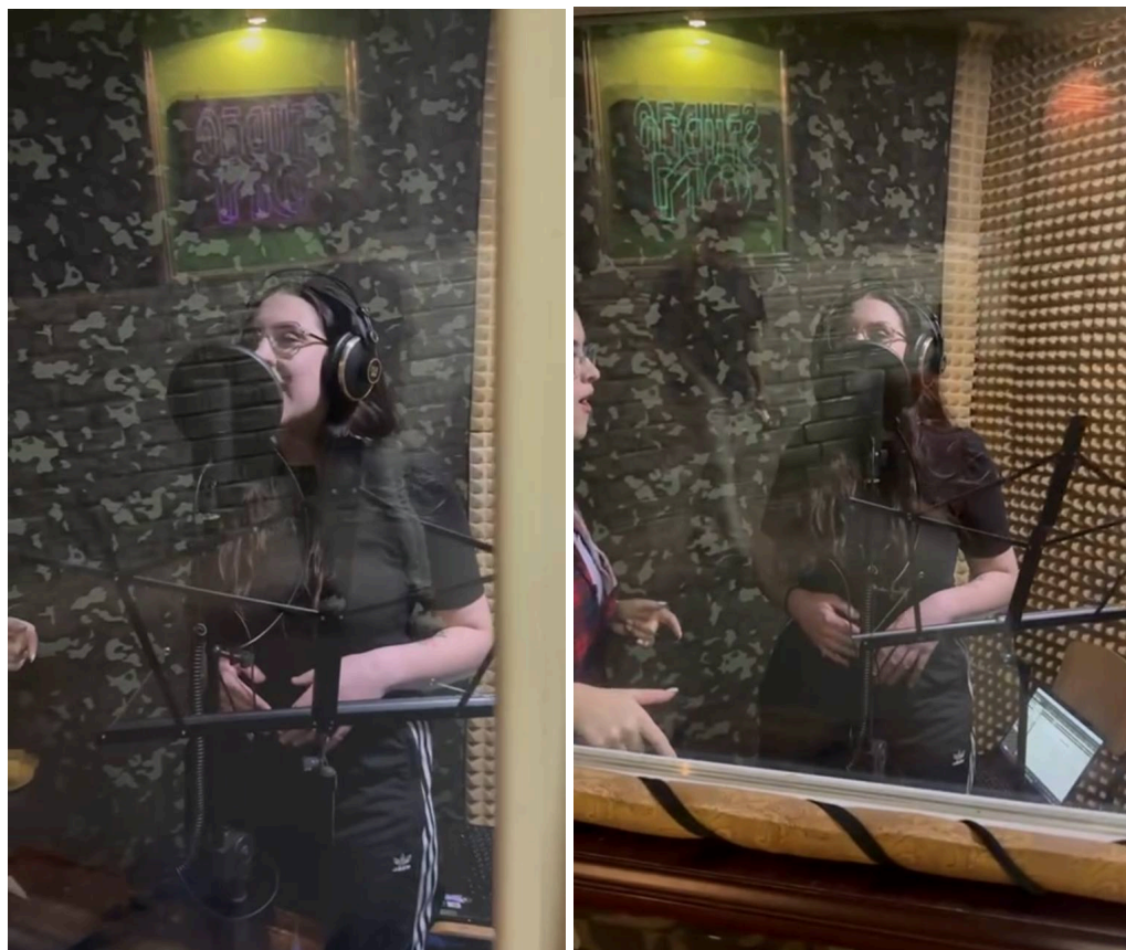
Додаток 1. Фотографії зі студії звукозапису, де відбувся запис пісні для вистави