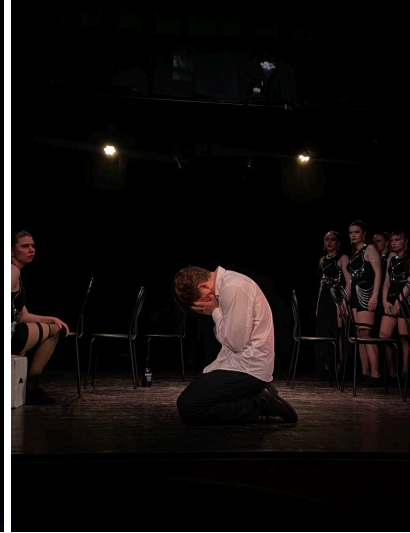
Додаток 2. Фотографії з передпоказу вистави