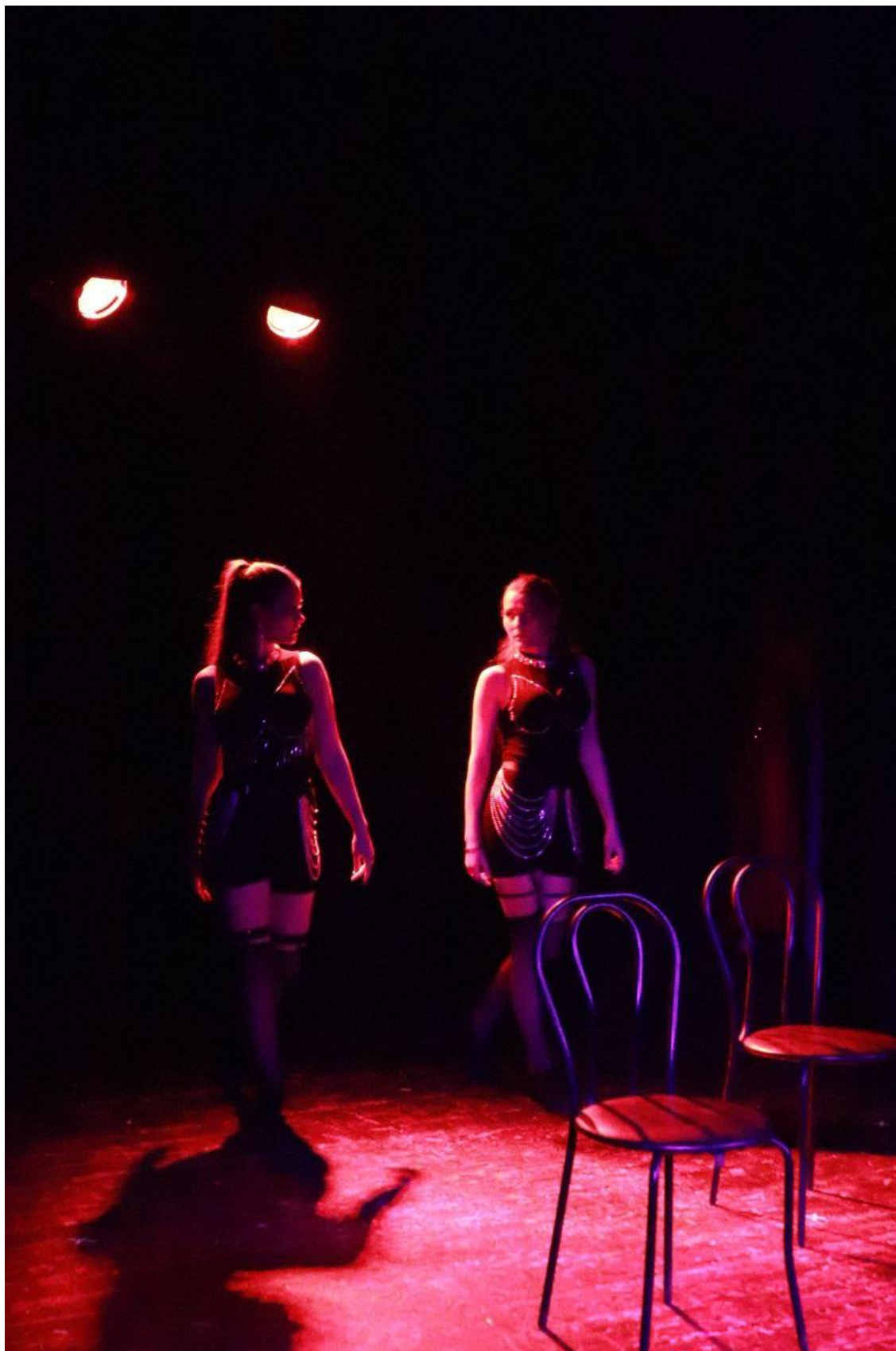
Фото Грети з виступу.