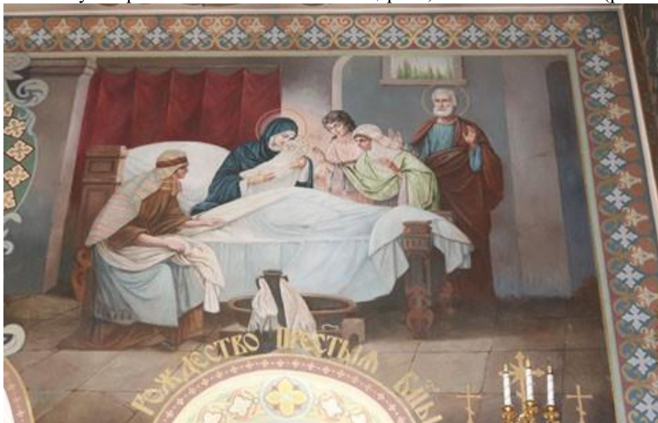
Рис. 2. О. Боровик і художники. Різдво Пресвятої Богородиці. Розписи церкви на честь ікони Божої Матері «Живоносне джерело». Початок 2000-х. Олія. 2021. Публікується вперше

НЗКПЛ [4]. Звертаючись до них, бачимо схожість композиційної побудови сцени «Різдво Пресвятої Богородиці» (рис. 2), написаній перед іконостасом на західній стіні церкви, та ікони Г. Попова (рис. 3) [5].