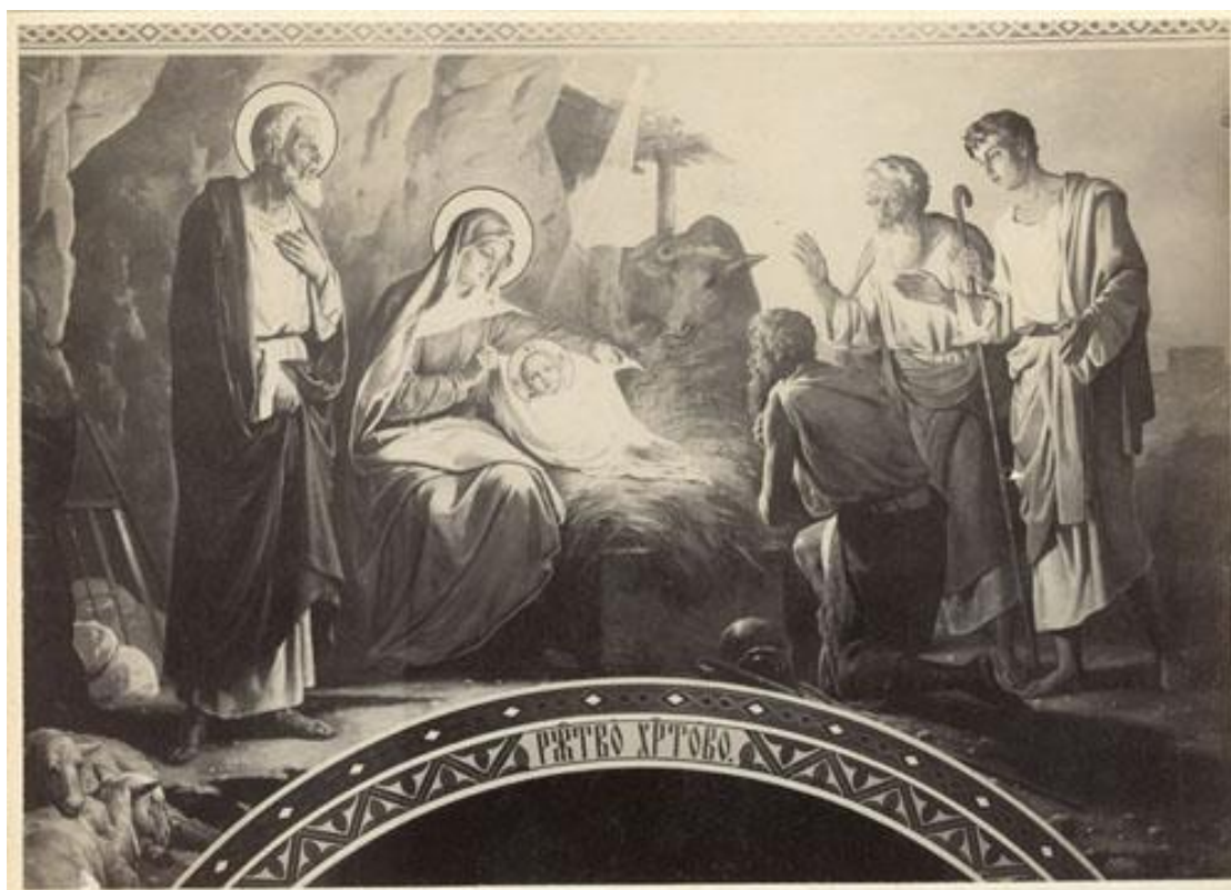
Рис. 6. В. П. Верещагін і художники. Різдво Христове. Розписи Великої церкви (Успенського собору). 1897–1901. Олія. Фото початку ХХ ст. Публікується вперше