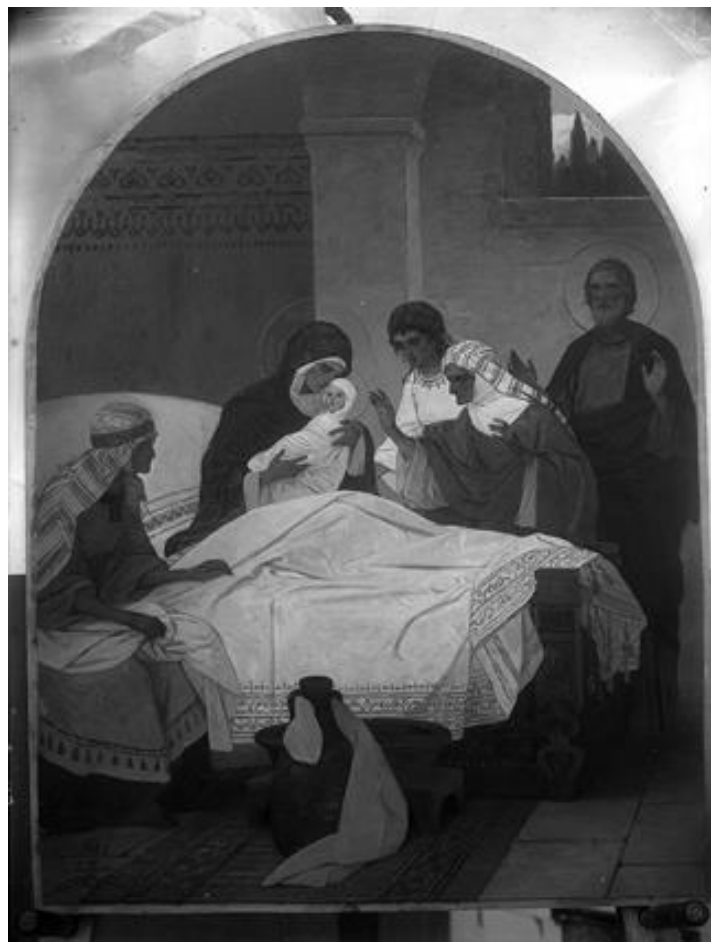
Рис. 3. Г. Попов. Різдво Пресвятої Богородиці. Ікона іконостаса церкви Преподобних Антонія і Феодосія Печерських з Трапезною палатою. 1907–1908. Мідь, олія. Негатив початку ХХ ст.