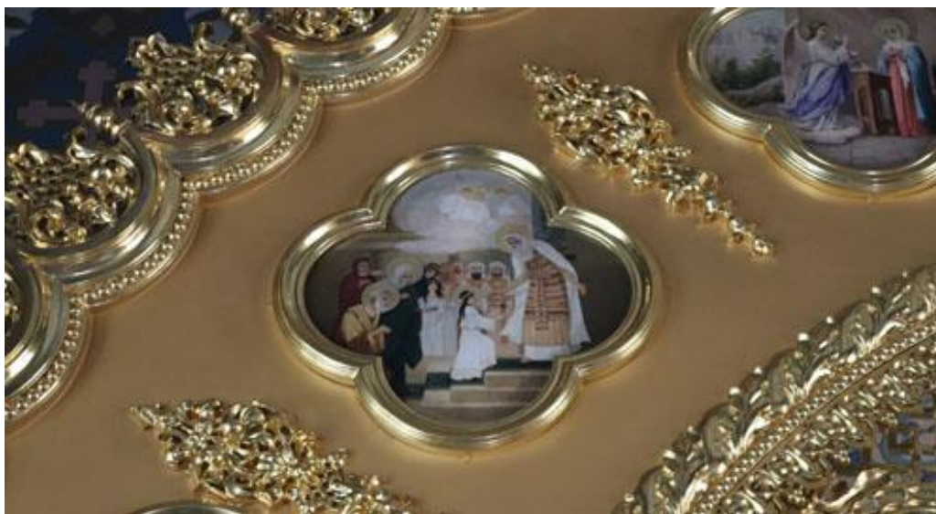
Рис. 4. Введення у храм Пресвятої Богородиці. Празниковий ряд іконостаса церкви на честь ікони Божої Матері «Живоносне джерело». 2021. Публікується вперше

Ікони вплинули на стінопис церкви Божої Матері «Живоносне Джерело», але не іконою єдиною... Художники звертались і до храмових розписів Лаври, у чому їм допомогли архівні фото, збережені музейниками. Так, композиція «Різдво Христове», написана В. П. Верещагіним у Великій Успенській церкві Лаври (рис. 6), архівне фото якої з колекції НЗКПЛ вводимо в науковий обіг [11], слугувала взірцем для живописців (рис. 7).