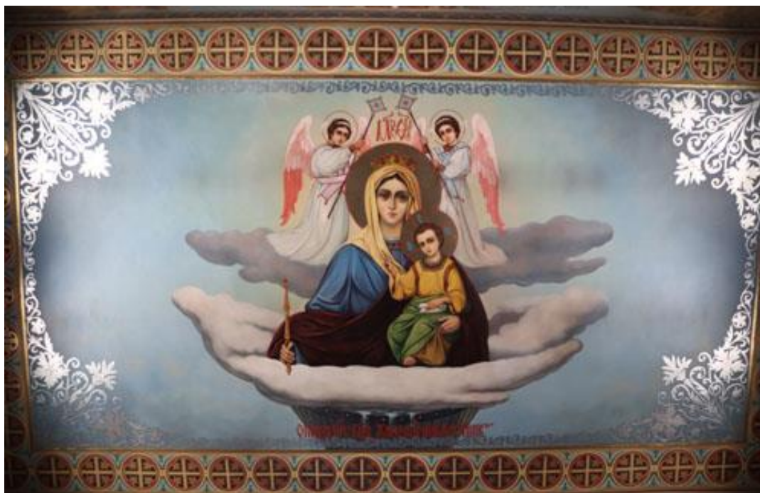
Рис. 1. О. Боровик і художники. Божя Матір «Живоносне Джерело». Розписи церкви на честь ікони Божої Матері «Живоносне джерело». Початок 2000-х. Олія. 2021. Публікується вперше

По-друге, ікону як таку митці використали як художнє першоджерело в цьому храмі. Аналогії відомих православних ікон, зокрема лаврських, були покладені художниками в основу настінних композицій. Так, на південній стіні написана в монументальному розмірі ікона «Собор всіх преподобних отців Печерських», на якій за традицією зображено Велику церкву, а над нею – двох ангелів з чудотворною іконою «Успіння Богородиці». «Собор всіх преподобних отців Печерських» протягом століть втілювався в іконописі, гравюрі, стінописі, його присутність у храмі розкриває тему сакрального значення Печерського монастиря – одного із земних уділів Цариці Небесної.