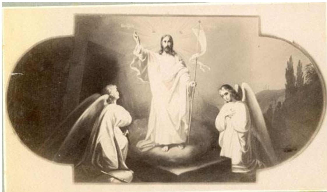
Рис. 8. Моління про чашу. Воскресіння Христове. Фото початку XX ст. Публікується вперше