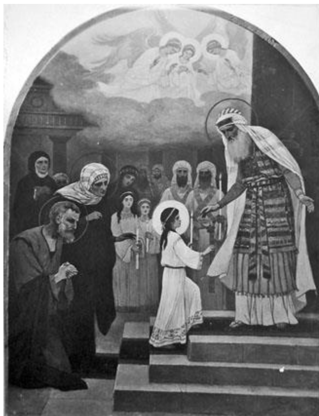
Рис. 5. Г. Попов. Введення у храм Пресвятої Богородиці. Ікона іконостаса церкви Преподобних Антонія і Феодосія Печерських з Трапезною палатою. 1907–1908. Мідь, олія. Негатив початку ХХ ст.