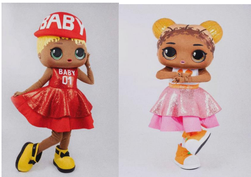
Костюми ляльок Лол: