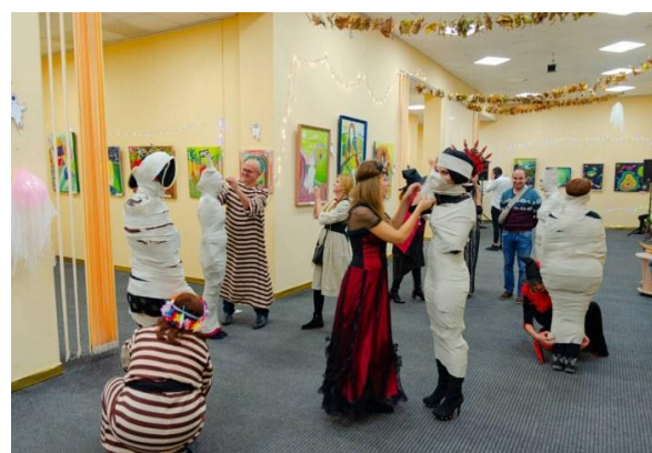
Молодіжний народний театр «С.Т.У.К.»