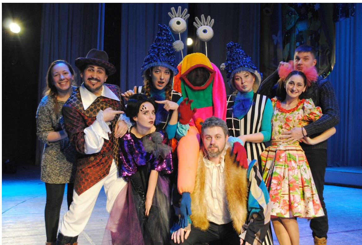
Новорічна вистава театру «Парадокс» на сцені обласного палацу культури