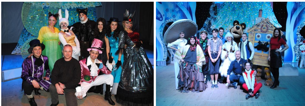
Новорічні вистави театру «Парадокс»