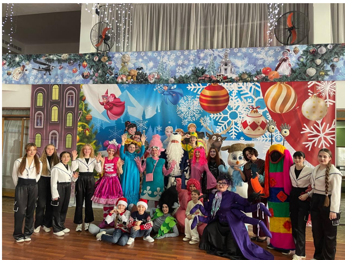
Професійна самореалізація фахівців зі сценічного мистецтва Миколаївщини