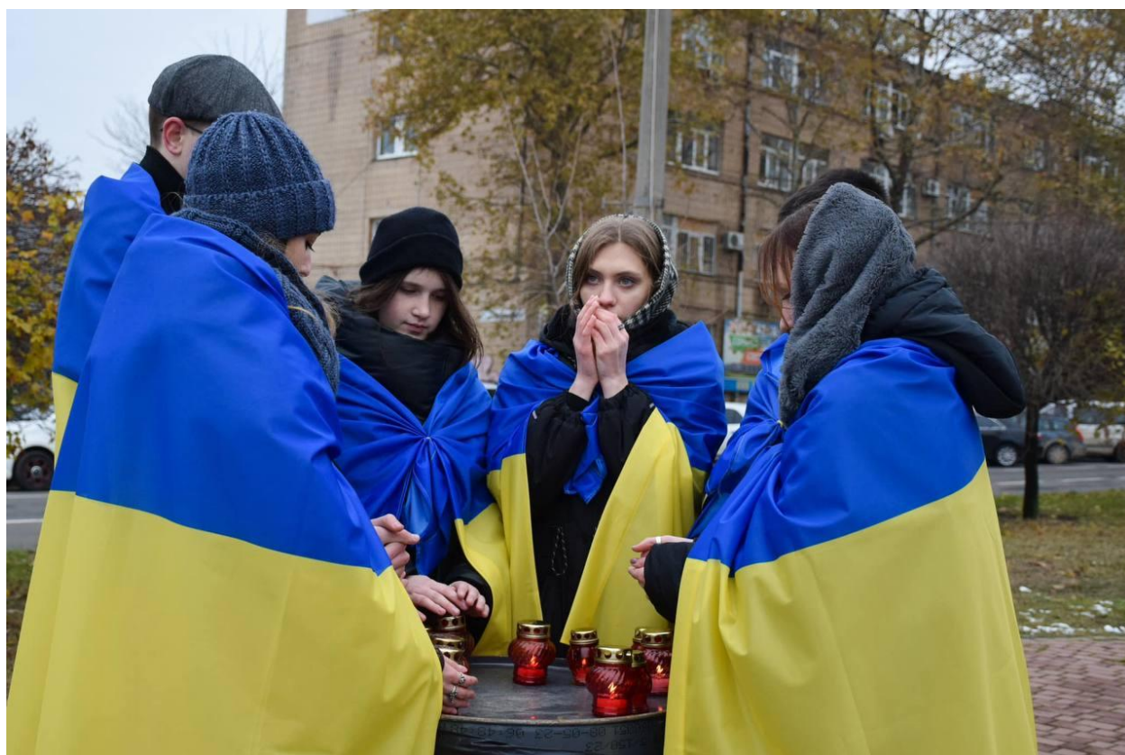
Професійна самореалізація фахівців зі сценічного мистецтва Миколаївщини