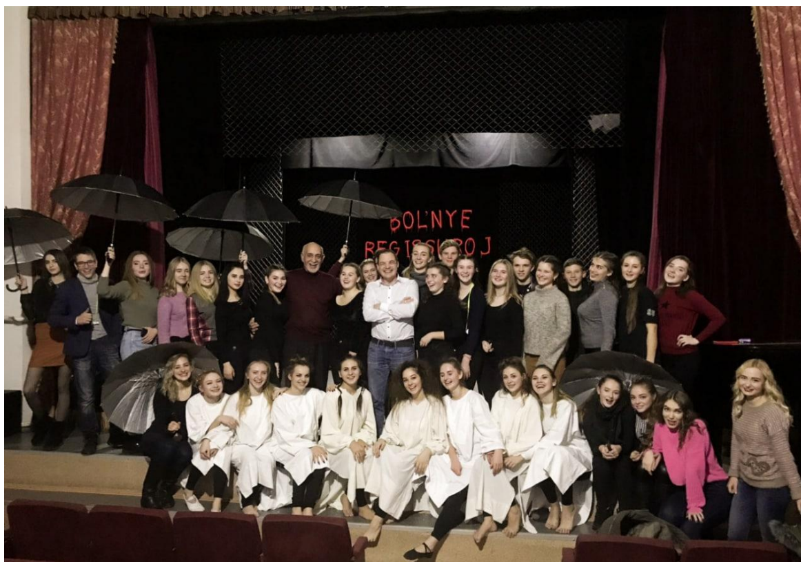
Посвята у студенти спеціальності «Сценічне мистецтво» МФККМ