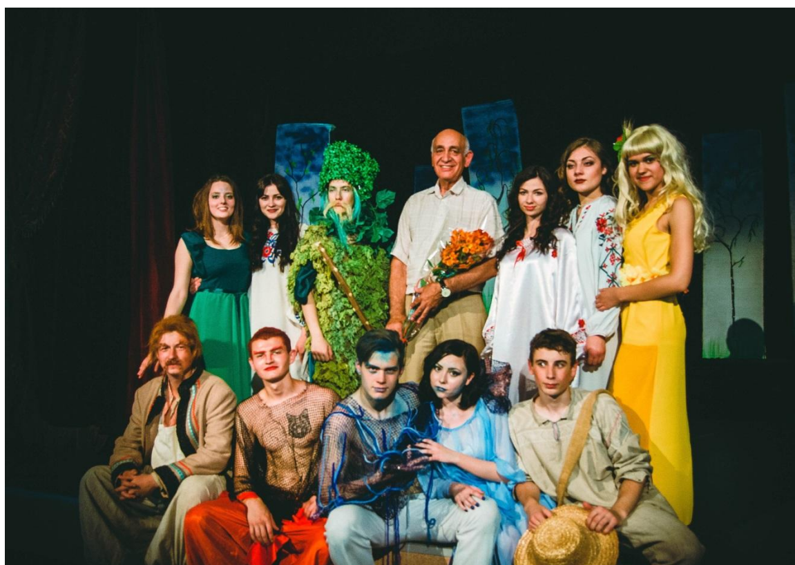
Постановки студентського театру МФККМ