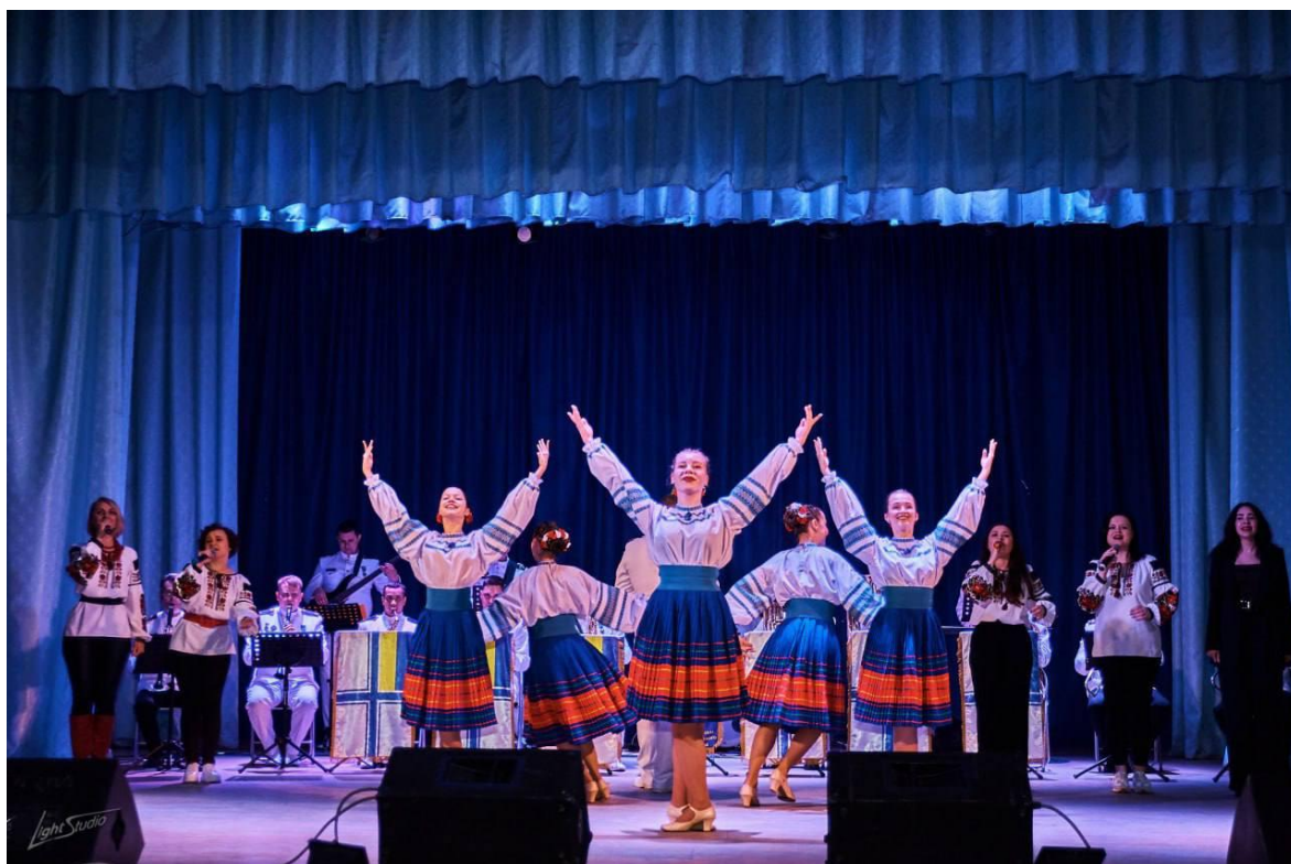
Творчий проєкт «Мистецька артилерія» 2023 р.