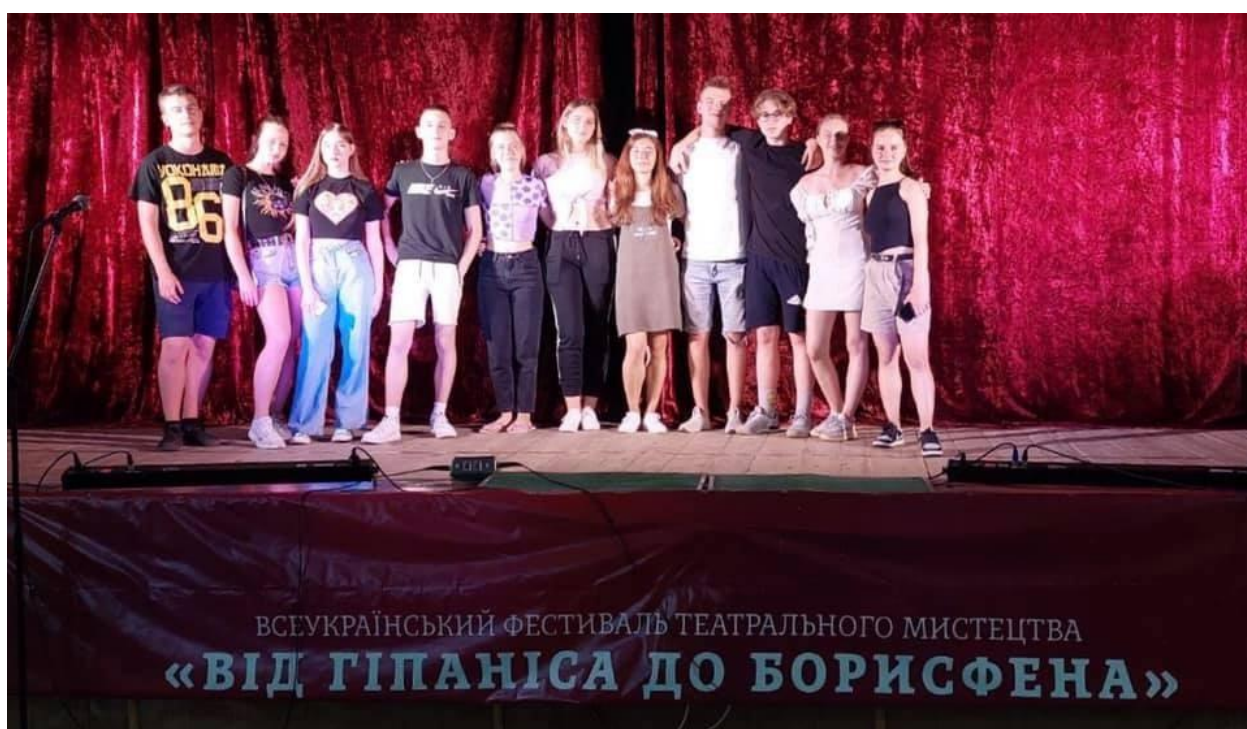
Всеукраїнський фестиваль театрального мистецтва «Від Гіпаніса до Борисфена» м. Очаків