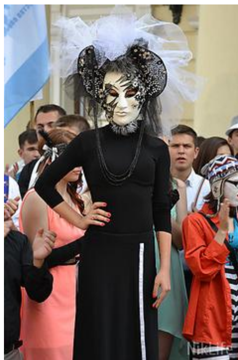
Міжнародний фестиваль «Південні маски»