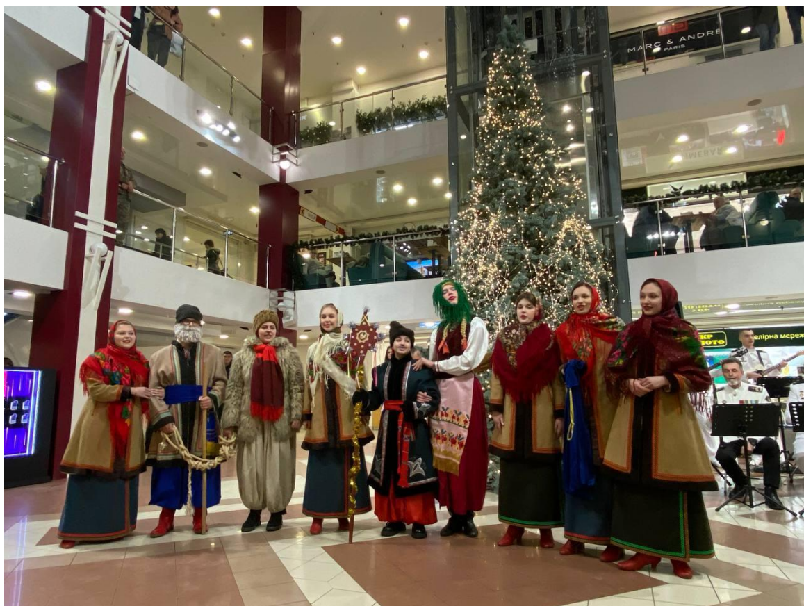
Обрядове фольклорне дійство для мешканців м. Миколаєва