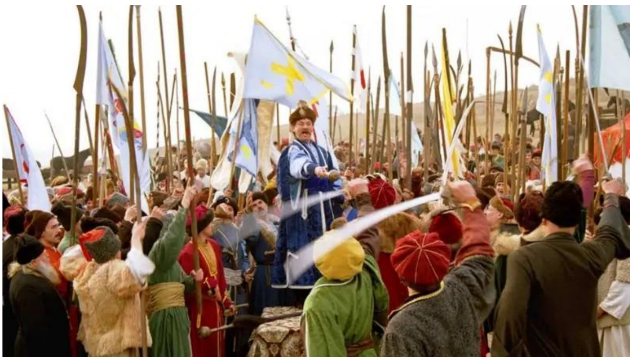
Рис.6 Богдан Ступка у фільмі «Чорна рада»