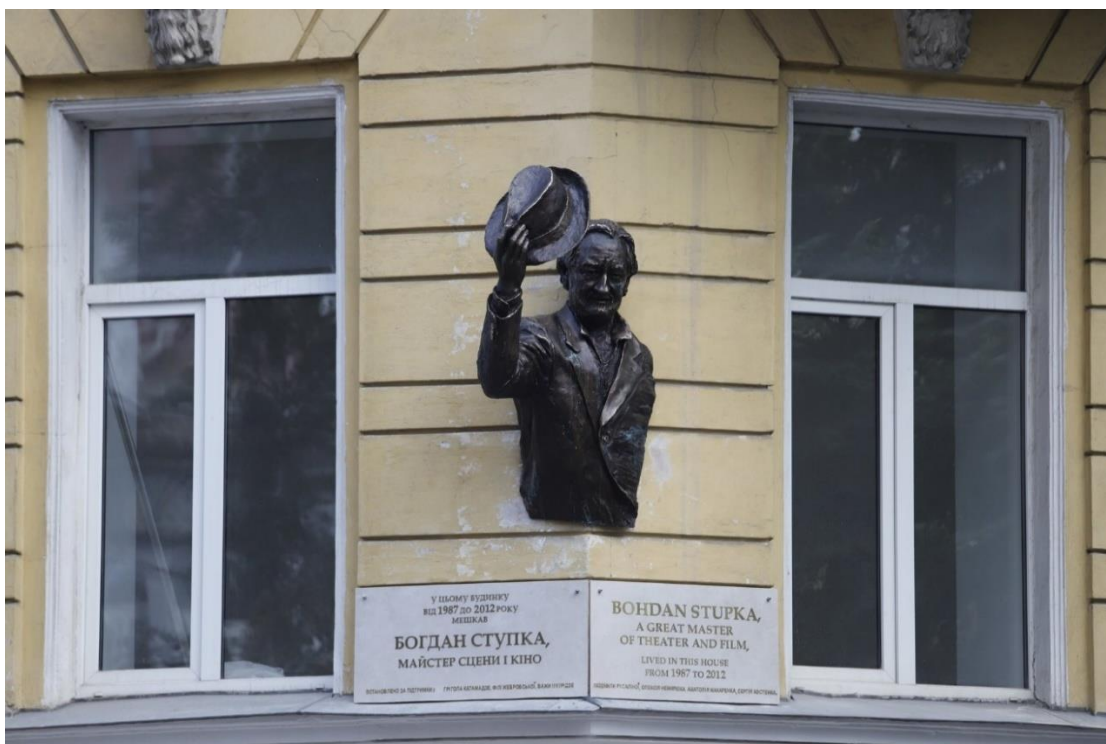
Рис.2 Меморіальна дошка-барельєф на честь Богдана Ступки