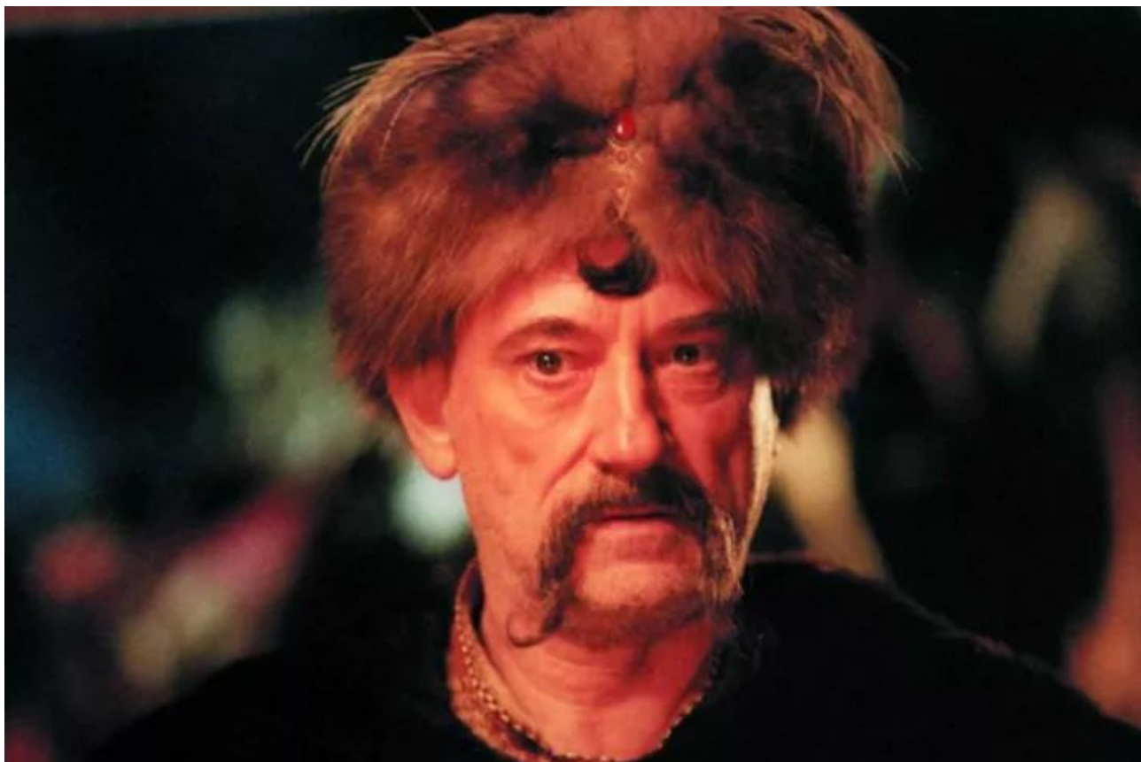
Рис.3 Богдан Ступка у фільмі «Вогнем і мечем»