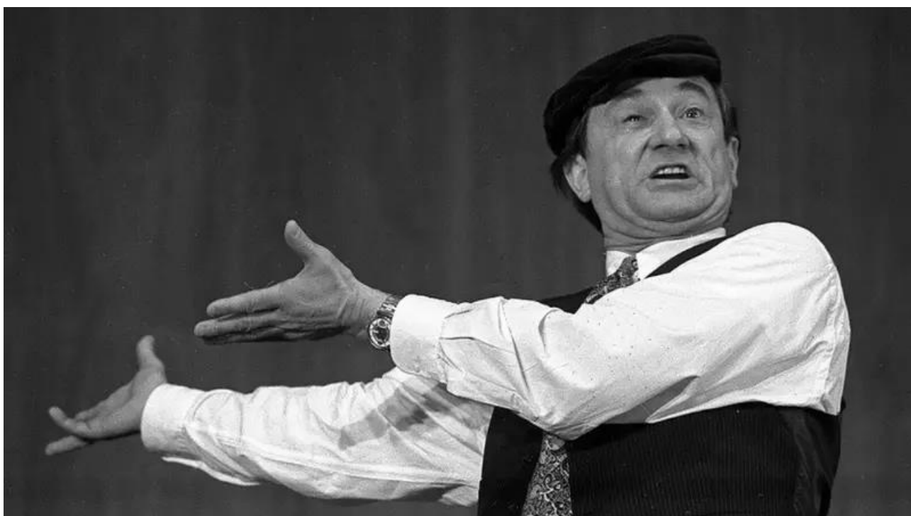
Рис.10 Богдан Ступка у п'есі «Тев'є-Тевель»