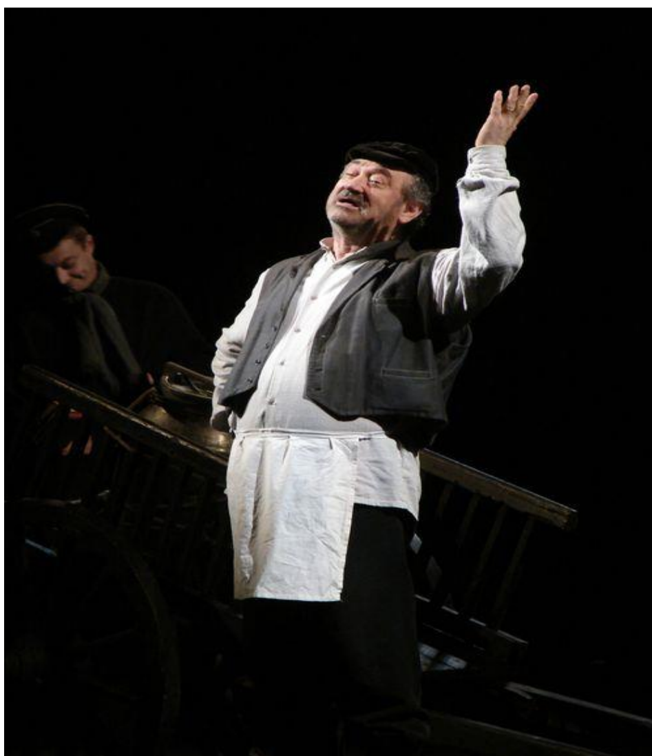
Рис.14 Богдан Ступка у ролі Тев'є