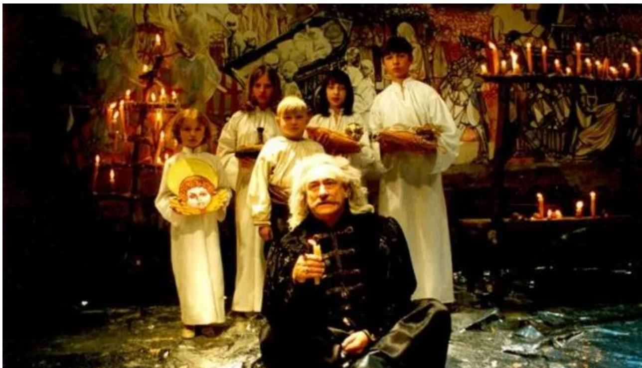
Рис.5 Богдан Ступка у фільмі «Молитва за гетьмана Мазепу»