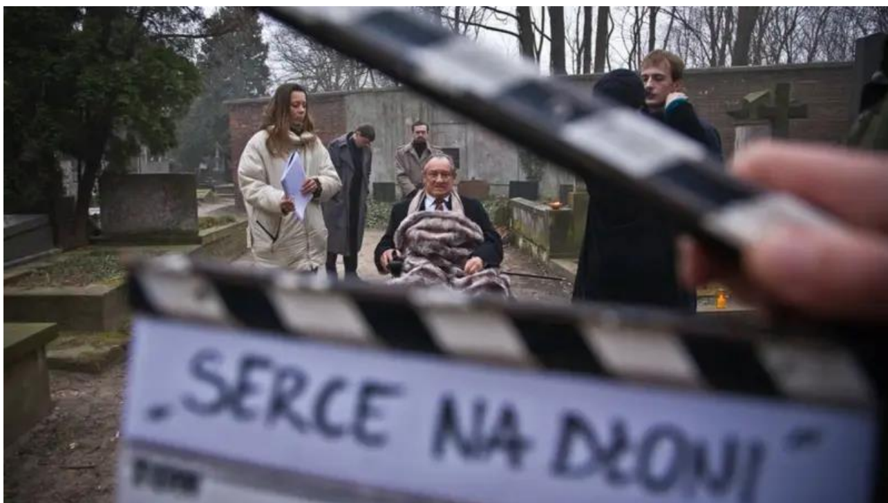
Рис.9 Богдан Ступка у фільмі «Серце на долоні»