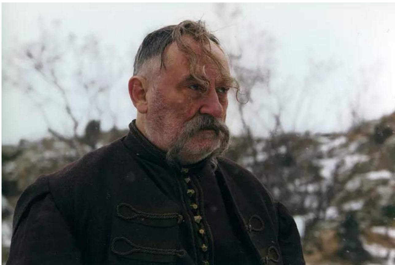
Рис.8 Богдан Ступка у фільмі «Тарас Бульба»