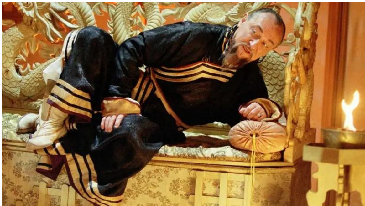
Рис.11 Богдан Ступка у фільмі «Таємниця Чингісхана»