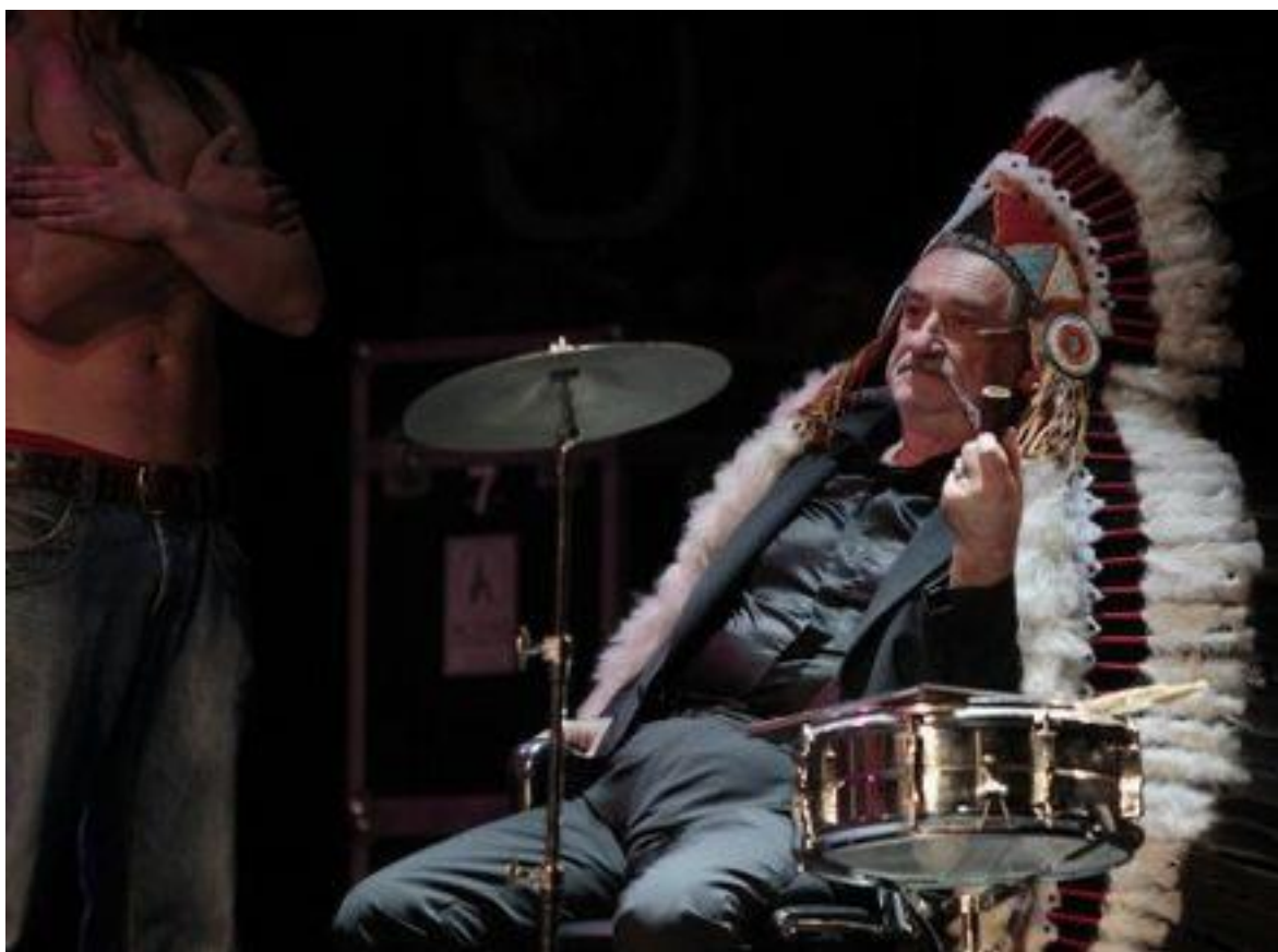
Рис.4 Богдан Ступка у ролі індіанського вождя на «Концерті №70»