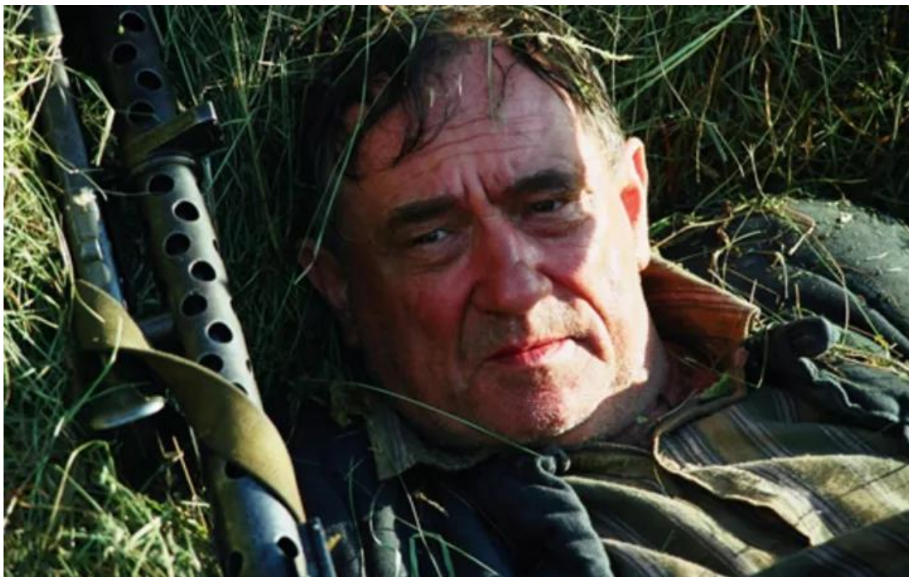
Рис.7 Богдан Ступка у фільмі «Свої»