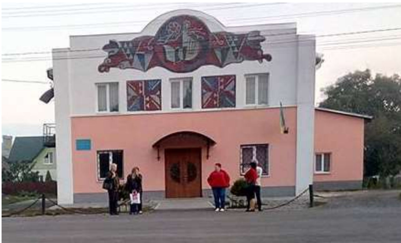
Народний будинок «Просвіта», Львівська обл., с. Підбірці