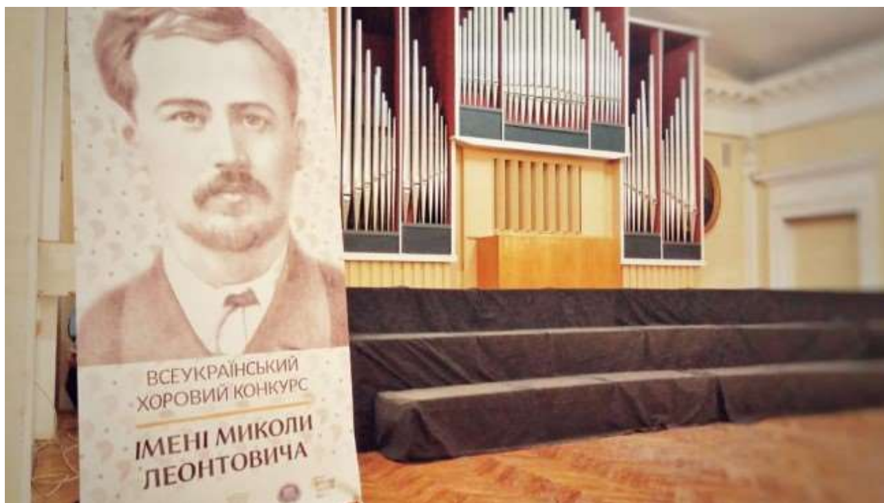
Фестиваль української пісні ім. Миколи Леонтовича, Вінницька обл.