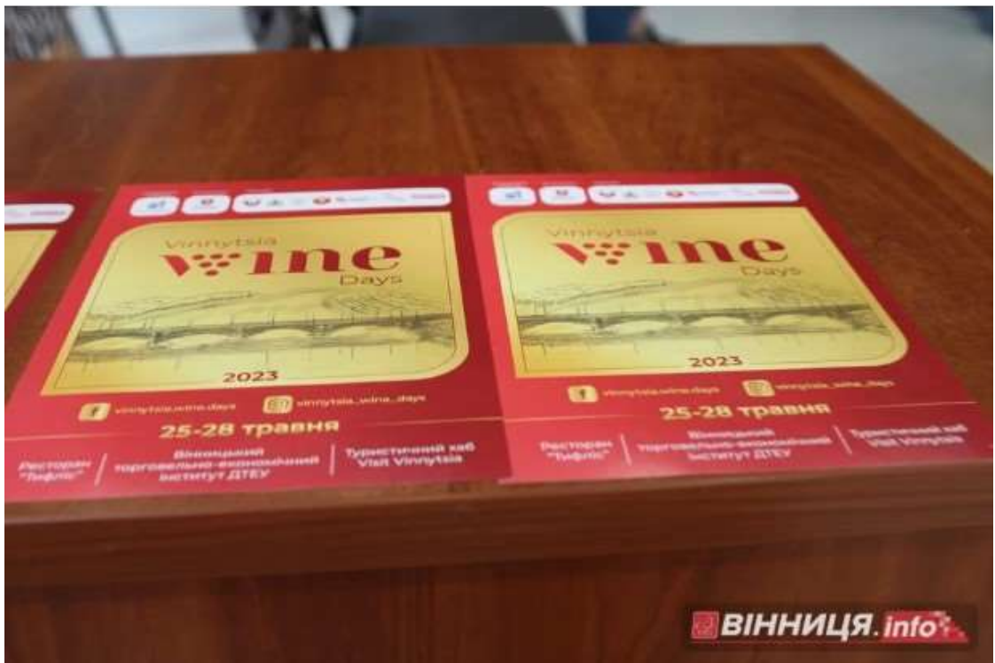
Фестиваль «Vinnytsia Wine Days», Вінницька обл.