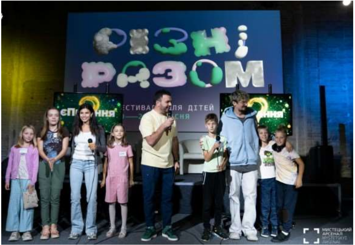
Фестиваль «Різні разом», у Мистецькому Арсеналі, м. Київ