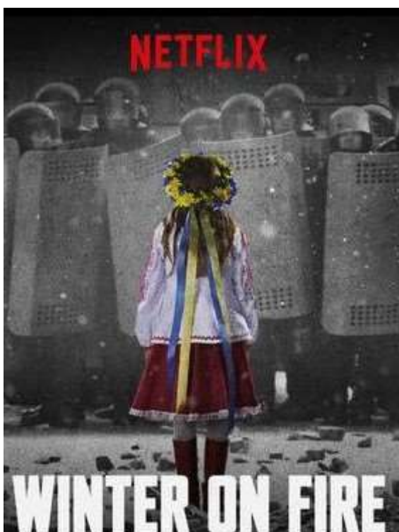
«Зима у вогні»