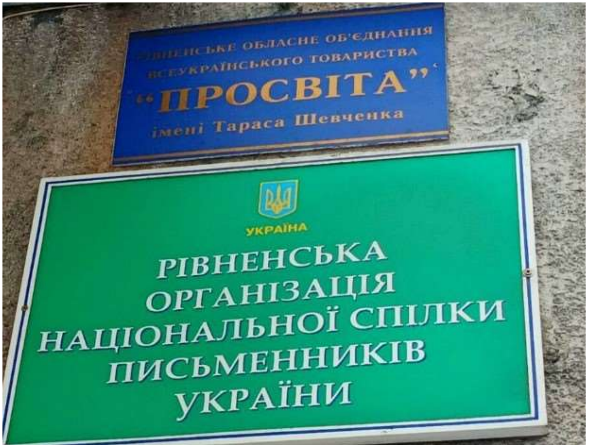
Будинок «Просвіти» Рівнинська обл.