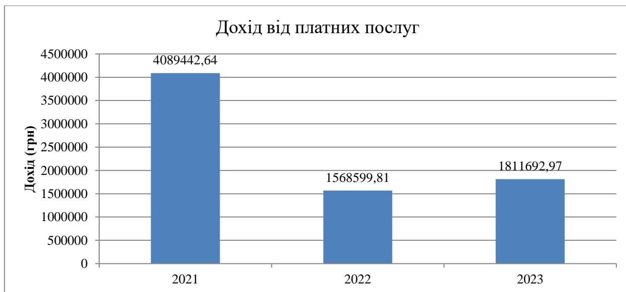
Мал. 3.2. Прибутки ОНХМ від платних послуг у 2021-2023 рр. [22-24]

Віртуальні тури. Оцифровані експозиції музею стали доступними для відвідувачів з усього світу. Віртуальні тури дозволили підтримувати інтерес до колекції та забезпечили безперервність культурного споживання.