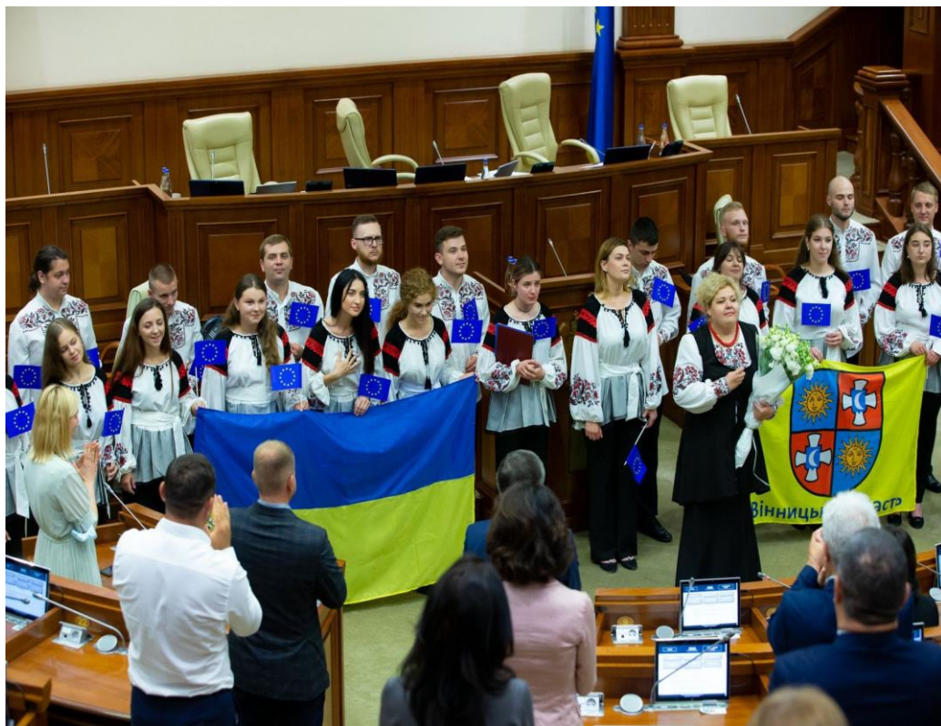
Участь «Леонтович-капела» у міжнародному проєкті «Art vs war», 2022