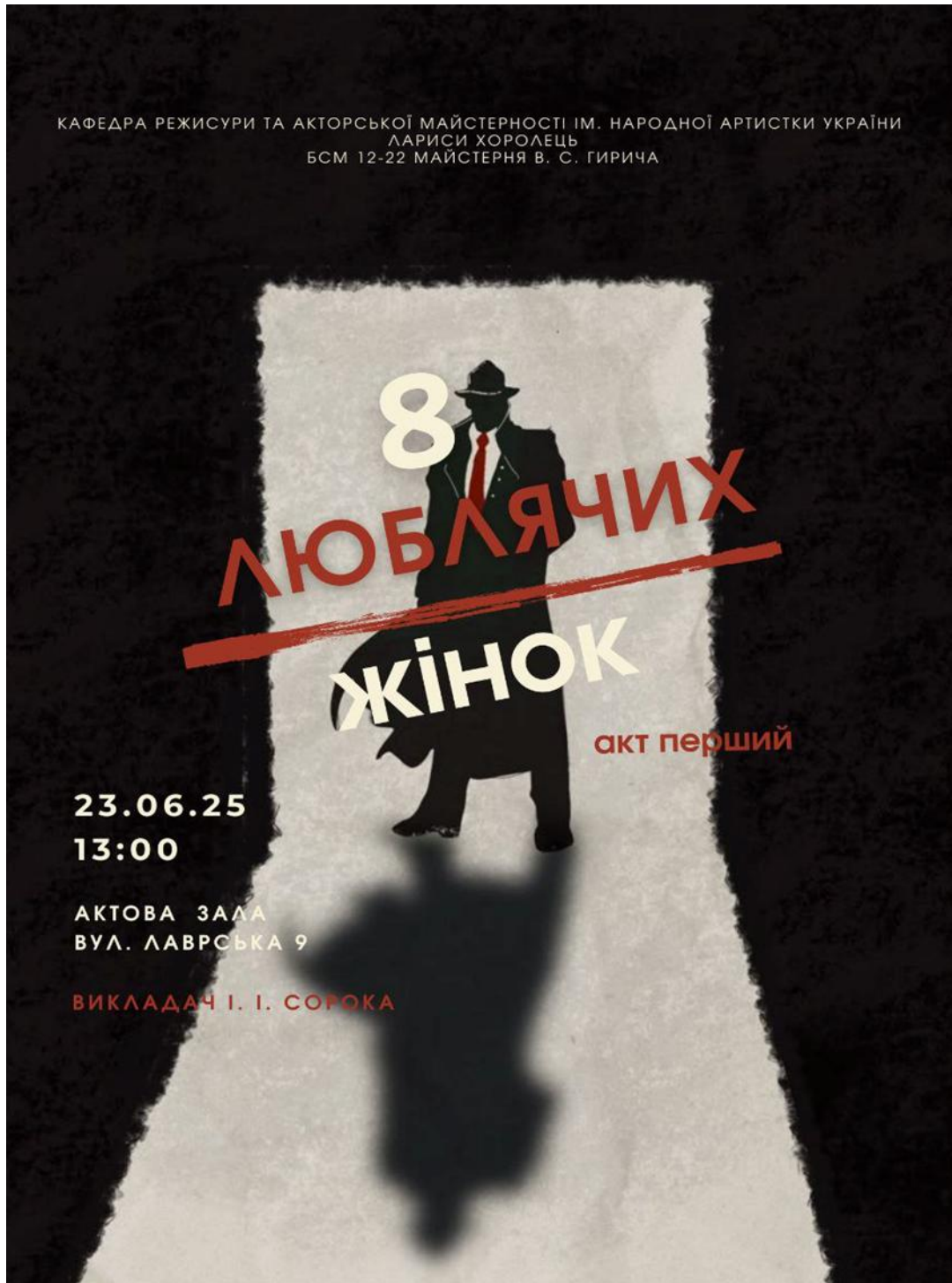
Рис. 4.2. «Афіша вистави «Вісім люблячих жінок»