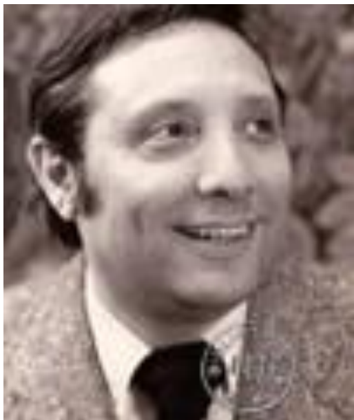
Рис. 4.1.