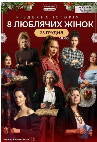
Рис. 4.3. «Афіша вистави»