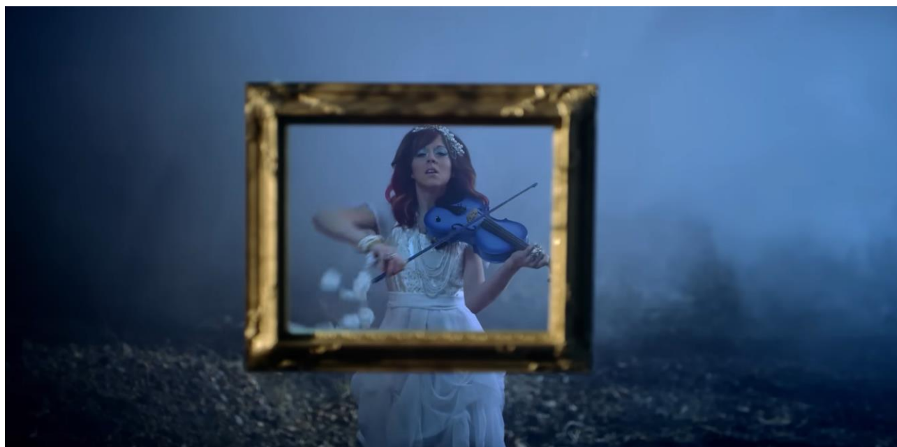
Рис. 1. Скріншот з відеокліпу Ліндсі Стірлінг «Elements»