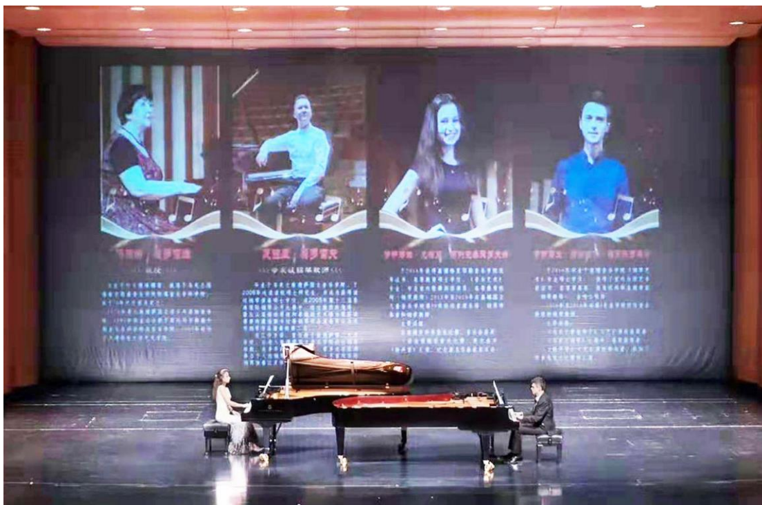
Рис. 1. Концертний рояль Steinway & sons model D-274.