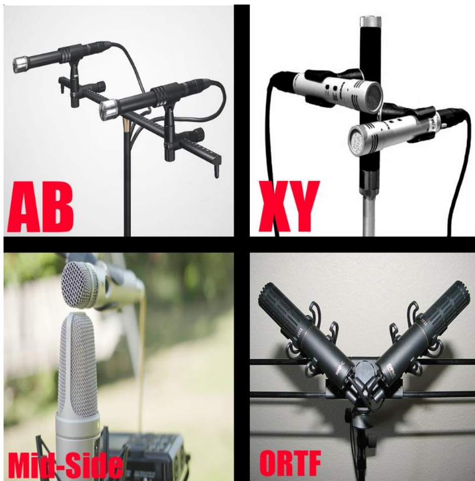
Рис. 2.2. Приклади мікрофонування АВ, XY, Mid-Side, ORTF.