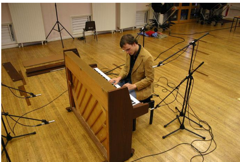
Рис. 3. Мультимікрофонний запис.